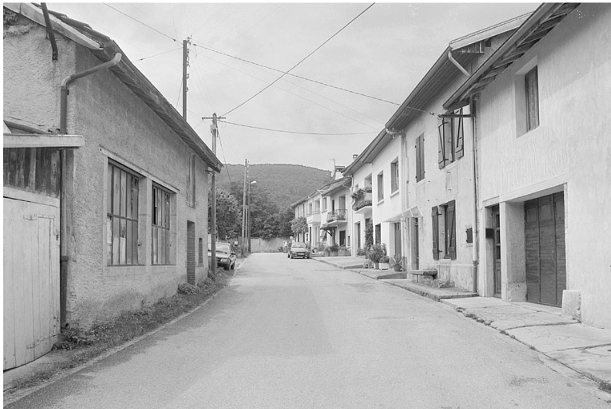
Rue du curé Marquis.