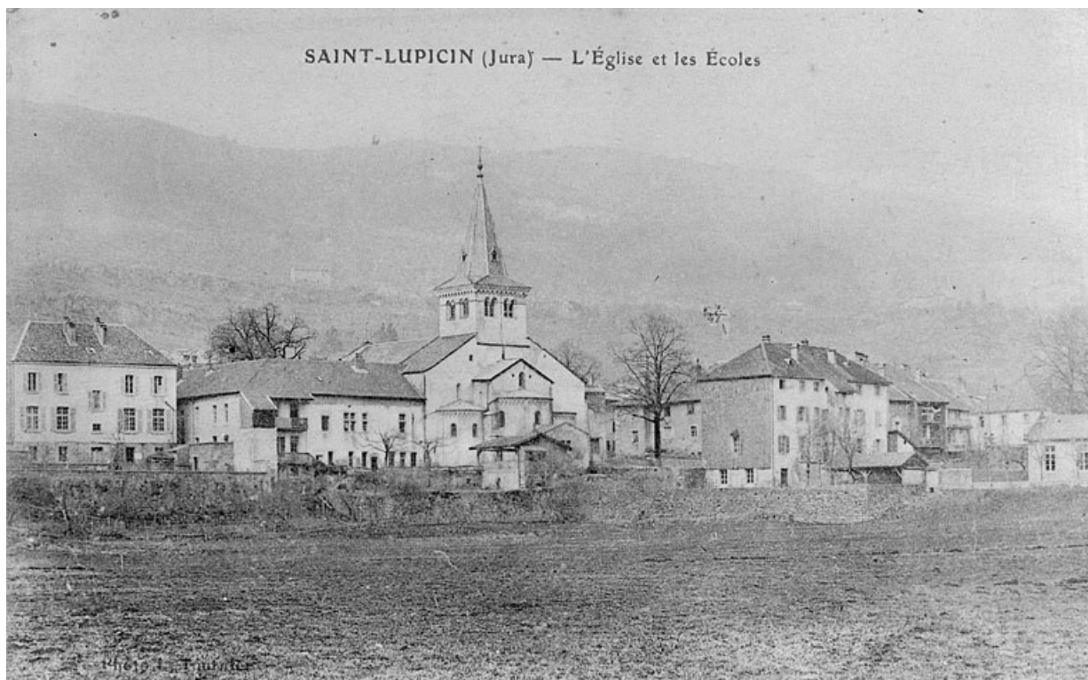
Saint-Lupicin (Jura) - L'Eglise et les Ecoles.