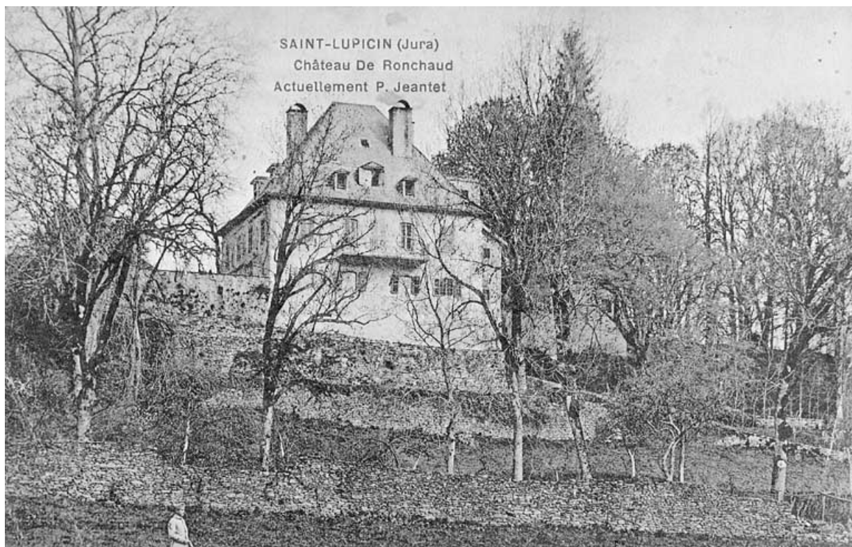
Château de Ronchaud. 39, Saint-Lupicin