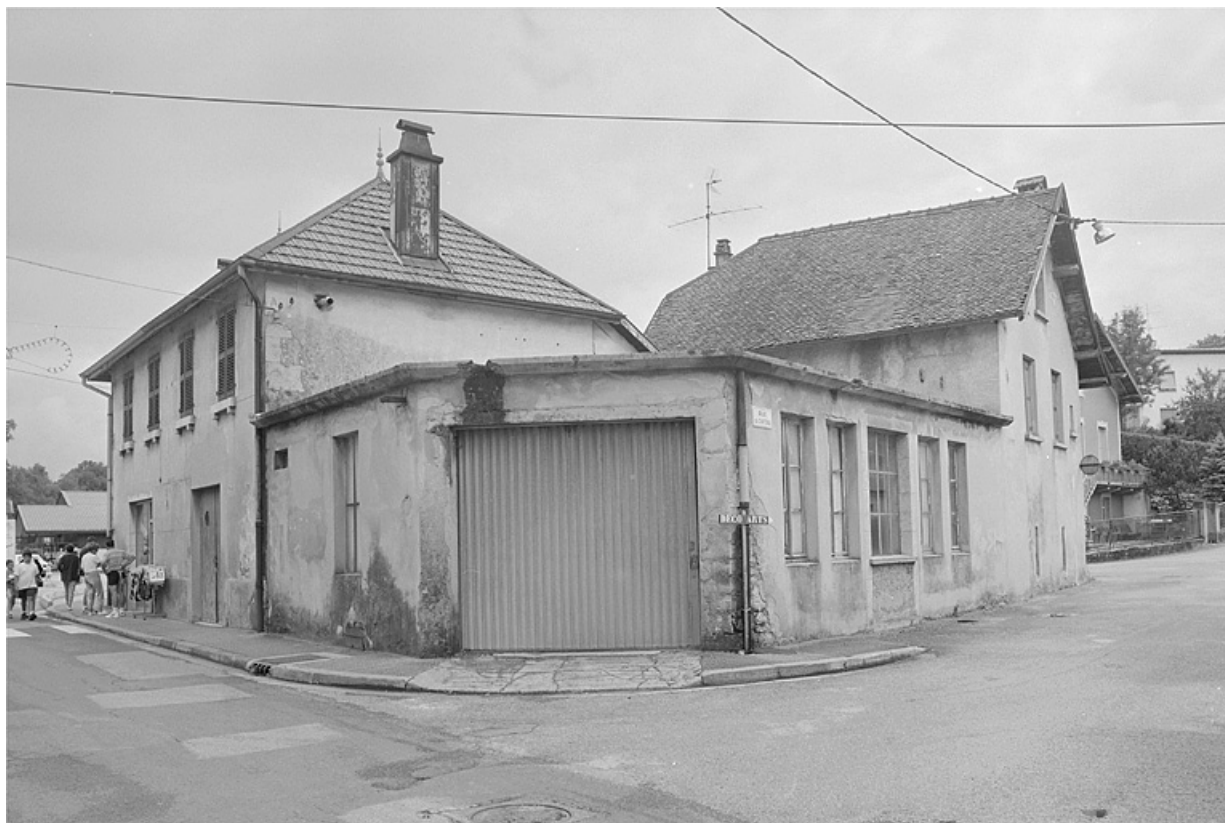
Ancienne mairie et ancienne fromagerie.