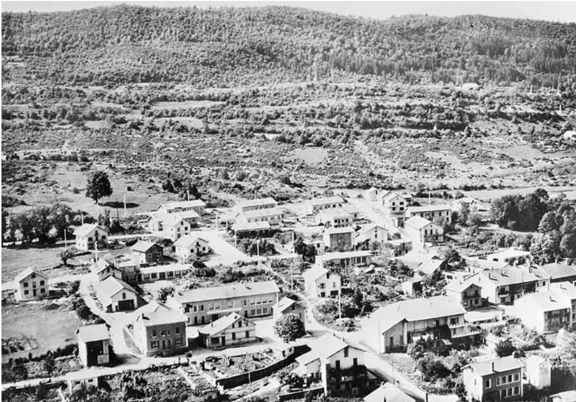
La cité des Castors.