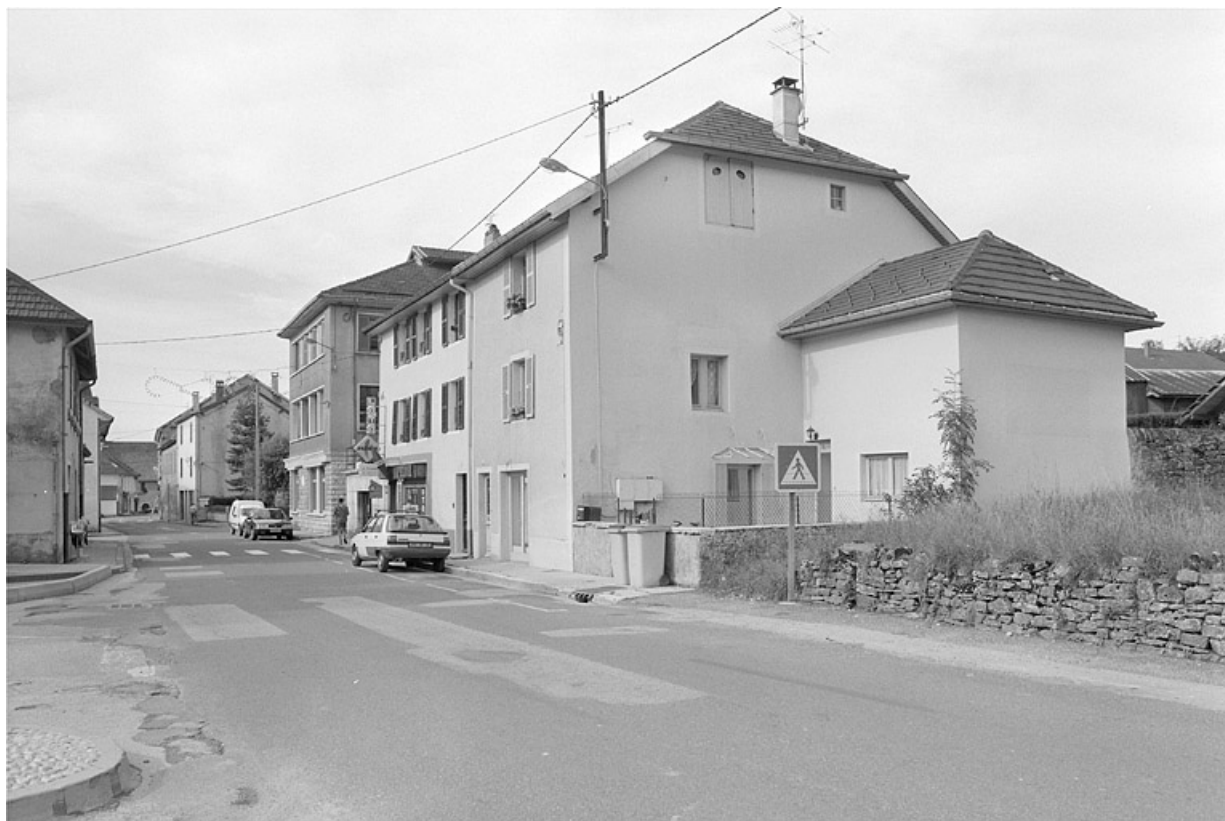
Rue du Jura avec le magasin de la Fraternelle. 39, Saint-Lupicin