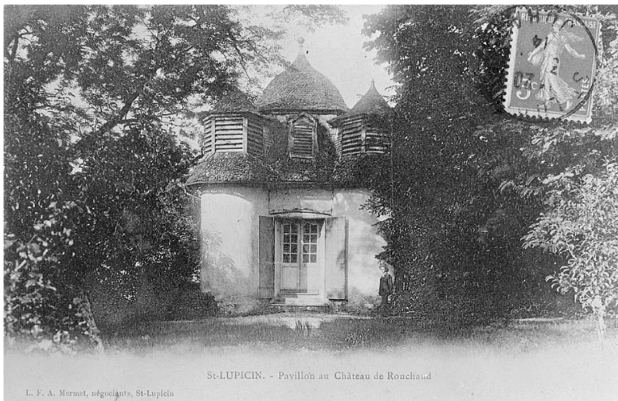
St. Lupicin. Pavillon au Château de Ronchaud.