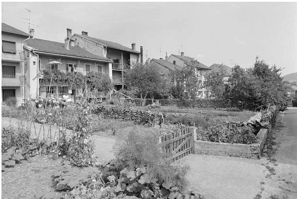
Chemin des Jardins, façades postérieures des maisons.