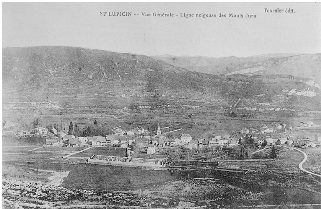
Saint-Lupicin. Vue générale.