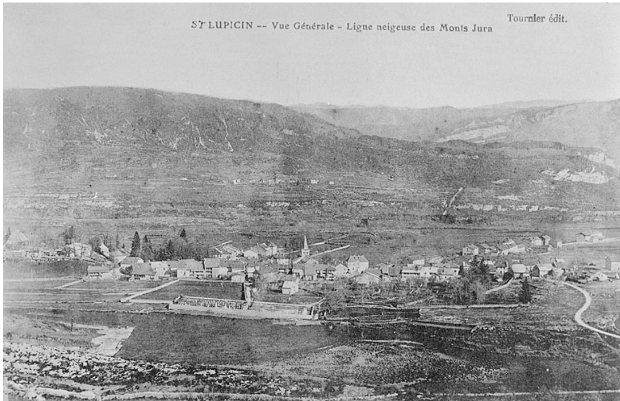
Saint-Lupicin. Vue générale.