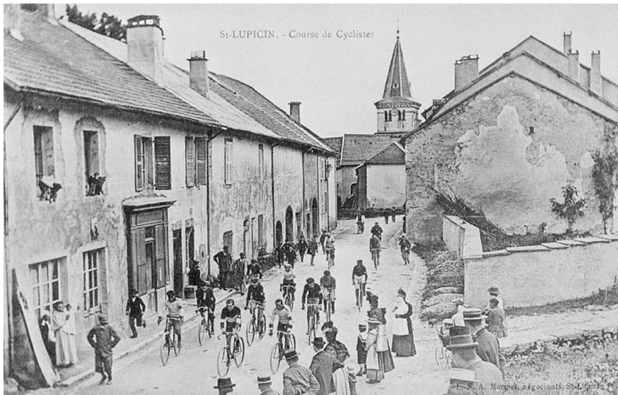
Saint-Lupicin. Course de cyclistes : la rue principale.