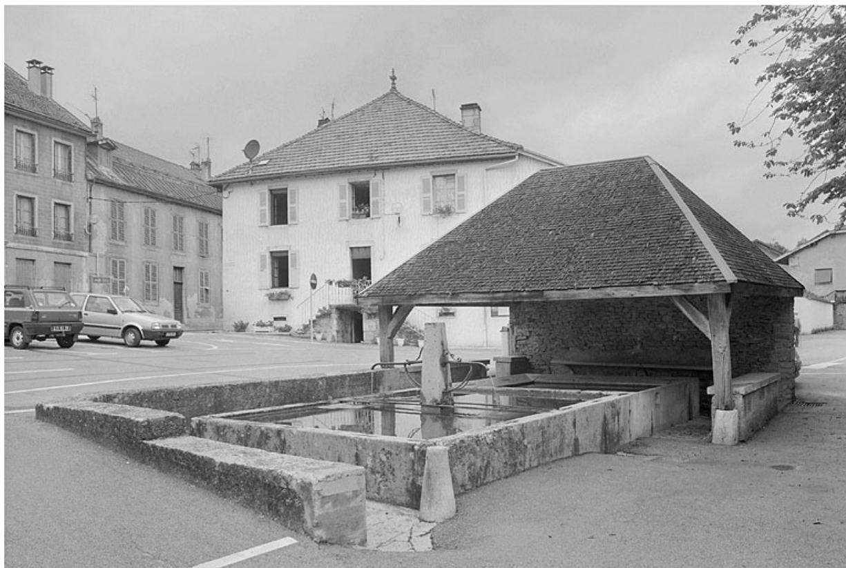
Place de la fontaine, la fontaine-lavoir.