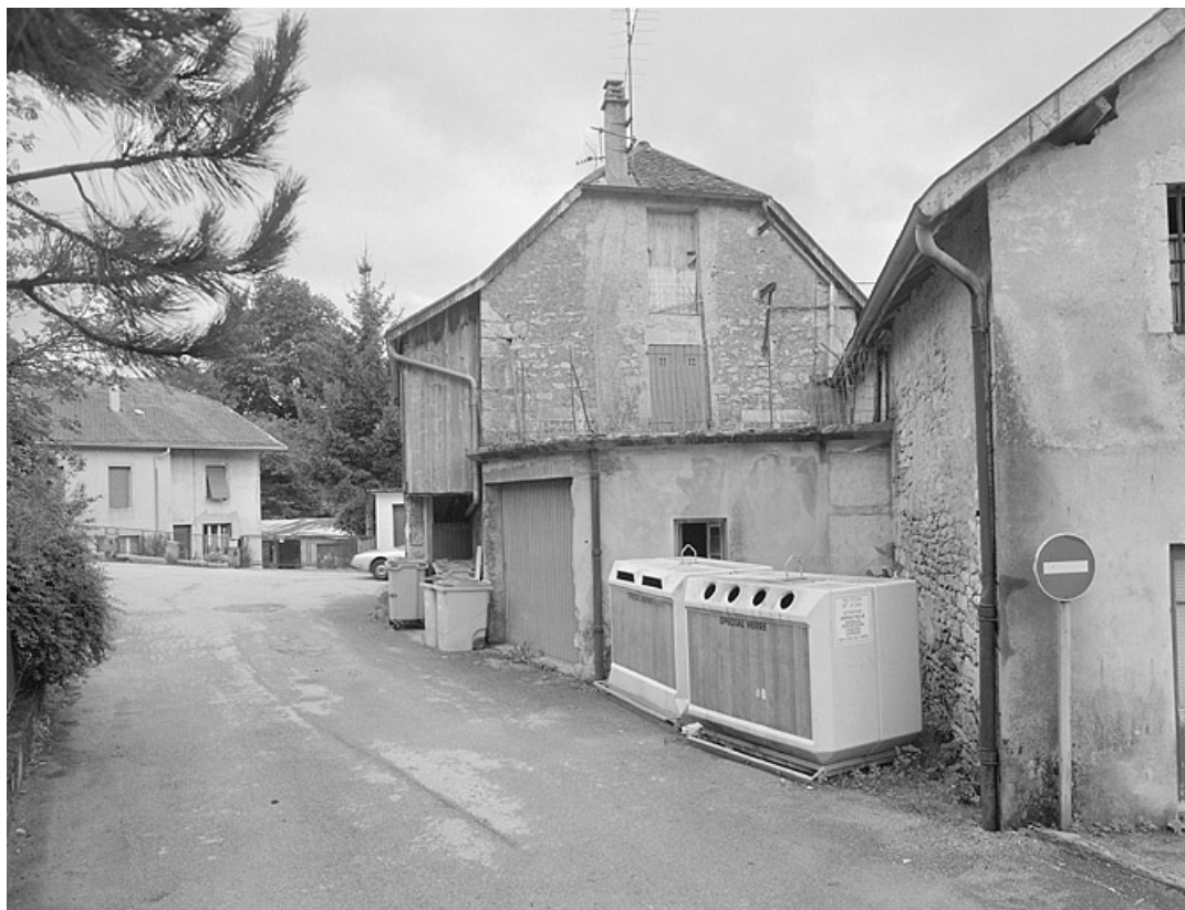
Face droite de l'ancienne fromagerie.