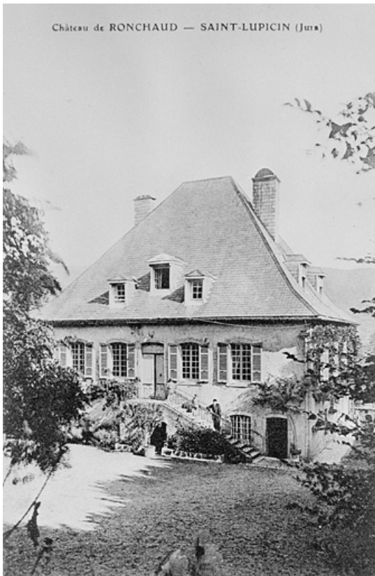
Façade principale du château de Ronchaud. 39, Saint-Lupicin