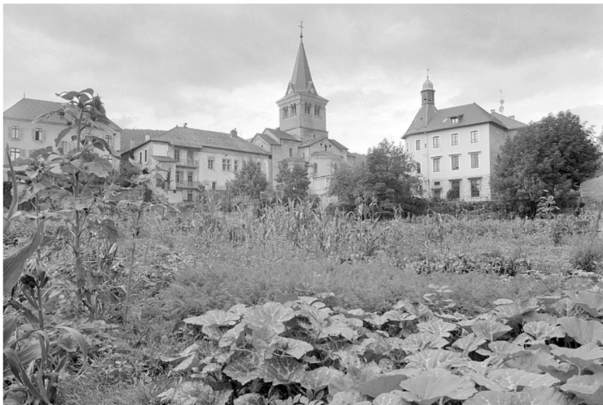
L'église paroissiale et l'ancienne mairie, à droite.