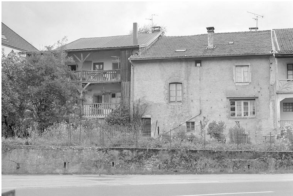
Grande Rue, façades postérieures d'anciennes fermes. 39, Saint-Lupicin