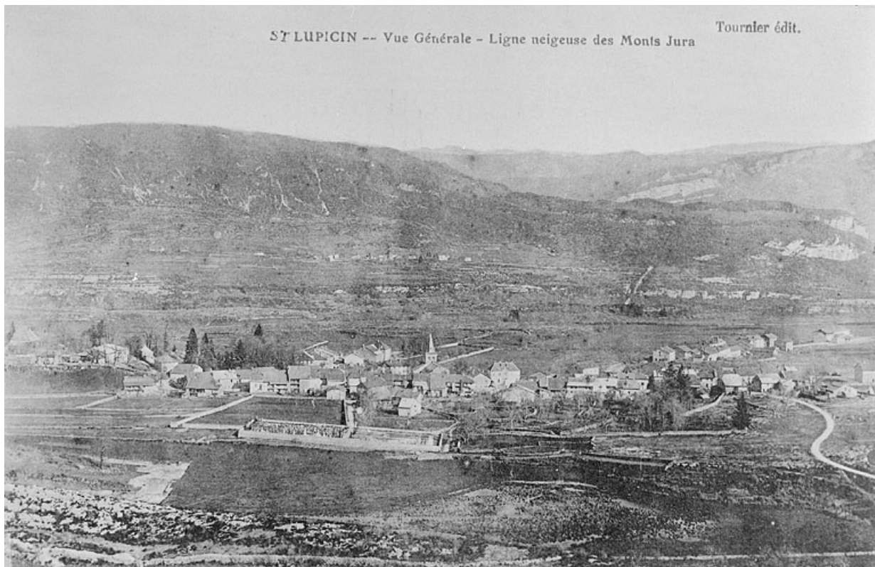
Saint-Lupicin. Vue générale. 39, Saint-Lupicin