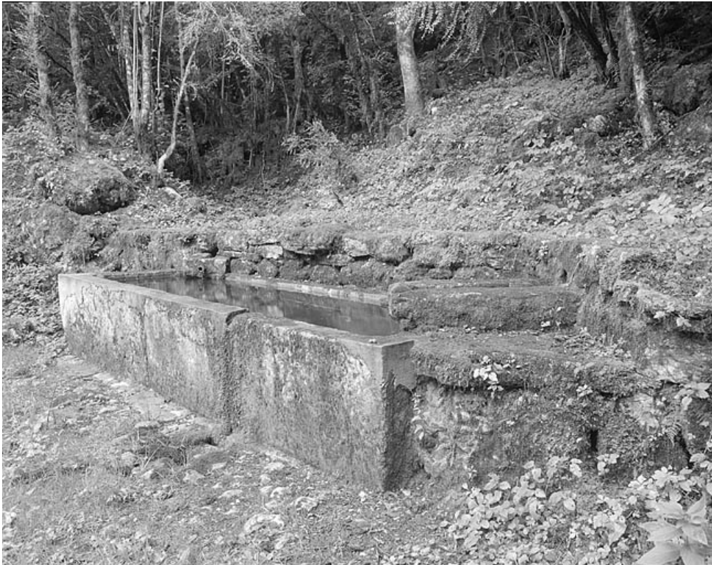
Le bassin vu de trois quarts.