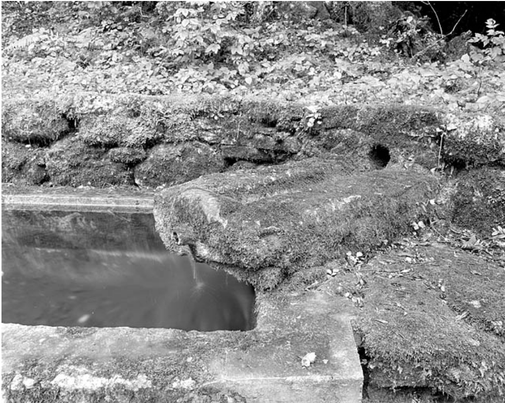
Détail d'une goulotte en pierre amenant l'eau dans le bassin.