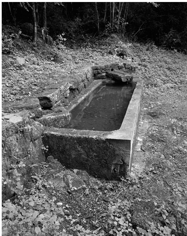
Le bassin, de profil.