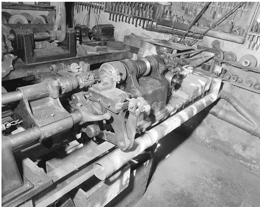
Tour automatique, permettant de travailler la galalithe, datant de 1920 environ.