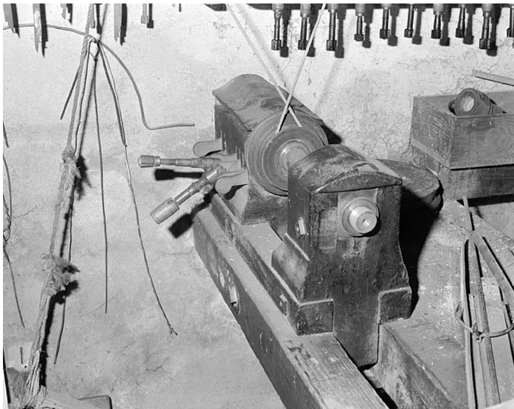
Tour à marchepied : clavier et clés de sélection.