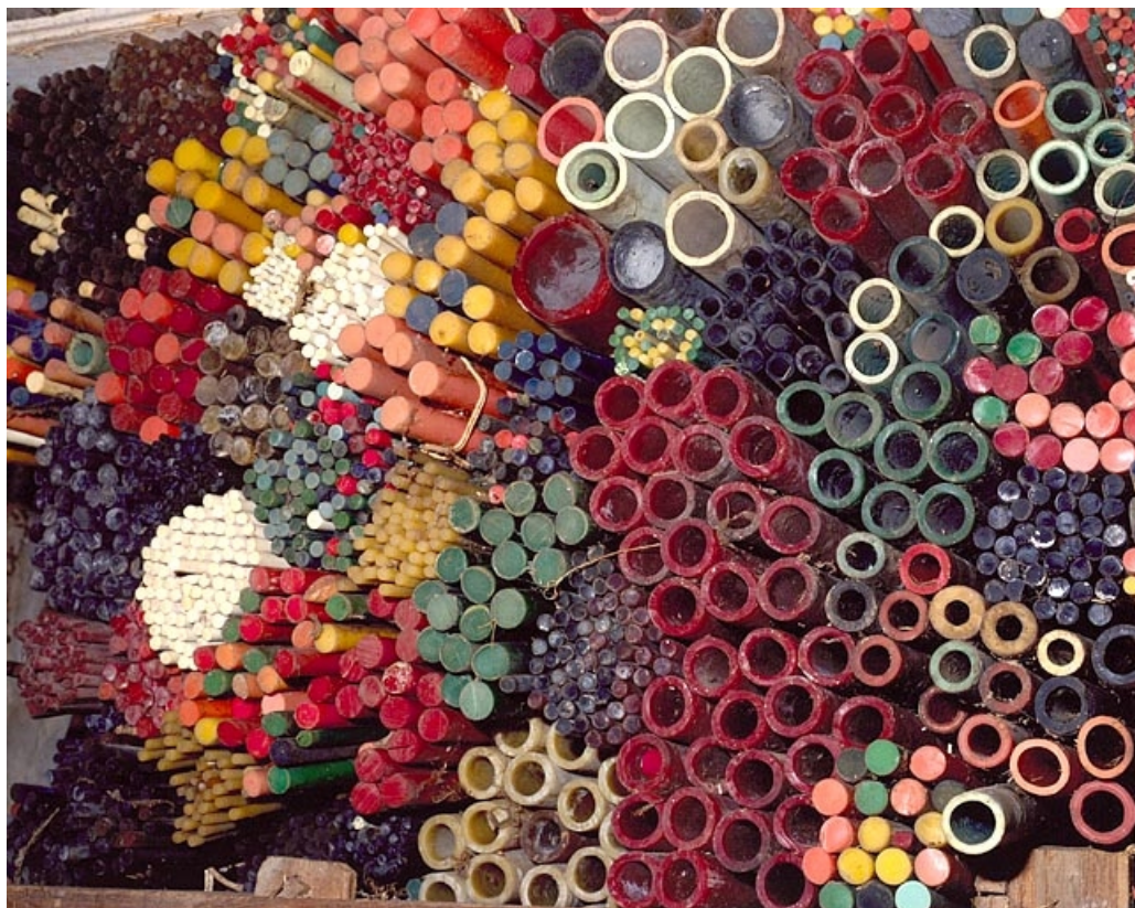
Tubes de galalithe avant transformation.