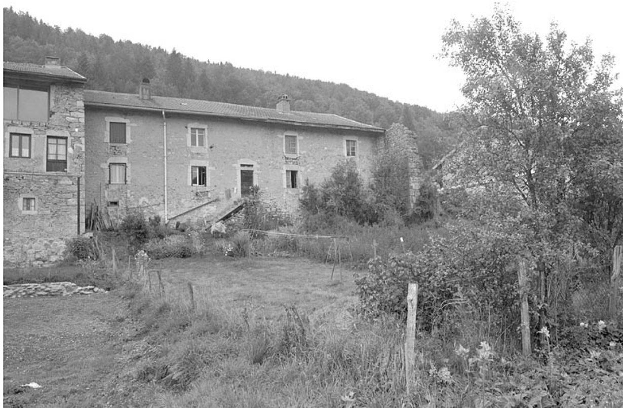
Façade postérieure, vue générale.