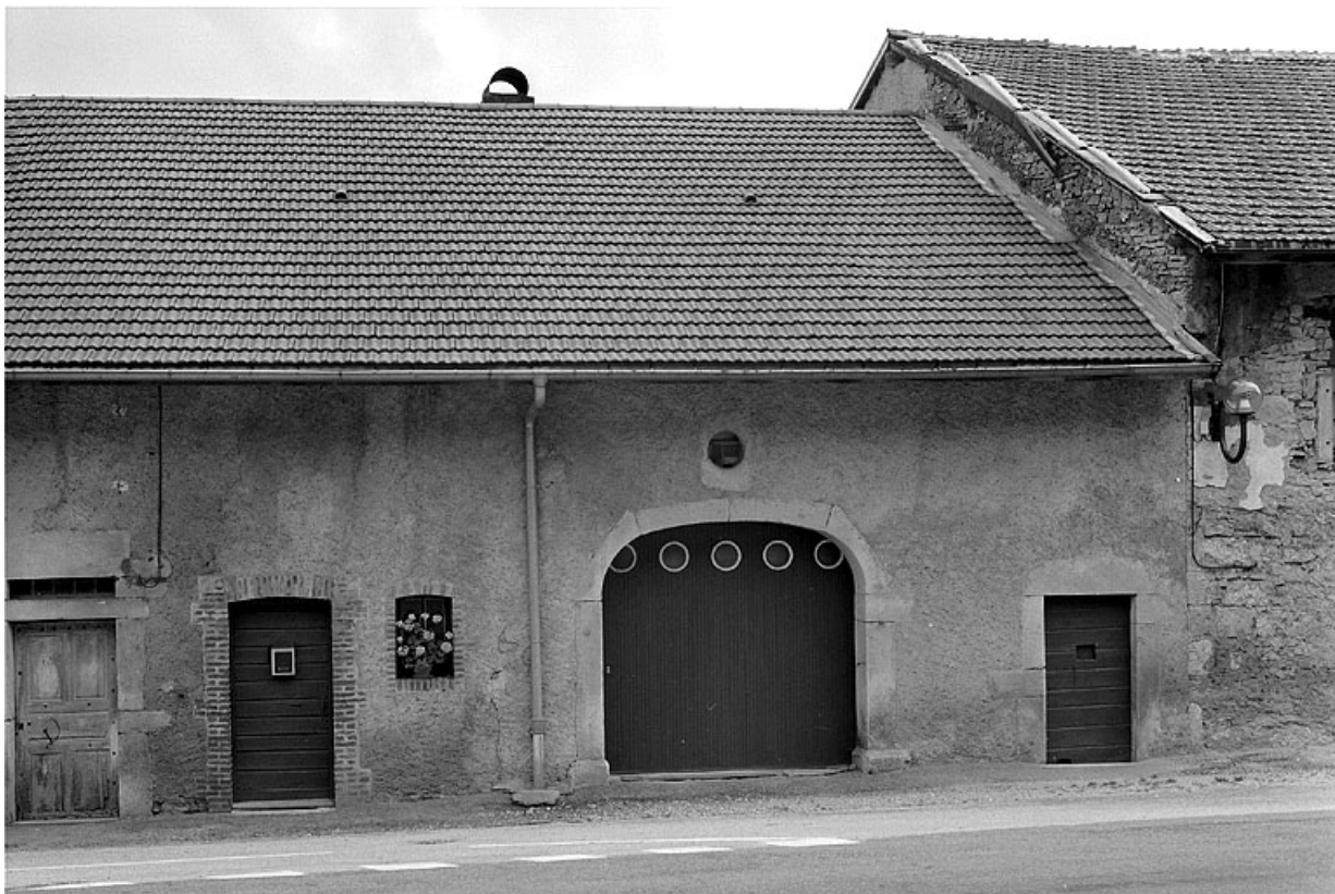
Façade sur la rue.