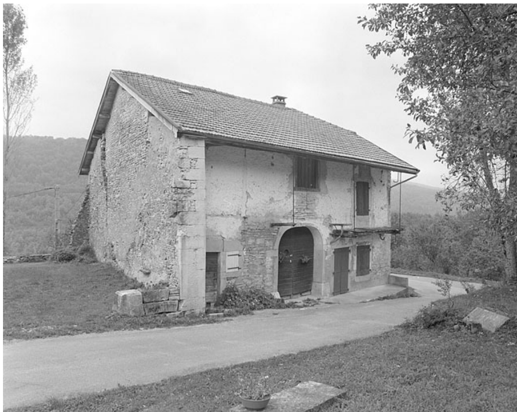
Face gauche et façade antérieure.