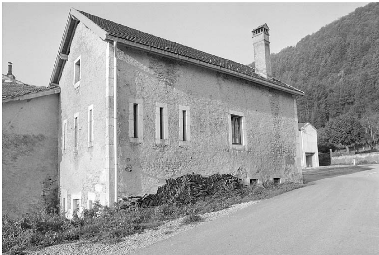
Face gauche et façade postérieure.