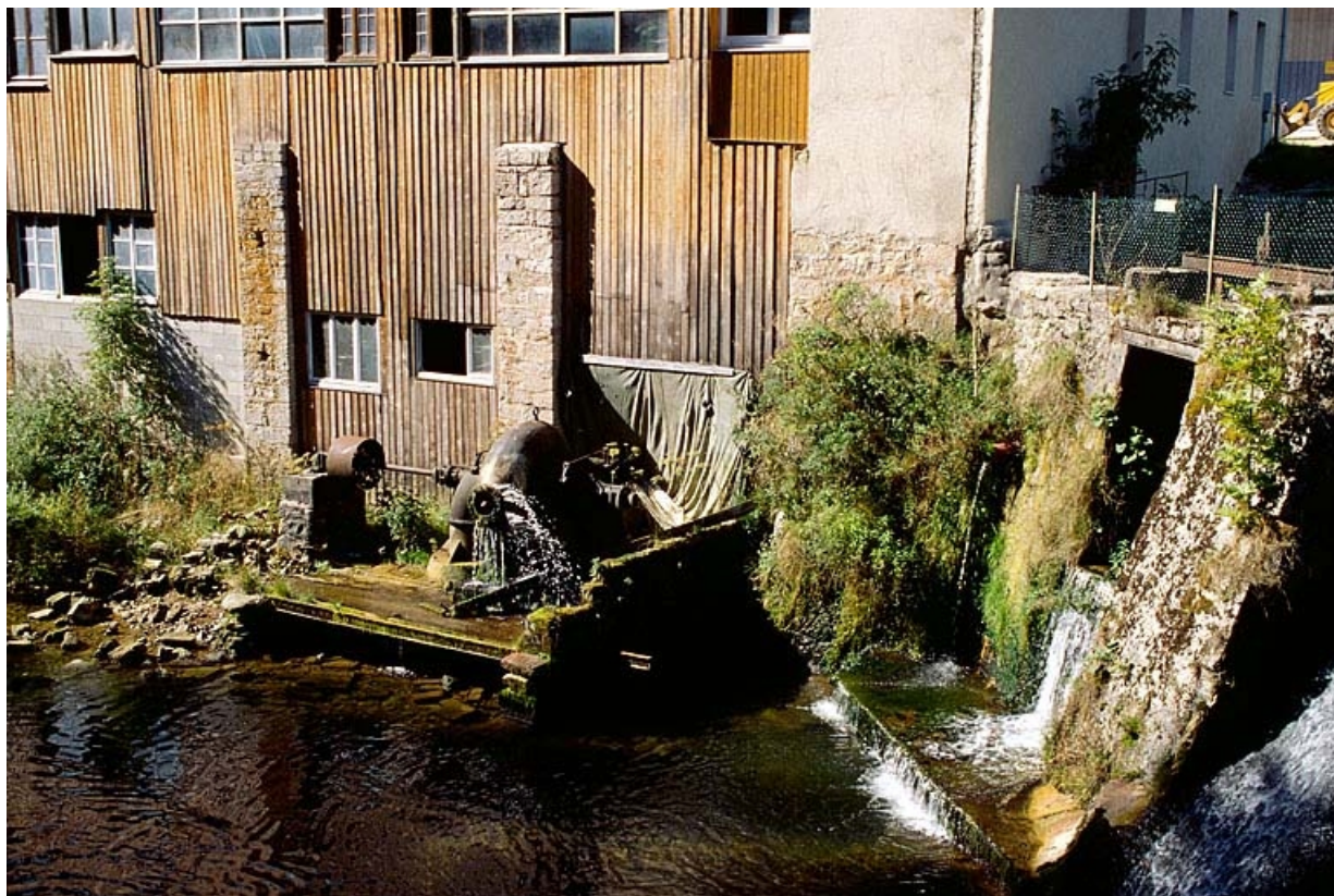
Moulin Choudet : la turbine et le barrage. 39, Fonceine-le-Haut Grande Rue 1, 2, 4, 6, 8