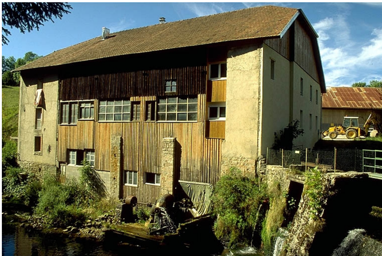
Façade postérieure du moulin Choudet.

39, Fonceine-le-Haut Grande Rue 1, 2, 4, 6, 8