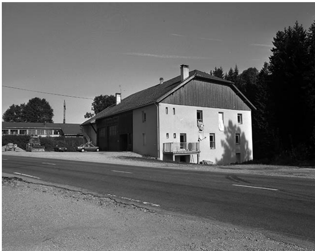
Le moulin Choudet vu de trois quarts droit.

39, Fonceine-le-Haut Grande Rue 1, 2, 4, 6, 8