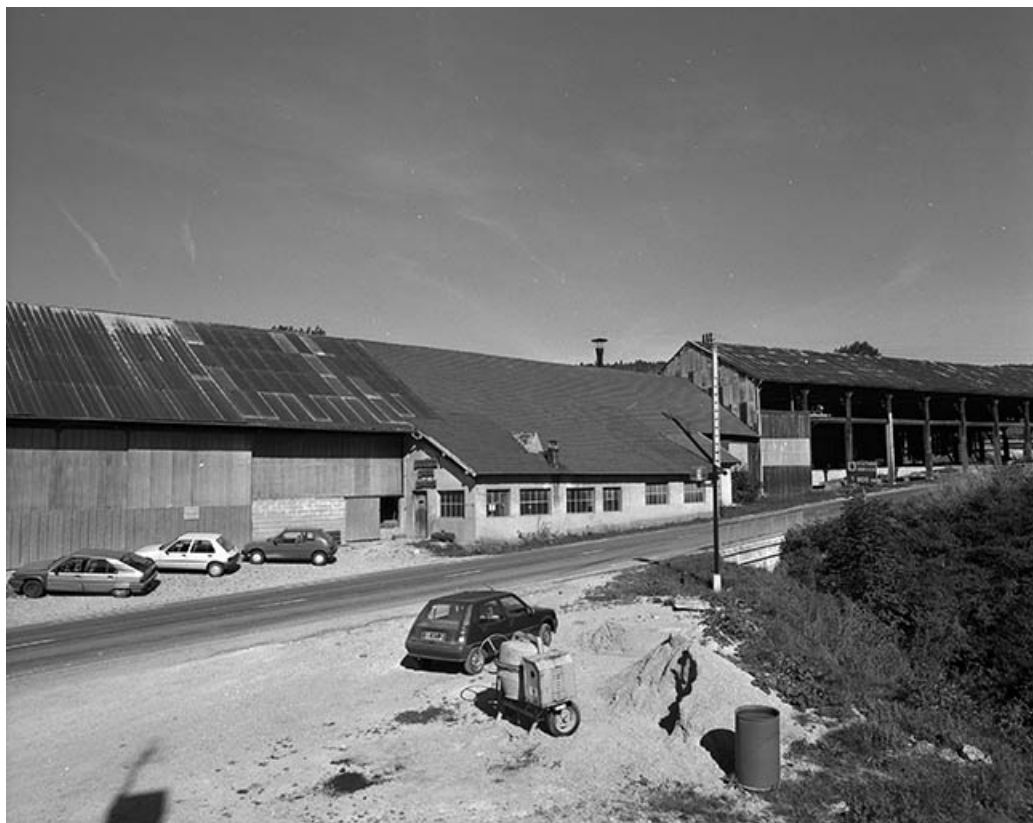
Atelier de fabrication et entrepôt industriel vus de trois quarts.

39, Fonceine-le-Haut Grande Rue 1, 2, 4, 6, 8