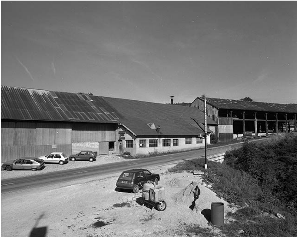
Atelier de fabrication et entrepôt industriel vus de trois quarts.

39, Fonceine-le-Haut Grande Rue 1, 2, 4, 6, 8