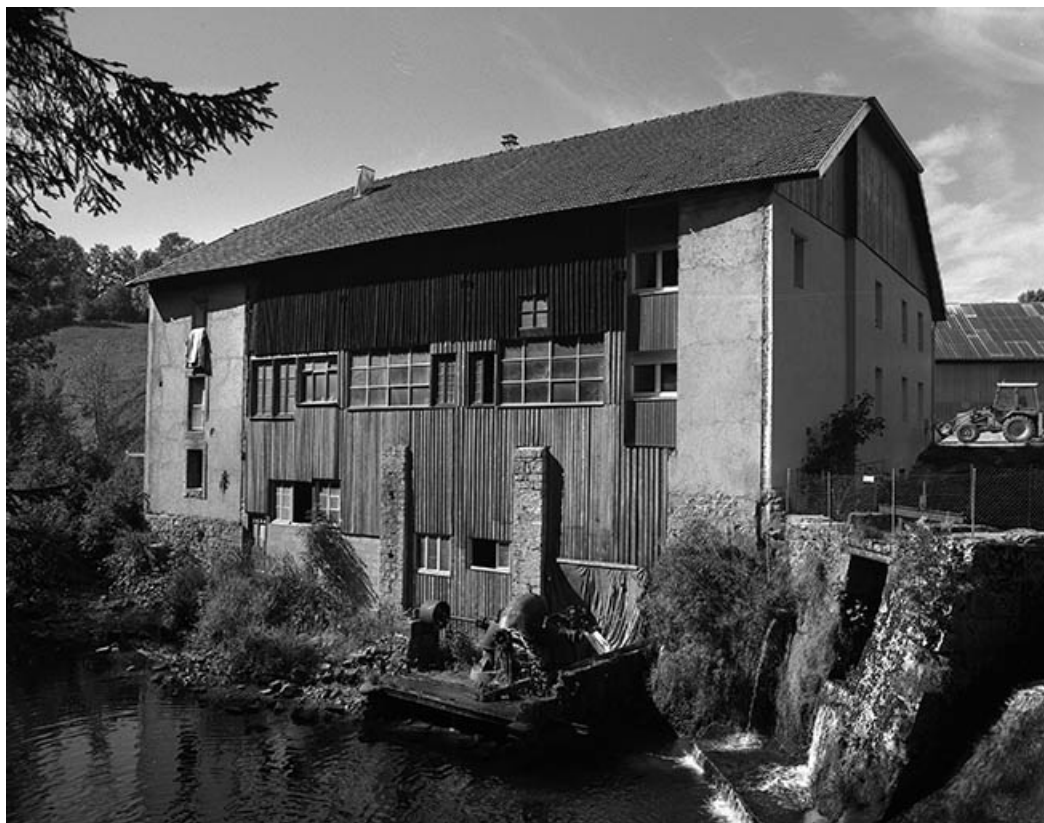
Façade postérieure du moulin Choudet.

39, Fonceine-le-Haut Grande Rue 1, 2, 4, 6, 8