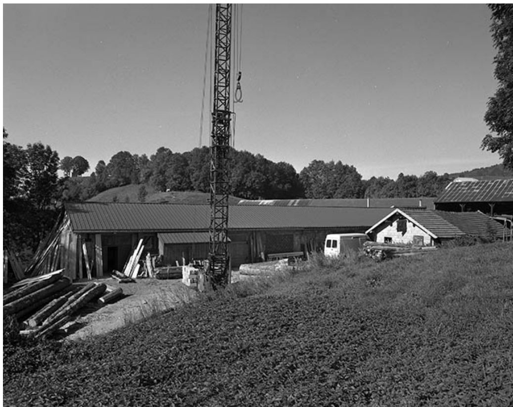
L'ancien atelier de taille du diamant depuis le nord-est.

39, Fonceine-le-Haut Grande Rue 1, 2, 4, 6, 8