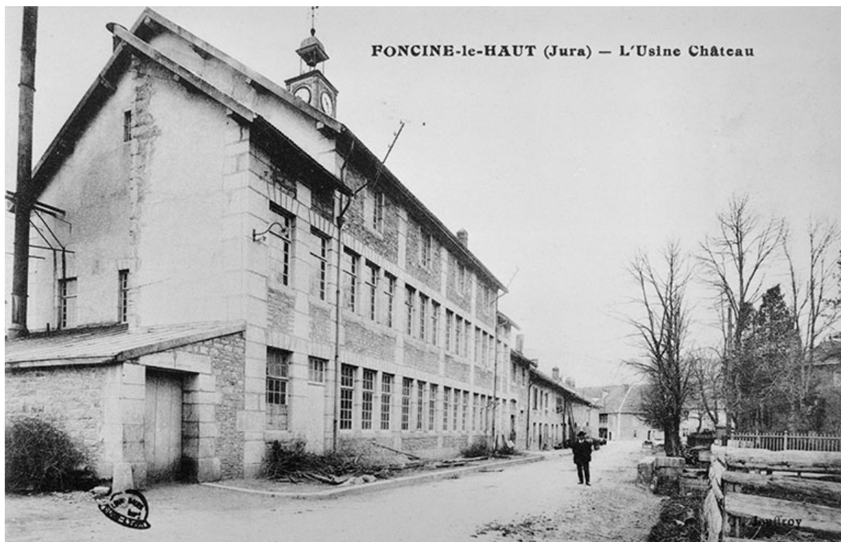
Foncine-le-Haut (Jura) - L'Usine Château.

Carte postale, s.d. [1er quart 20e siècle, entre 1903 et 1919]. , par Jouffroy (? , photographe). Lieu de conservation : collection particulière