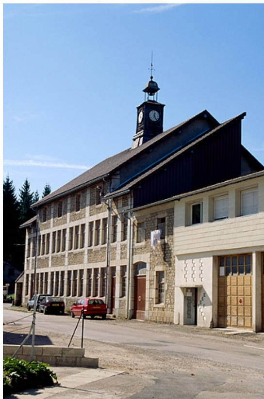
Façade antérieure de l'atelier de fabrication.