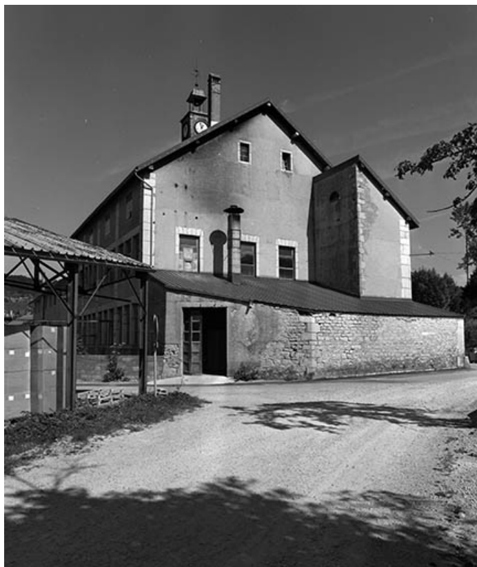
L'atelier de fabrication vu de trois quarts arrière.