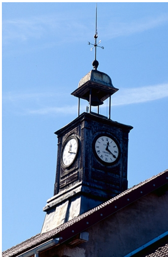
Le clocheton. Les horloges ont été fabriquées par l'usine. 39, Fonceine-le-Haut rue du Village