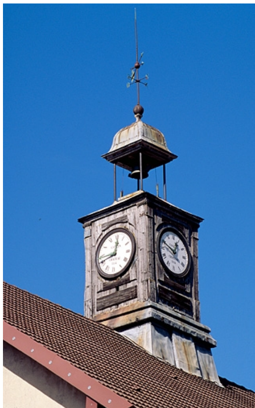
Le clocheton depuis le sud.