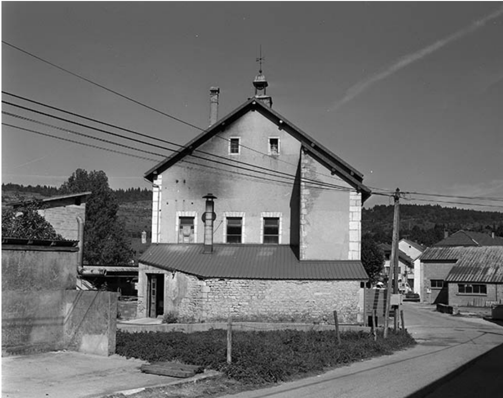
Façade sud. L'appentis, adossé à cette façade, abritait autrefois la machine à vapeur.