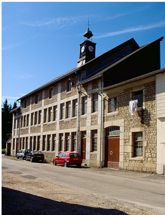
Façade de l'atelier de fabrication de trois quarts droit.