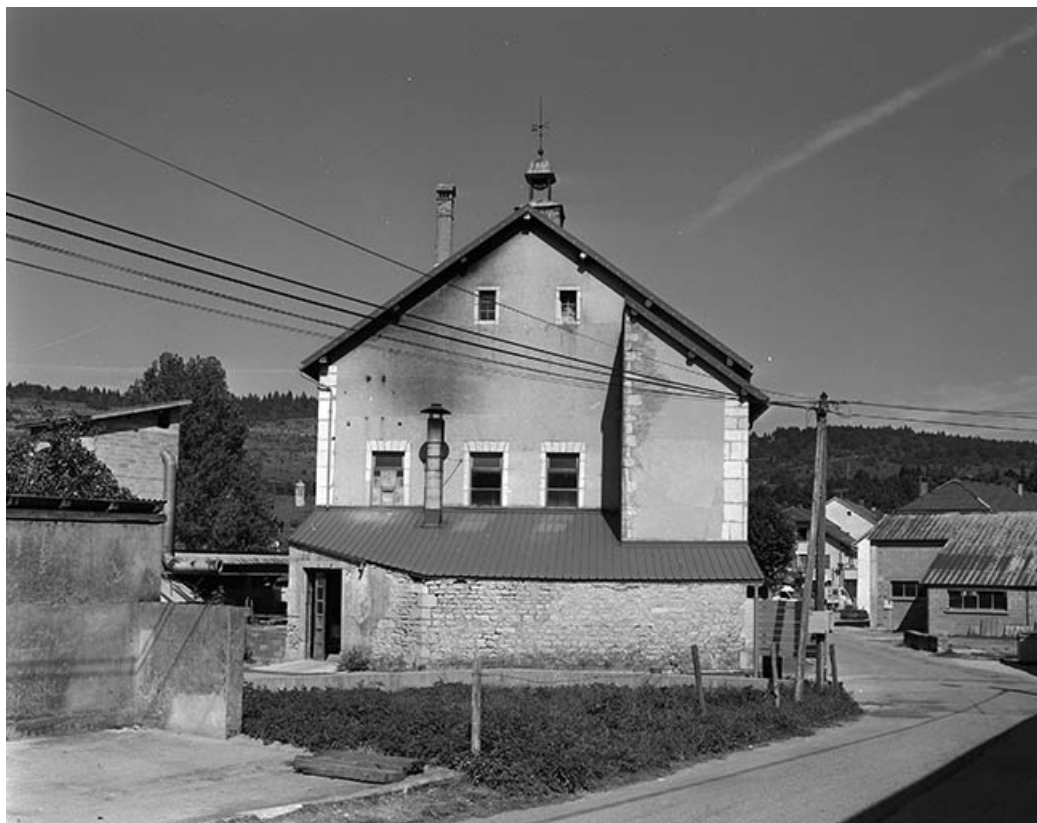
Façade sud. L'appentis, adossé à cette façade, abritait autrefois la machine à vapeur. 39, Fonceine-le-Haut rue du Village