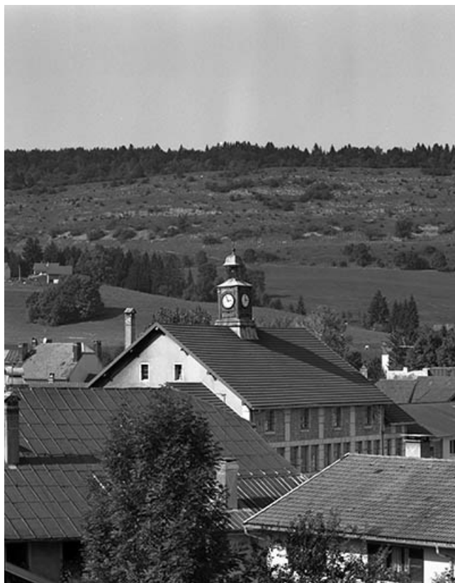
La toiture de l'usine depuis le sud-est.