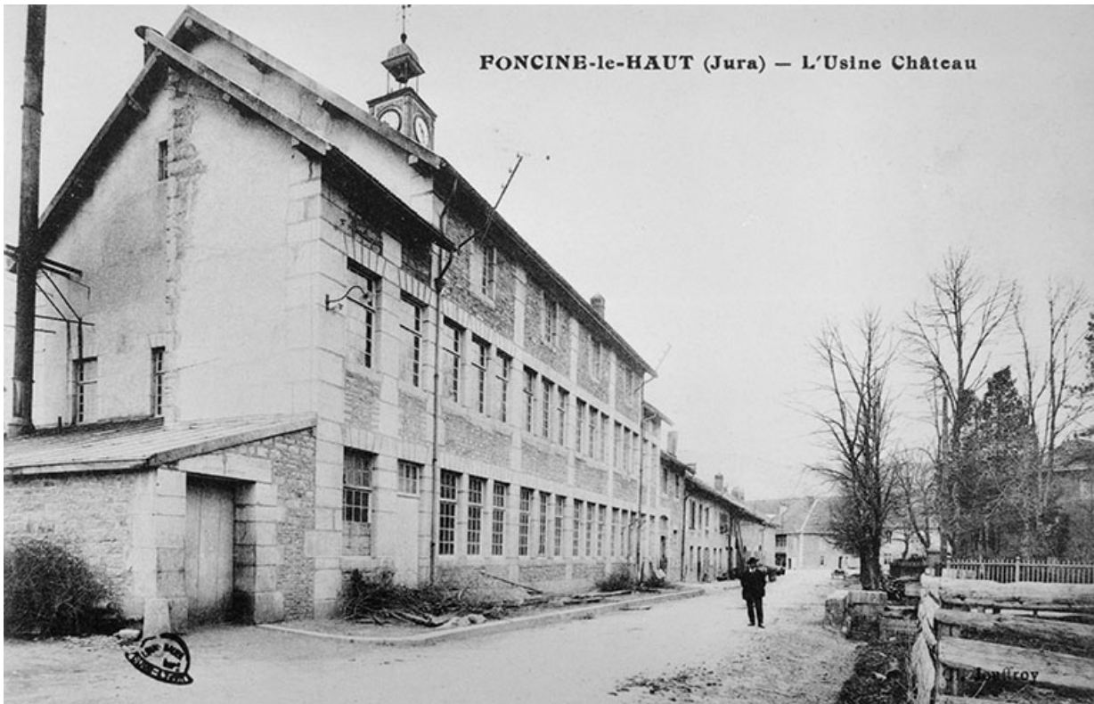
Foncine-le-Haut (Jura) - L'Usine Château.