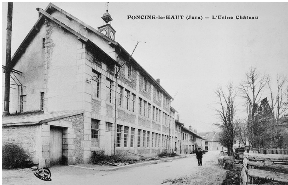
Foncine-le-Haut (Jura) - L'Usine Château.