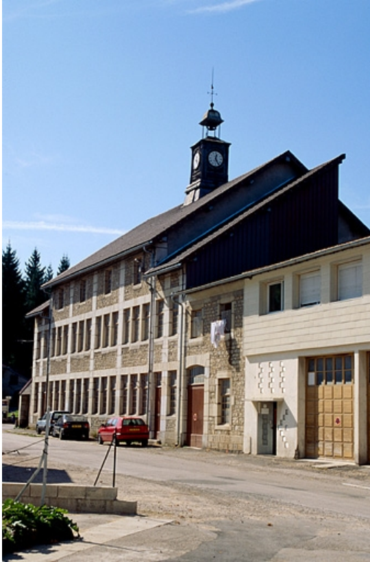
Façade antérieure de l'atelier de fabrication.