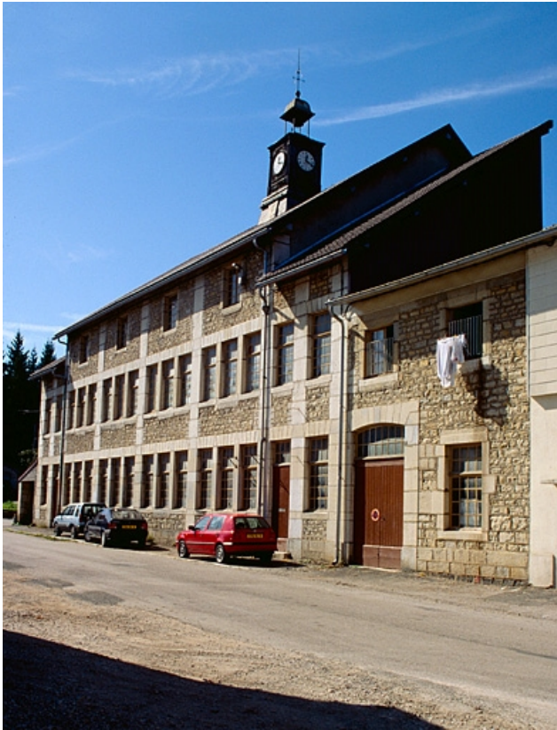
Façade de l'atelier de fabrication de trois quarts droit.