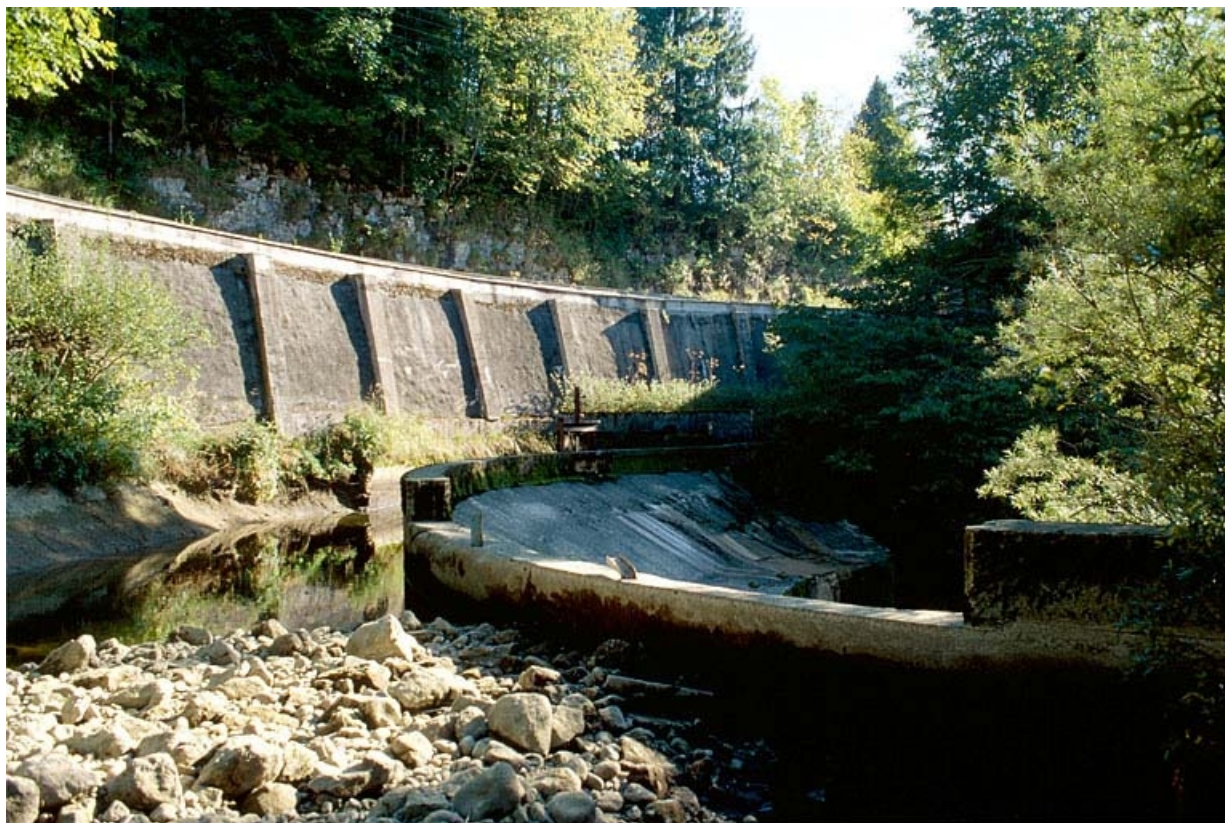
Canal d'amenée et déversoir du barrage.