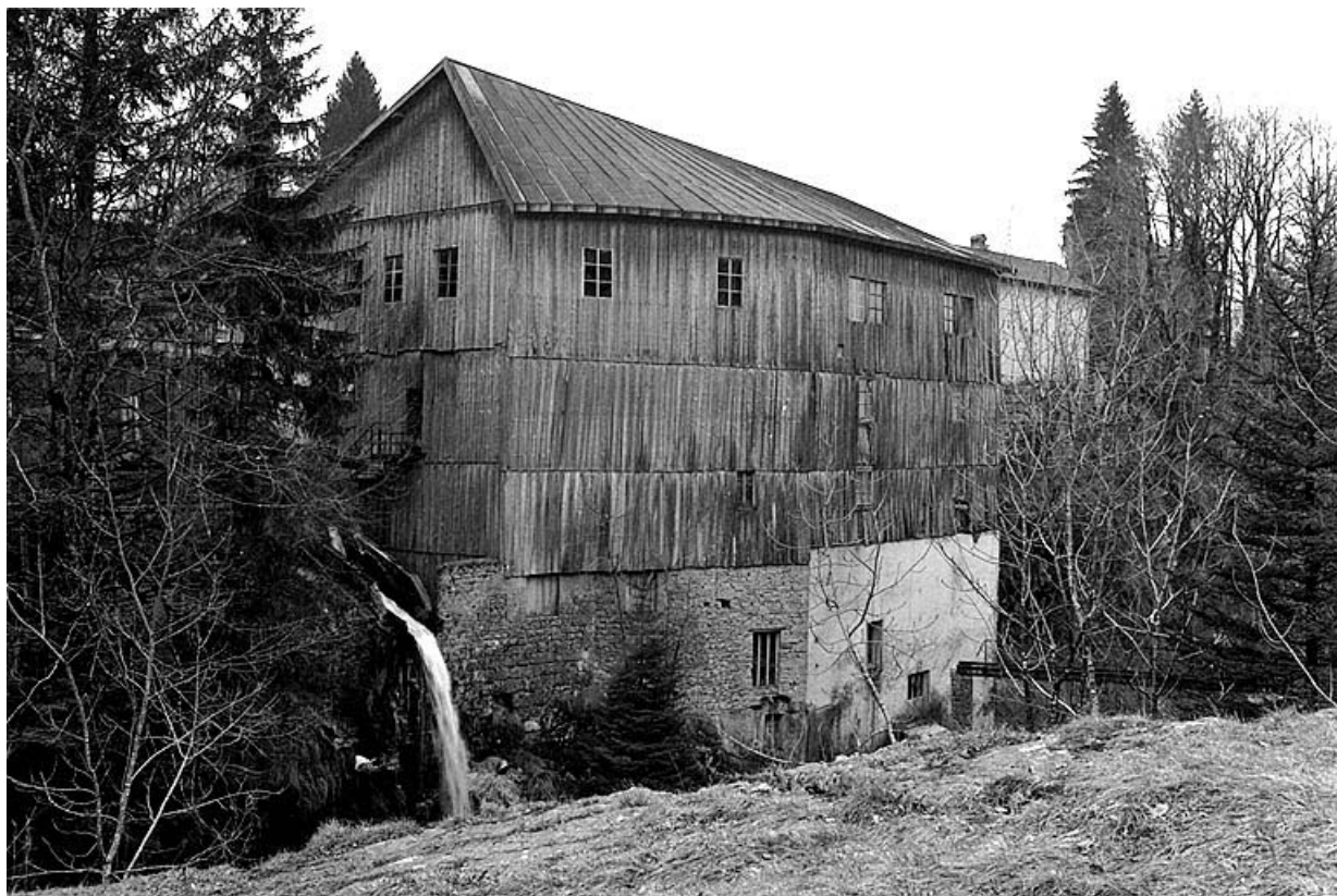
Façade sur rivière de l'atelier de fabrication de scierie.