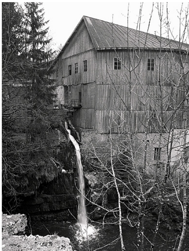
Extrémité est de l'atelier de fabrication.