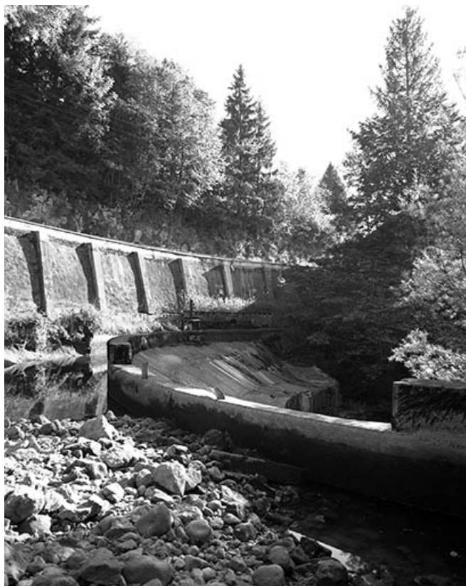
Bassin de retenue (à sec) et barrage.