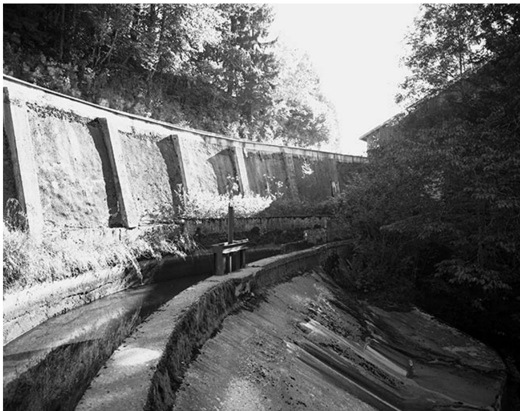
Canal d'amenée et déversoir du barrage.