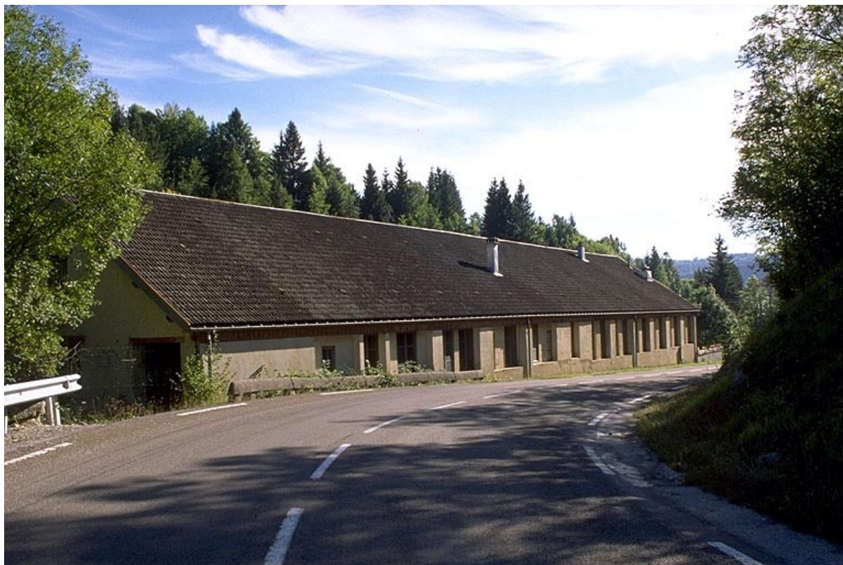
Façade ouest de l'atelier de fabrication.