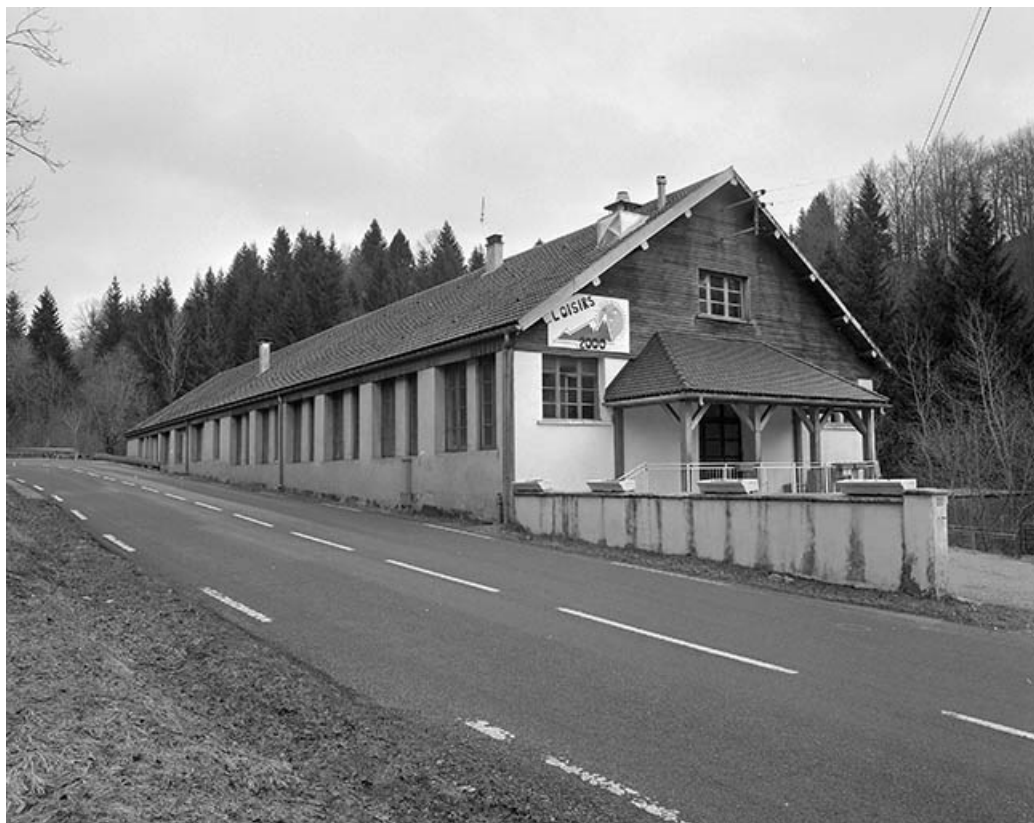
Atelier de fabrication vu de trois quarts.