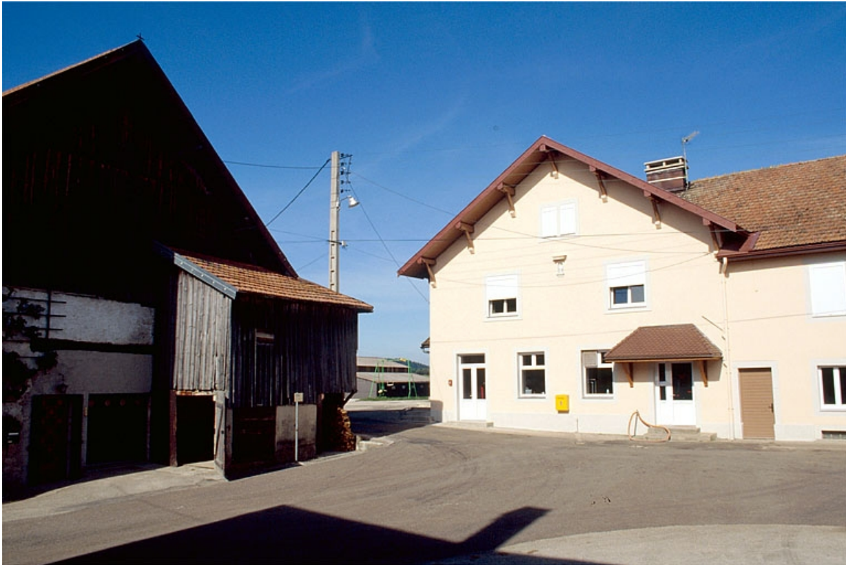
Pignon sud-est de la fromagerie.