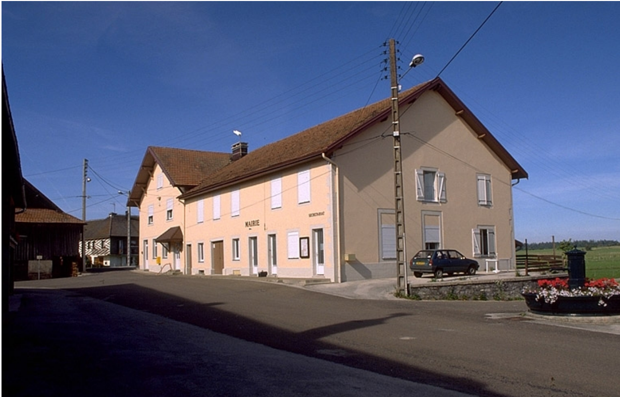
Façade antérieure vue de trois quarts droite.