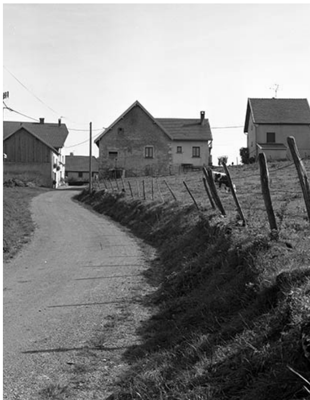
Atelier de fabrication et logement depuis le nord-ouest.