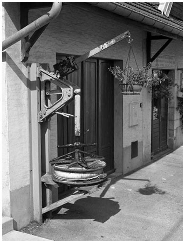
Ancienne presse murale exposée contre la façade antérieure.