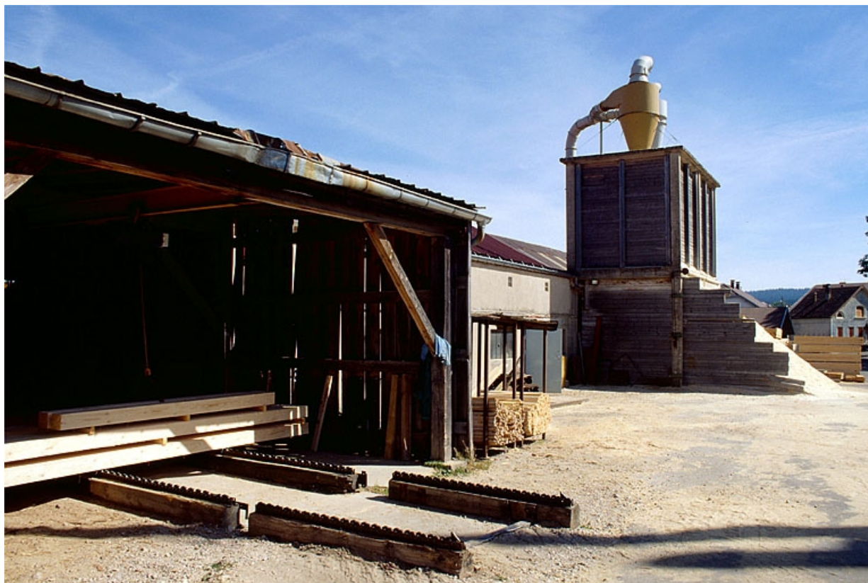
Atelier de fabrication (sciage) et silo à sciure. 39, Mignovillard rue de l' Usine