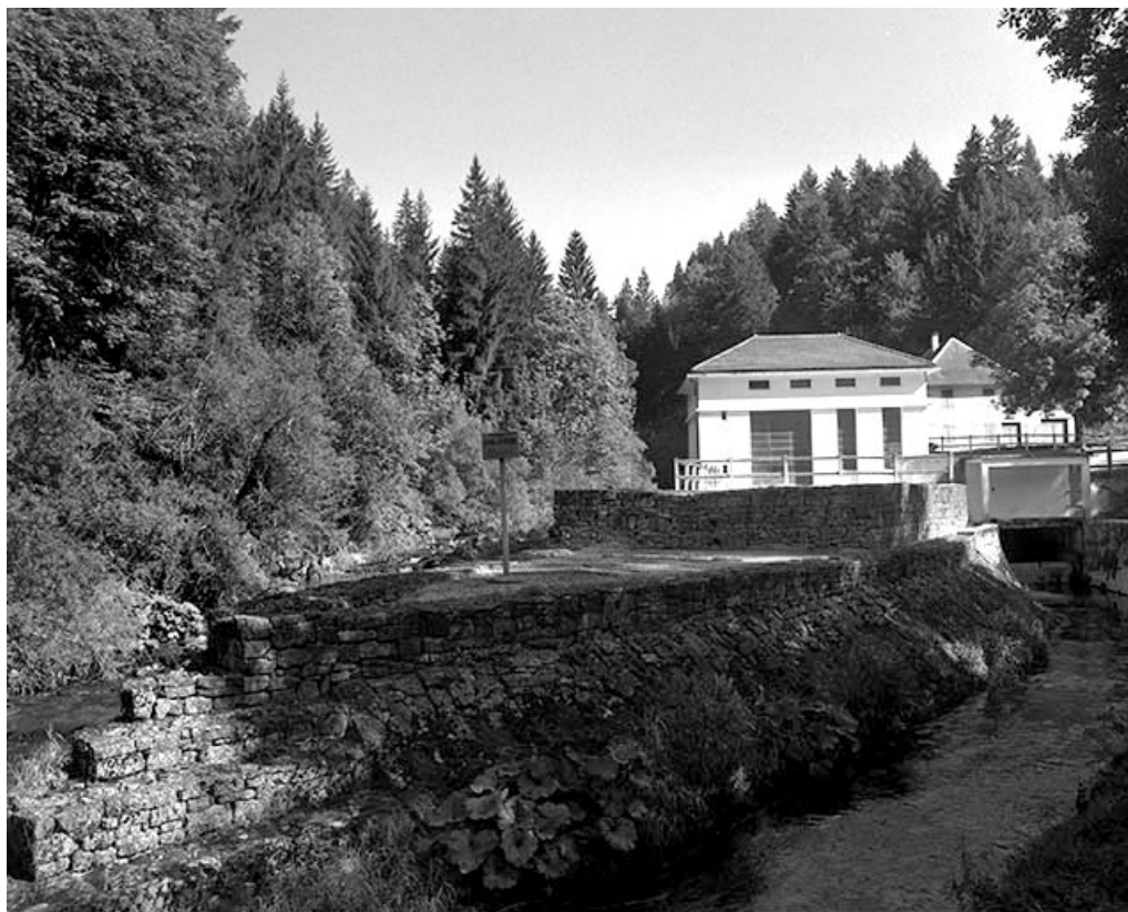
La centrale hydroélectrique depuis le canal de fuite.