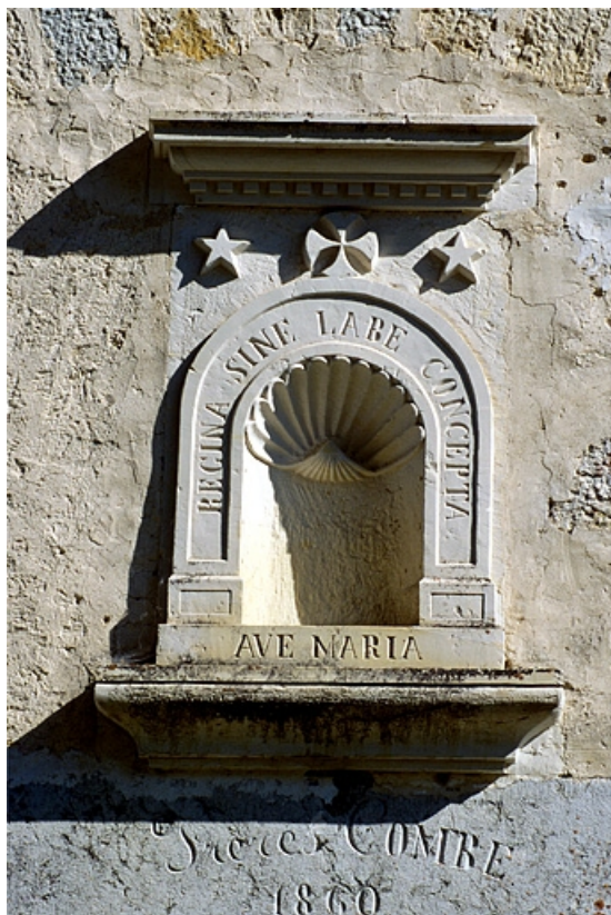
Façade du logement. Niche surmontant le linteau de la porte d'entrée. 39, Nozeroy, lieudit : Bellefontaine