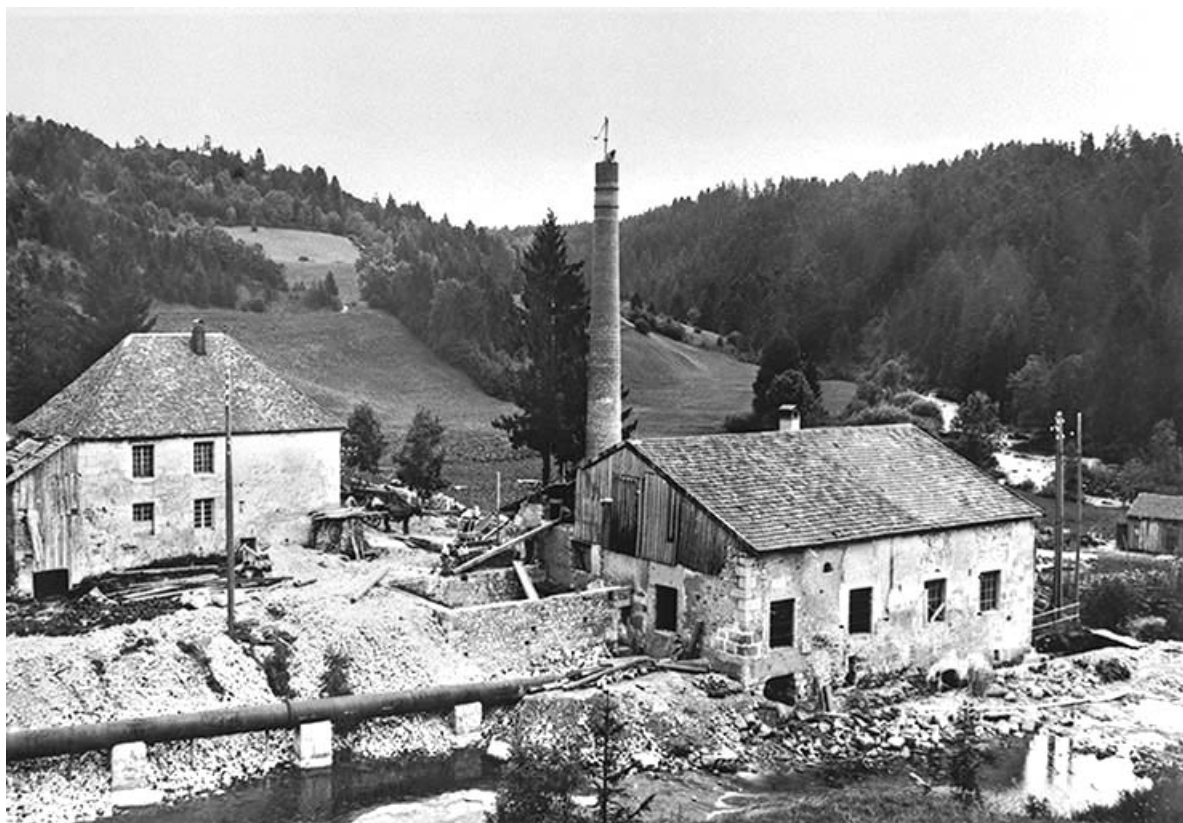
La centrale hydroélectrique de Bellefontaine.