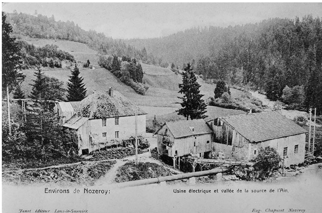
Environs de Nozeroy : Usine électrique et vallée de la source de l'Ain.