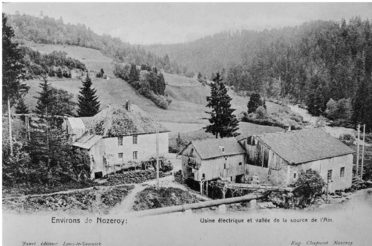
Environs de Nozeroy : Usine électrique et vallée de la source de l'Ain.