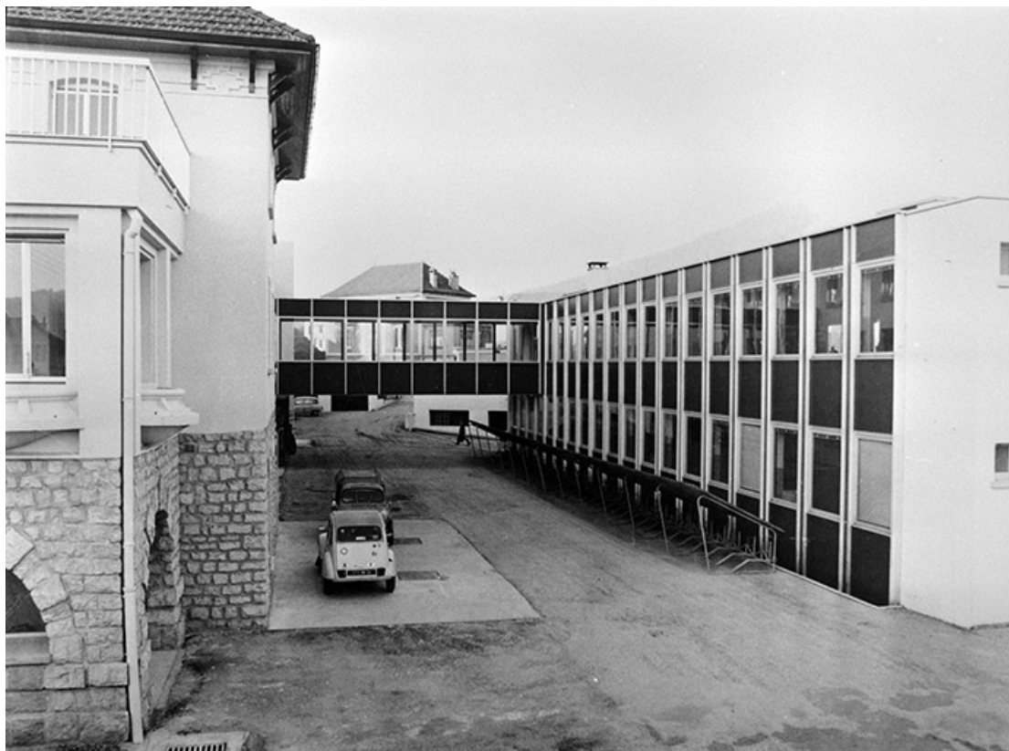
Ancien et nouvel atelier de fabrication reliés par une passerelle.