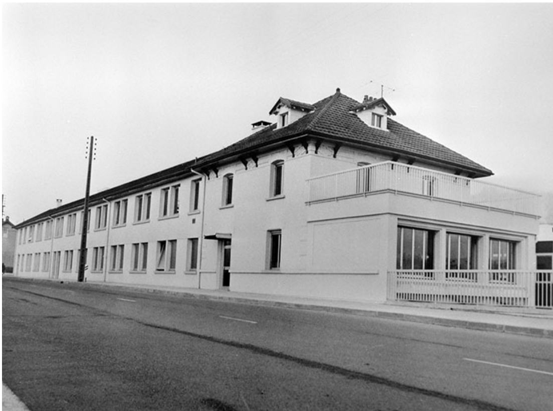
Atelier de fabrication et bureau depuis le sud-ouest.