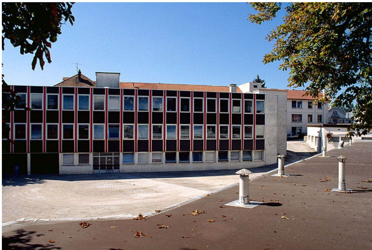
Façade sur cour d'un atelier de fabrication.