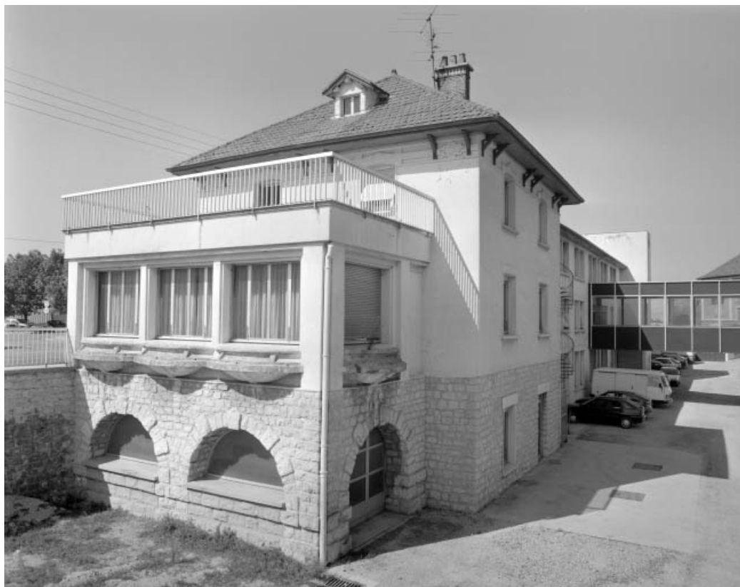
Bureau et façade postérieure de l'atelier de fabrication.