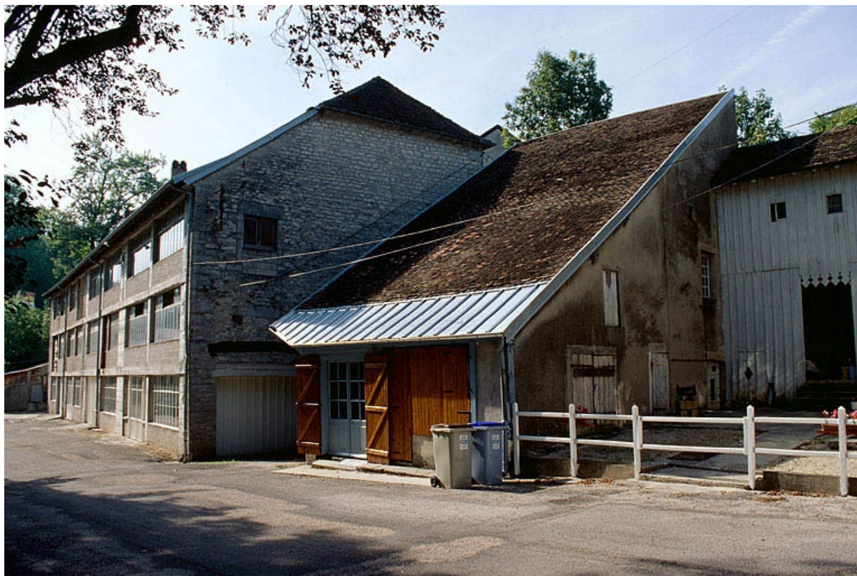
Atelier de fabrication, magasin industriel et bureau.