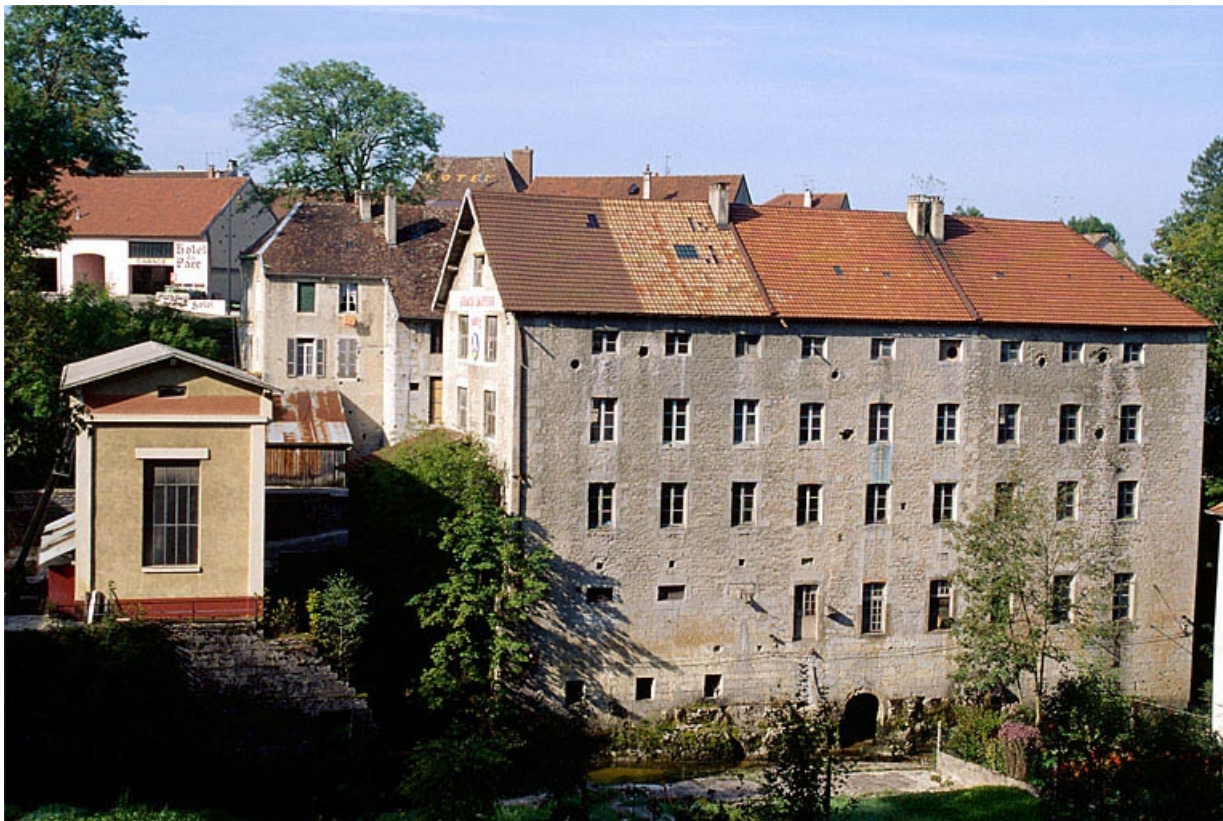
Vue d'ensemble depuis l'est.