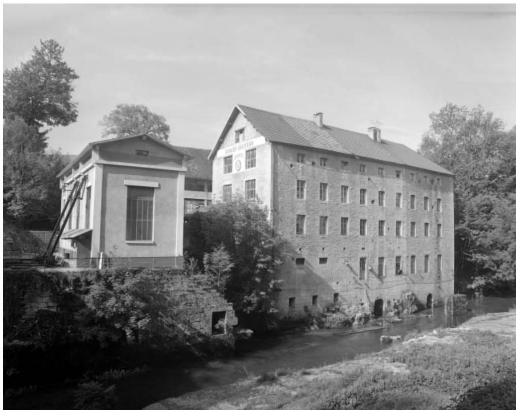
Centrale hydroélectrique et atelier de fabrication depuis la rive droite.