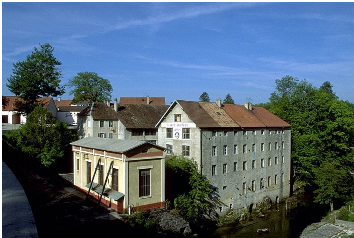
Vue d'ensemble depuis le sud-est.