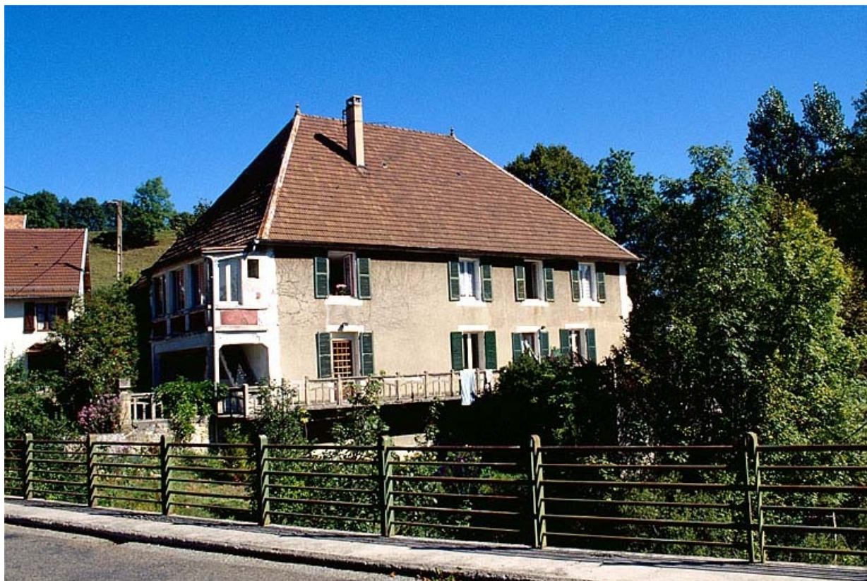
Vue d'ensemble depuis le sud.