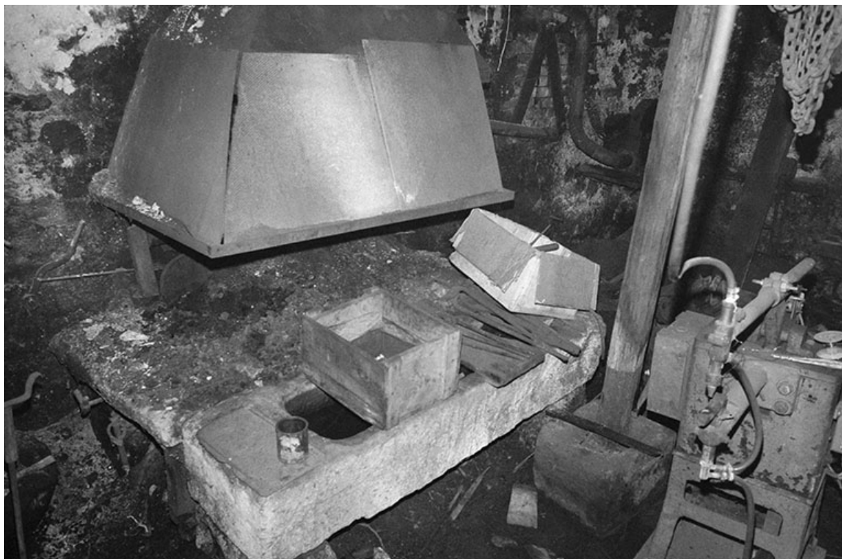
La forge en 1980.