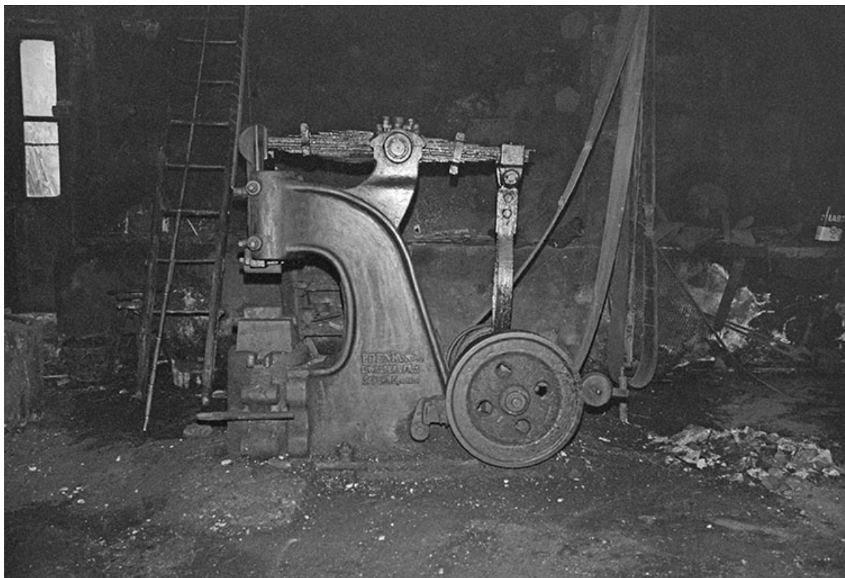
La perceuse, dite perse, en 1980.