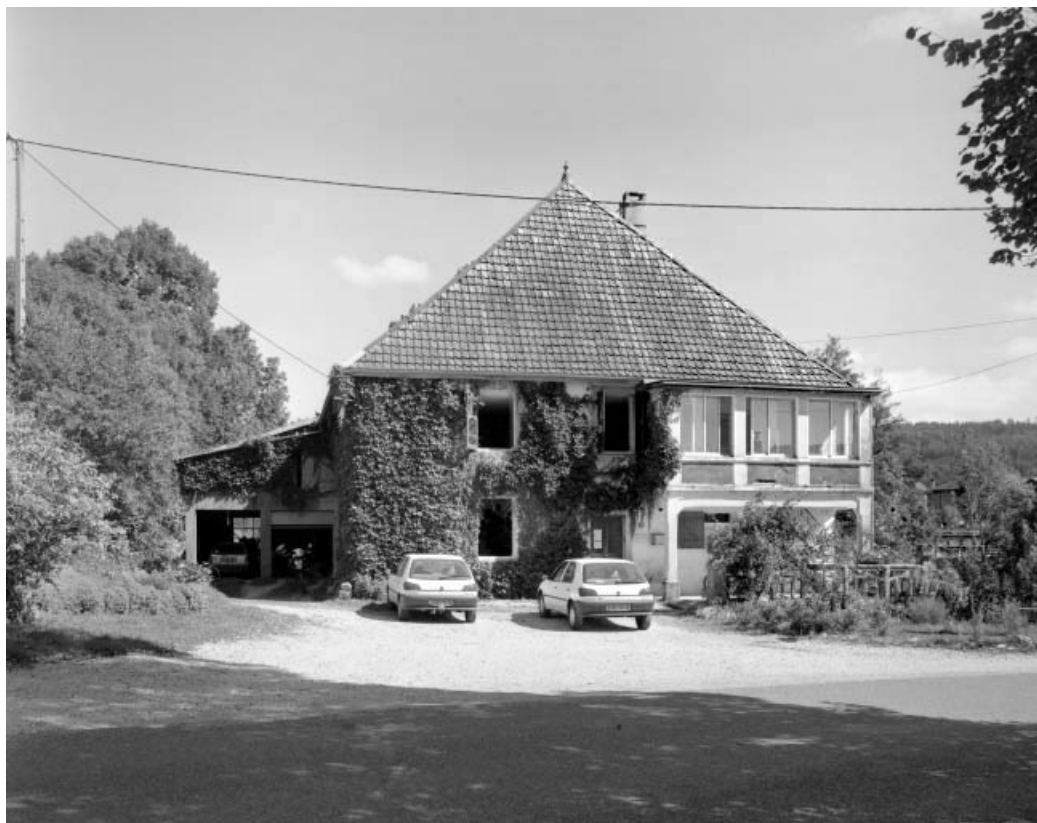
Façade ouest du logement.