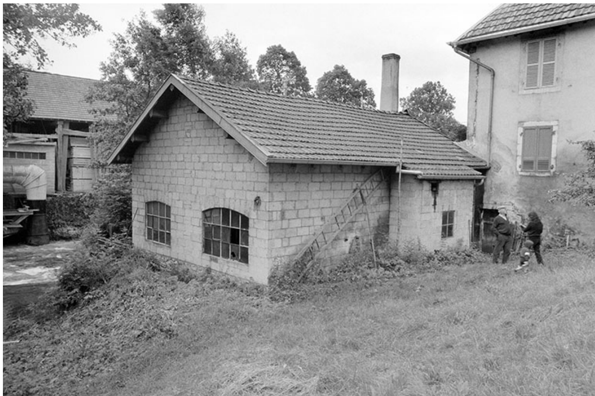
Atelier de la taillanderie en 1980.