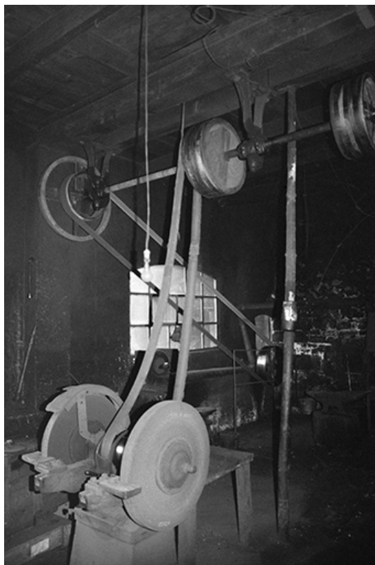
Meules et leur système d'entraînement en 1980. 39, Sirod R.D. 84