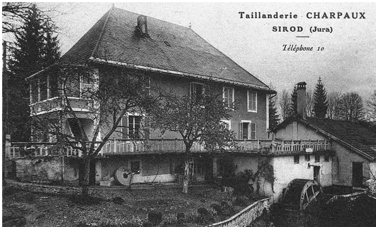
Taillanderie Charpoux - Sirod (Jura), vers 1922-1923. Carte postale, s.d. [vers 1922-1923].