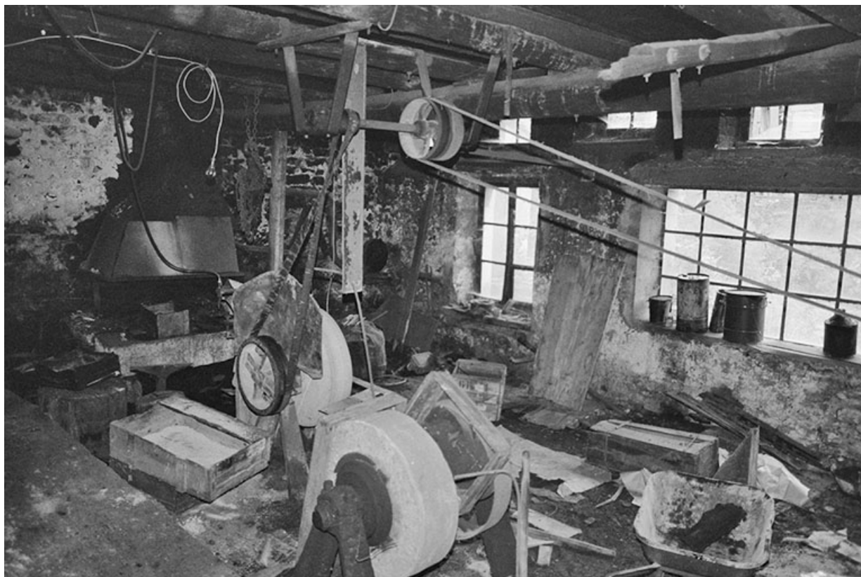
Vue d'ensemble de l'atelier avec la forge, en 1980. 39, Sirod R.D. 84