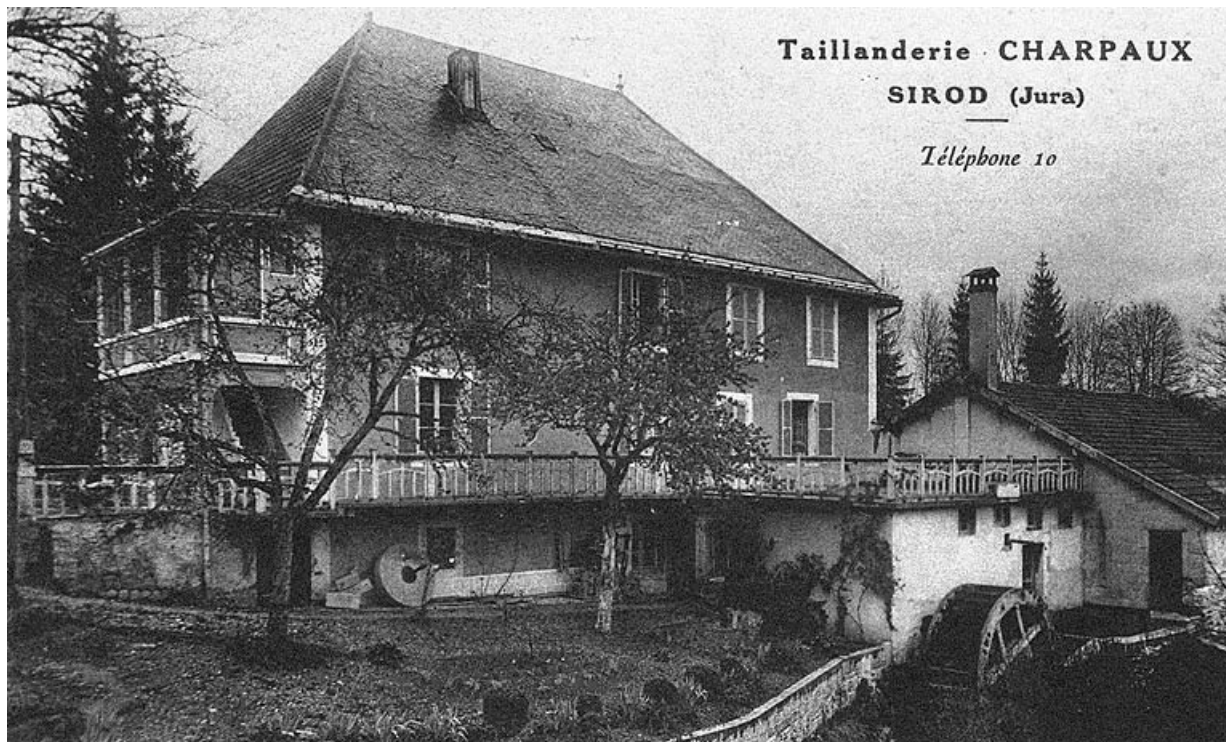
Taillanderie Charpoux - Sirod (Jura), vers 1922-1923. Carte postale, s.d. [vers 1922-1923]. 39, Sirod R.D. 84