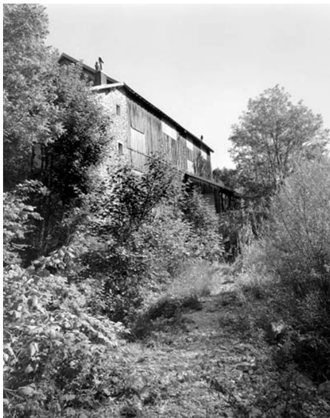
Façade sur l'Ain de l'atelier de fabrication.