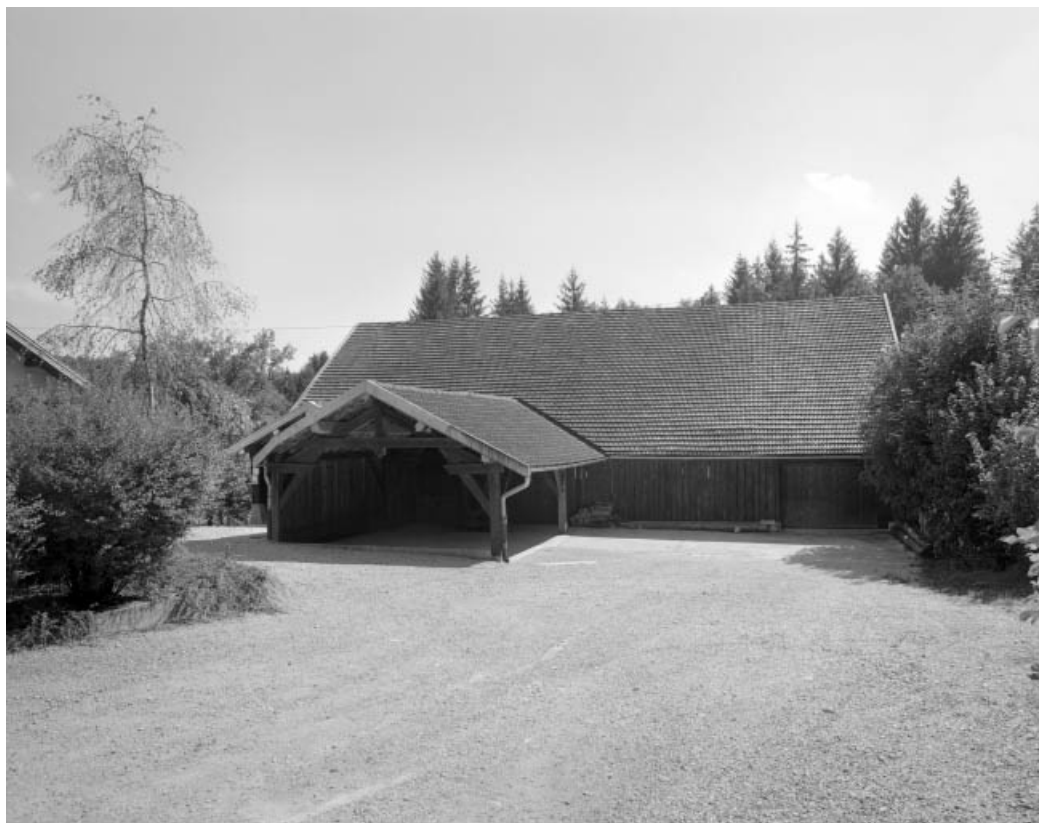
Façade nord de l'atelier de fabrication.