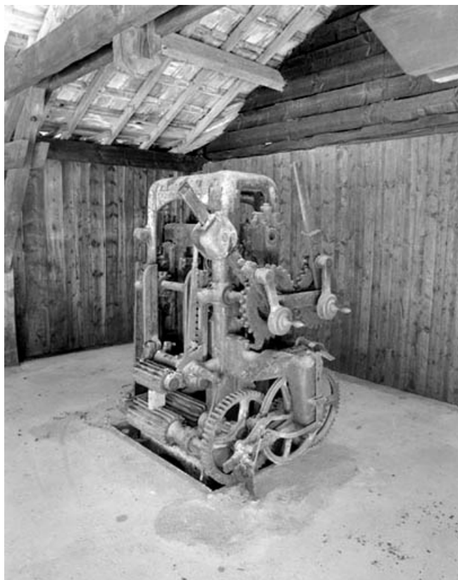
Scie à lames multiples vue de trois quarts.