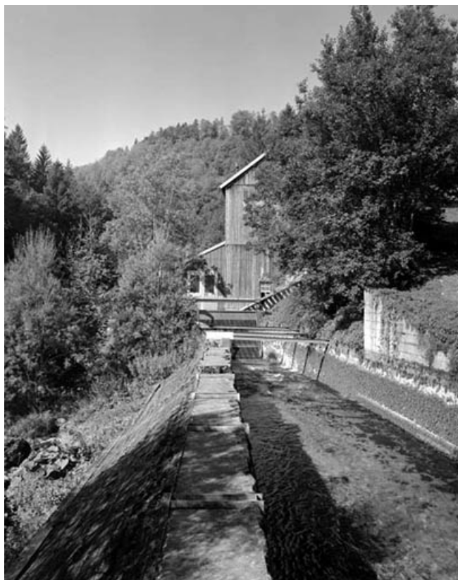
Canal d'amenée de la centrale hydroélectrique.