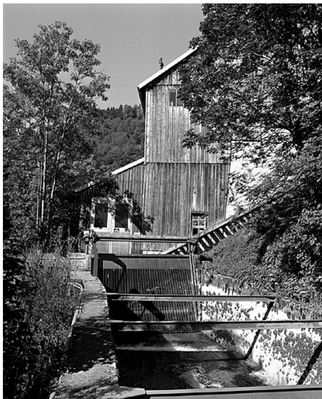
Canal d'amenée et façade est de l'atelier de fabrication.