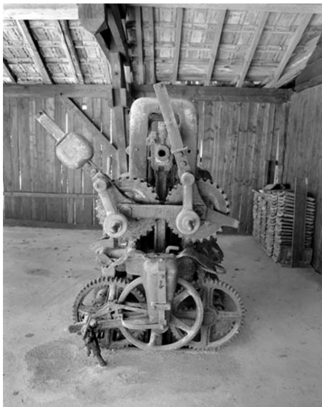
Scie à lames multiples vue de côté.