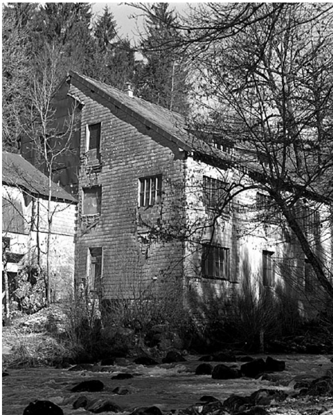
Ancien atelier de fabrication depuis le sud.