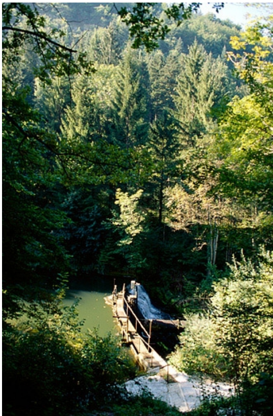
Barrage sur le bief de Balerne et départ de la conduite forcée.