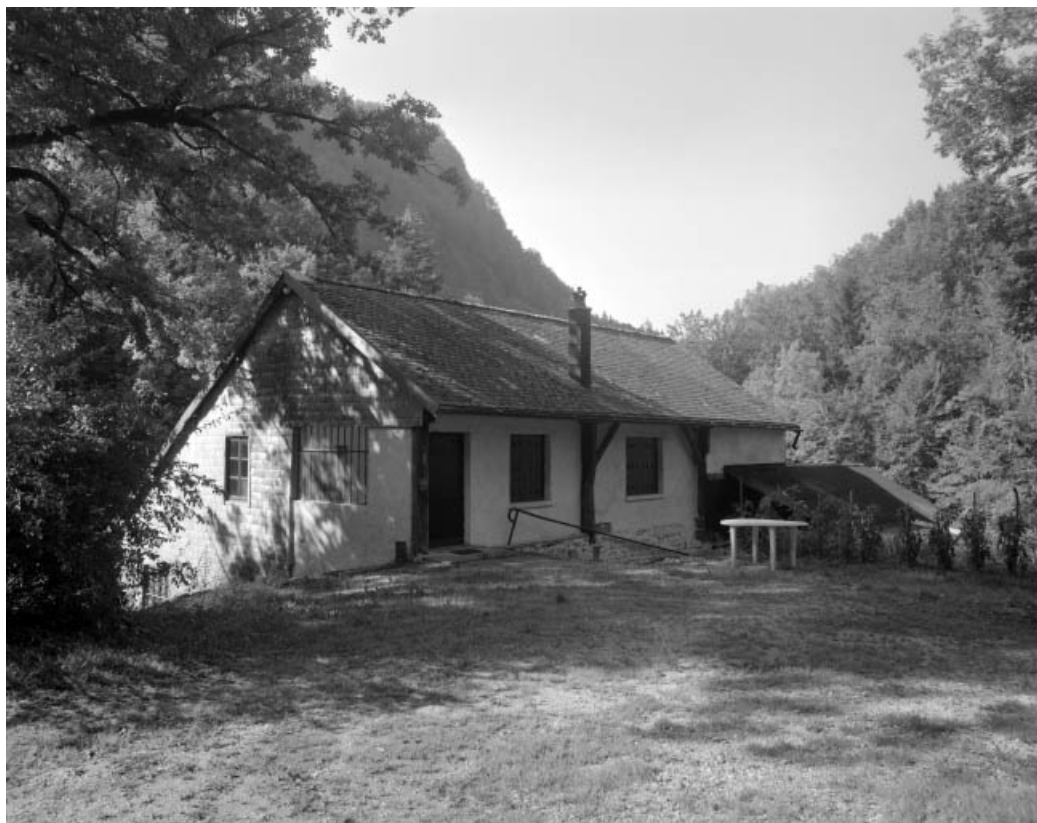
Atelier de fabrication vu de trois quarts.