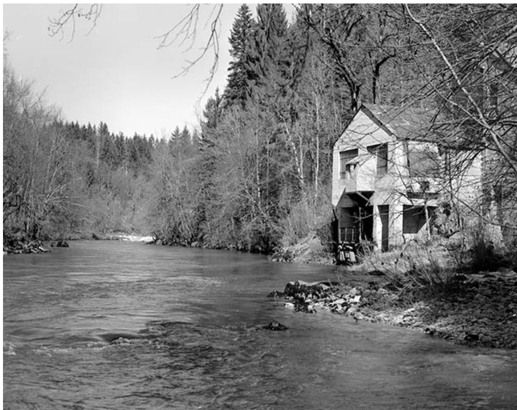
Salle des machines de la centrale, vue de trois quarts.