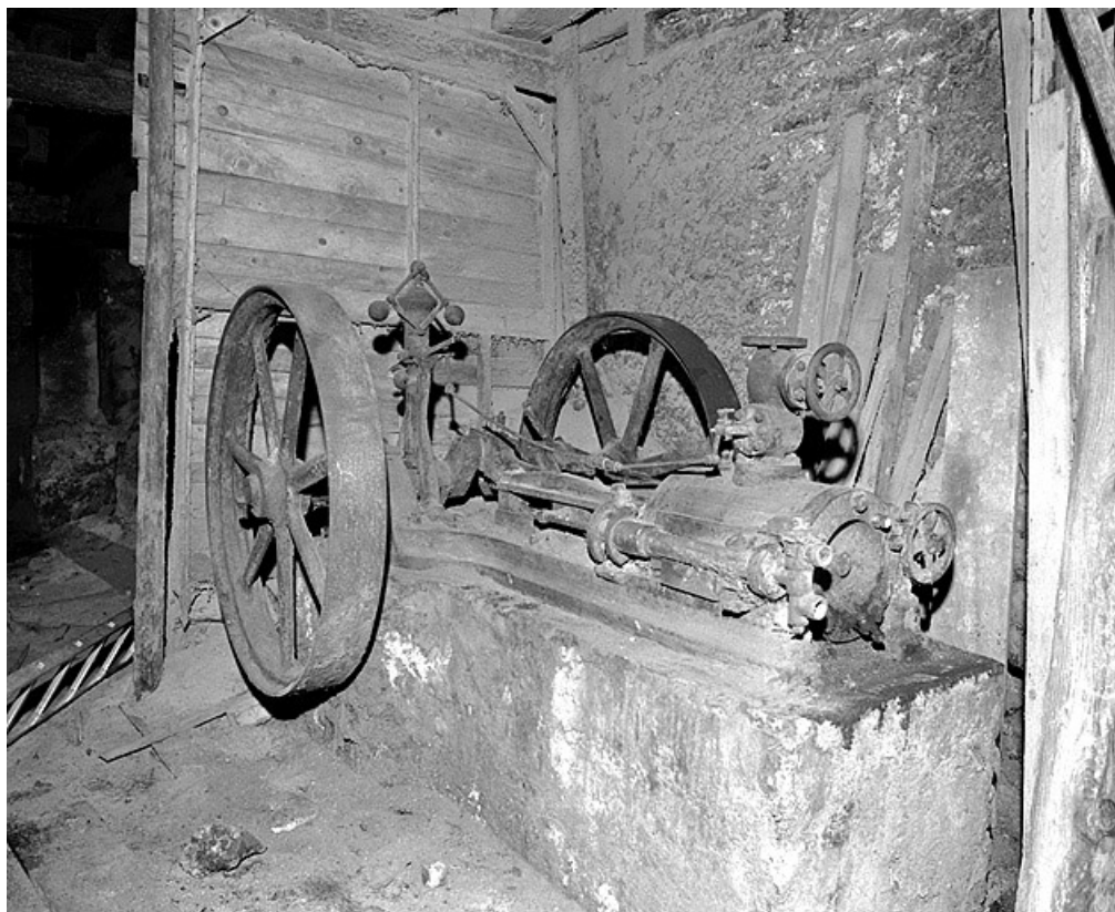
Vue d'ensemble de la machine à vapeur.