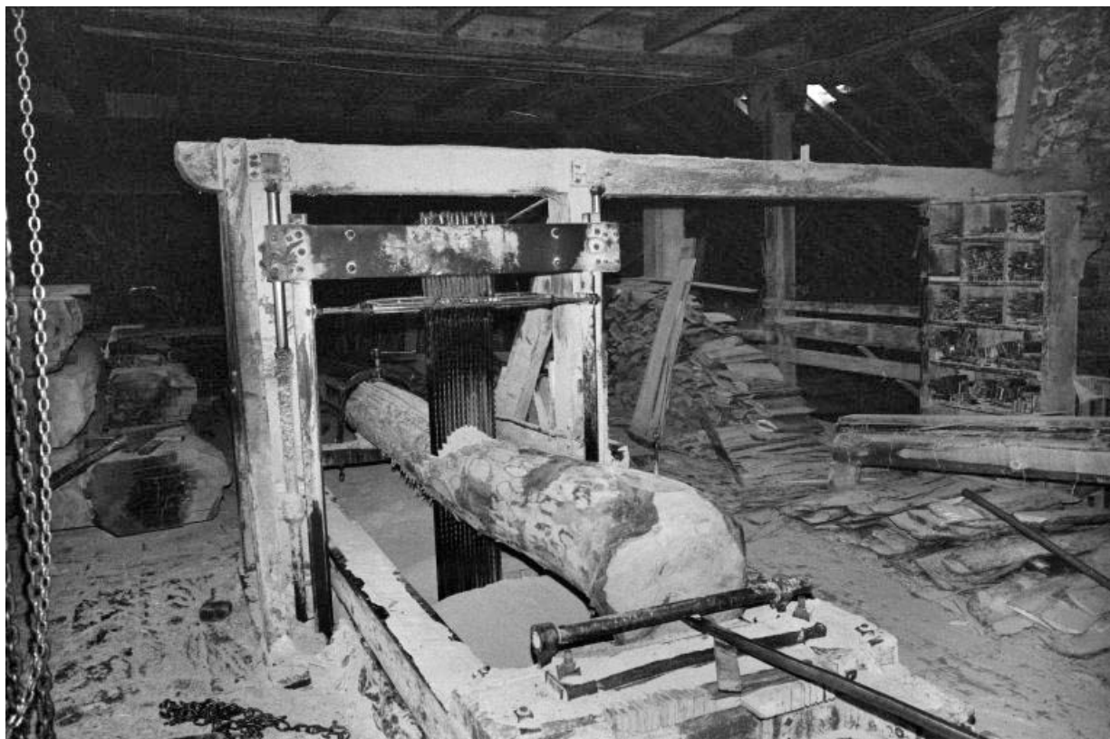
Le châssis de la scie à lames multiples.