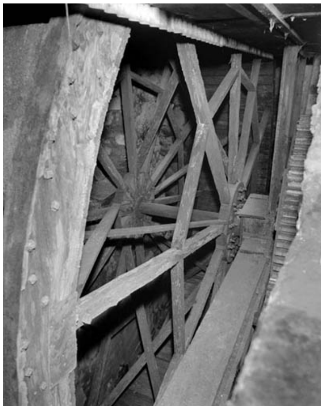
Détail de la charpente de la roue hydraulique.