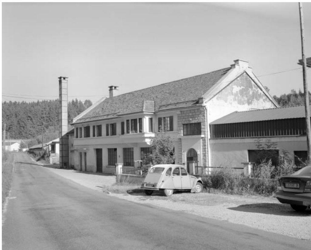
Bâtiment renfermant la chaufferie, un séchoir et les bureaux.