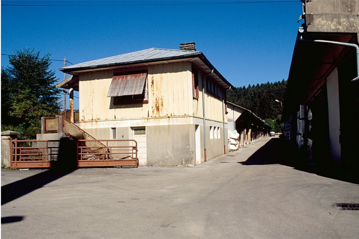
Conciergerie (maison métallique Fillod).