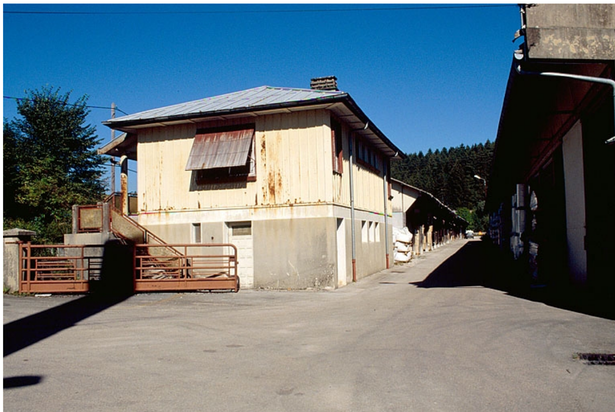
Conciergerie (maison métallique Fillod). 39, Ardon R.D. 27