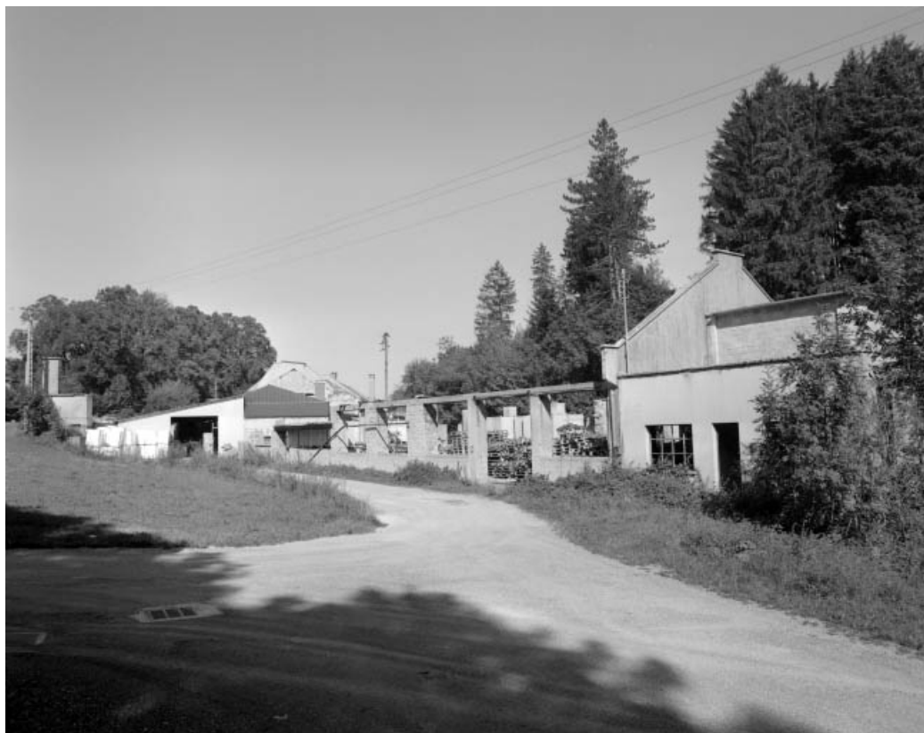
Au premier plan : vestiges de l'atelier de scierie.