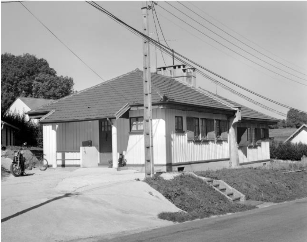
Logement double (maison Fillod).