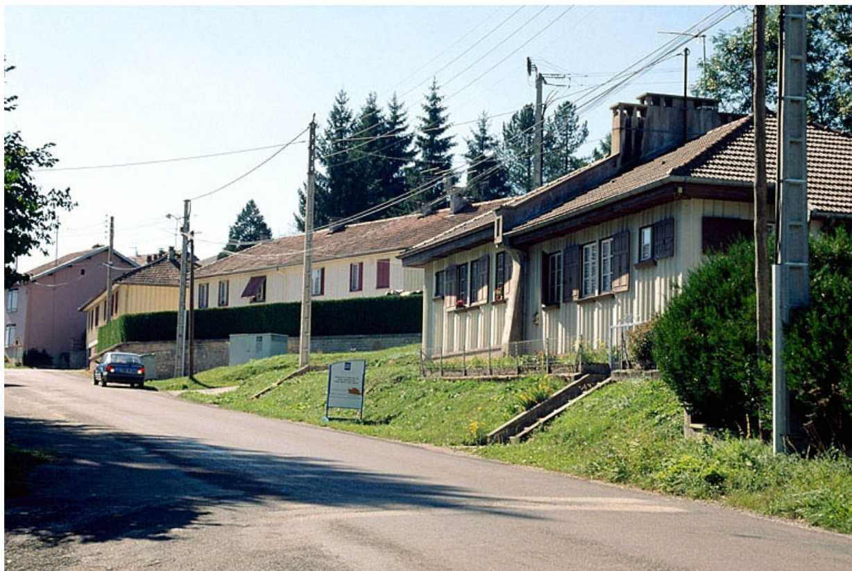
Vue d'ensemble des logements depuis l'est.