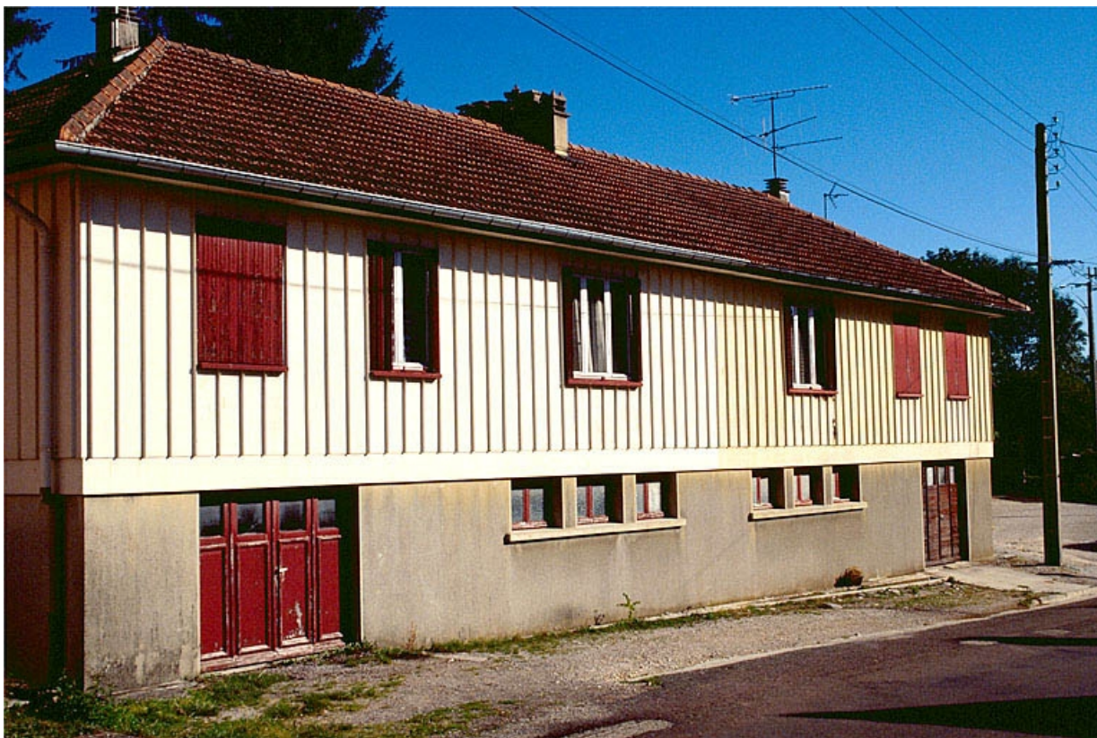
Logement double à étage (maison Fillod). 39, Ardon R.D. 27