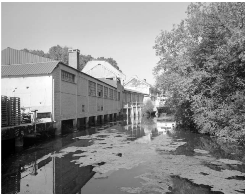
Façades des ateliers de fabrication sur l'Angillon.