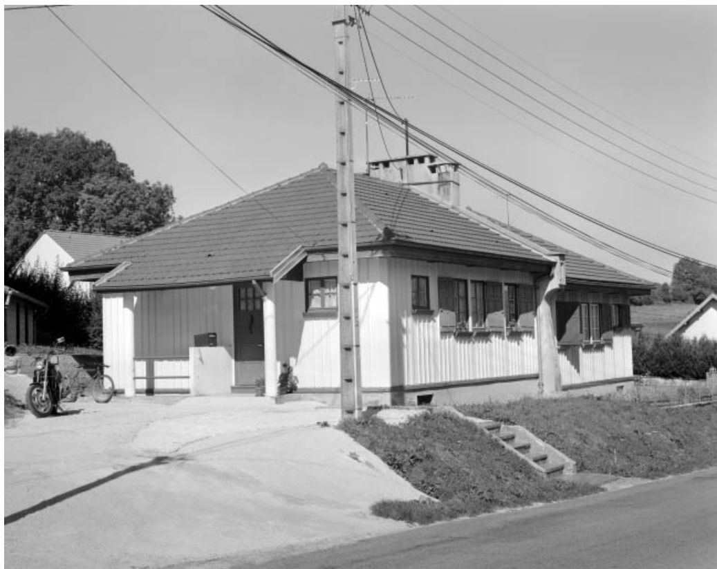
Logement double (maison Fillod).