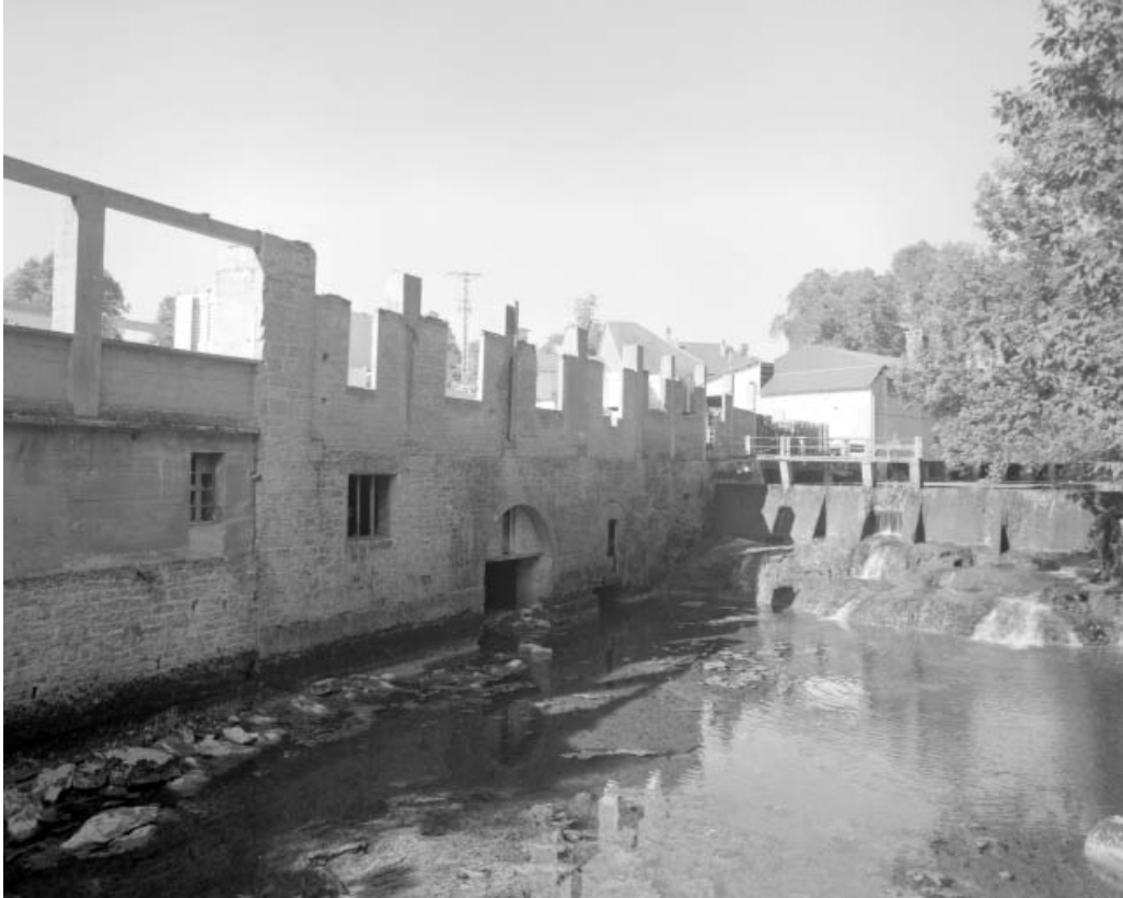
Vue depuis la rive gauche d'aval : vestiges de la scierie et barrage.