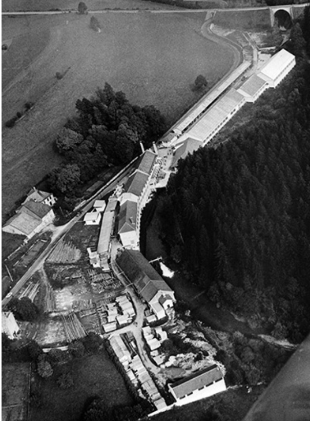
Vue aérienne depuis le sud-ouest.