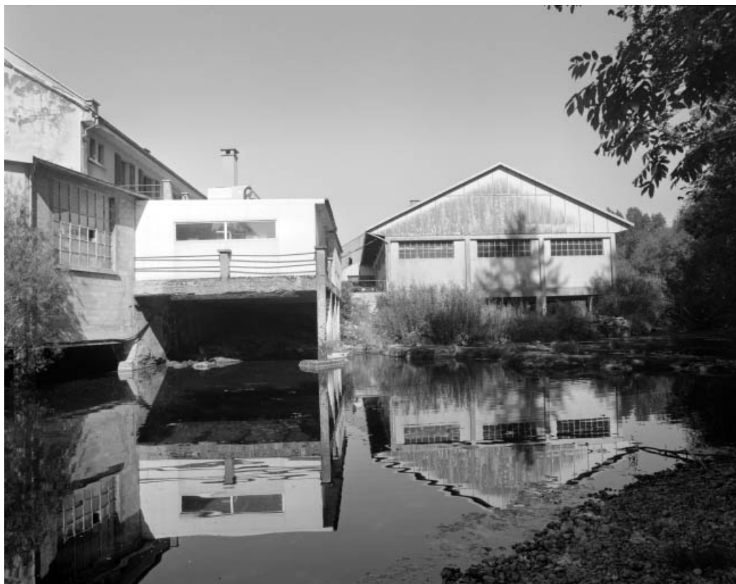
Atelier de fabrication et atelier de réparation depuis la rive gauche. 39, Ardon R.D. 27