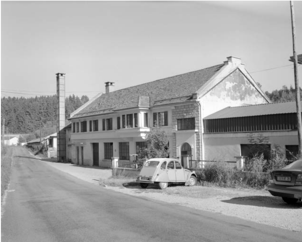
Bâtiment renfermant la chaufferie, un séchoir et les bureaux.