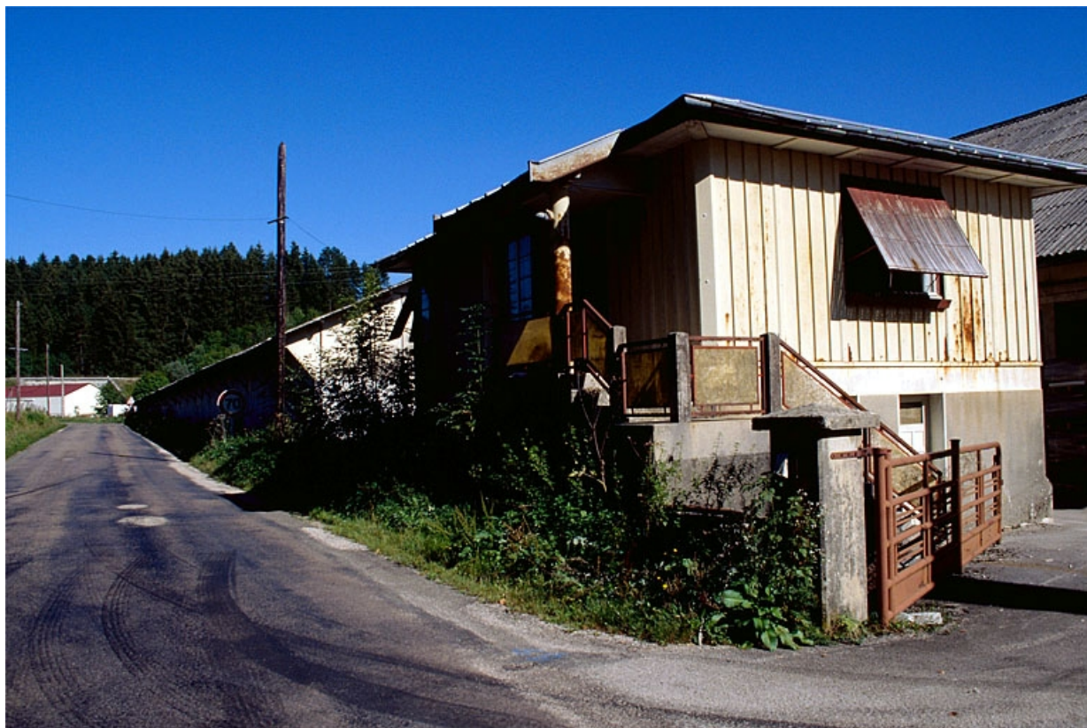
Magasin industriel et conciergerie.