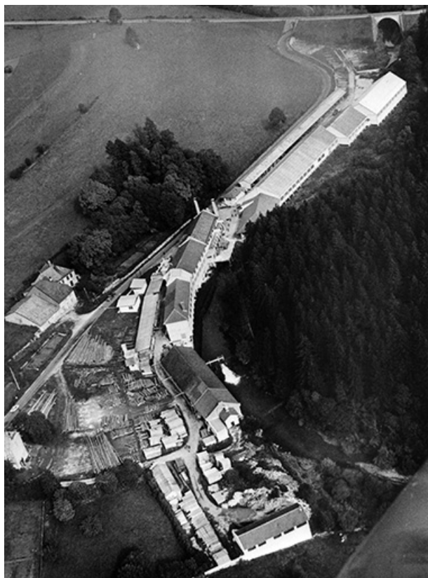
Vue aérienne depuis le sud-ouest.