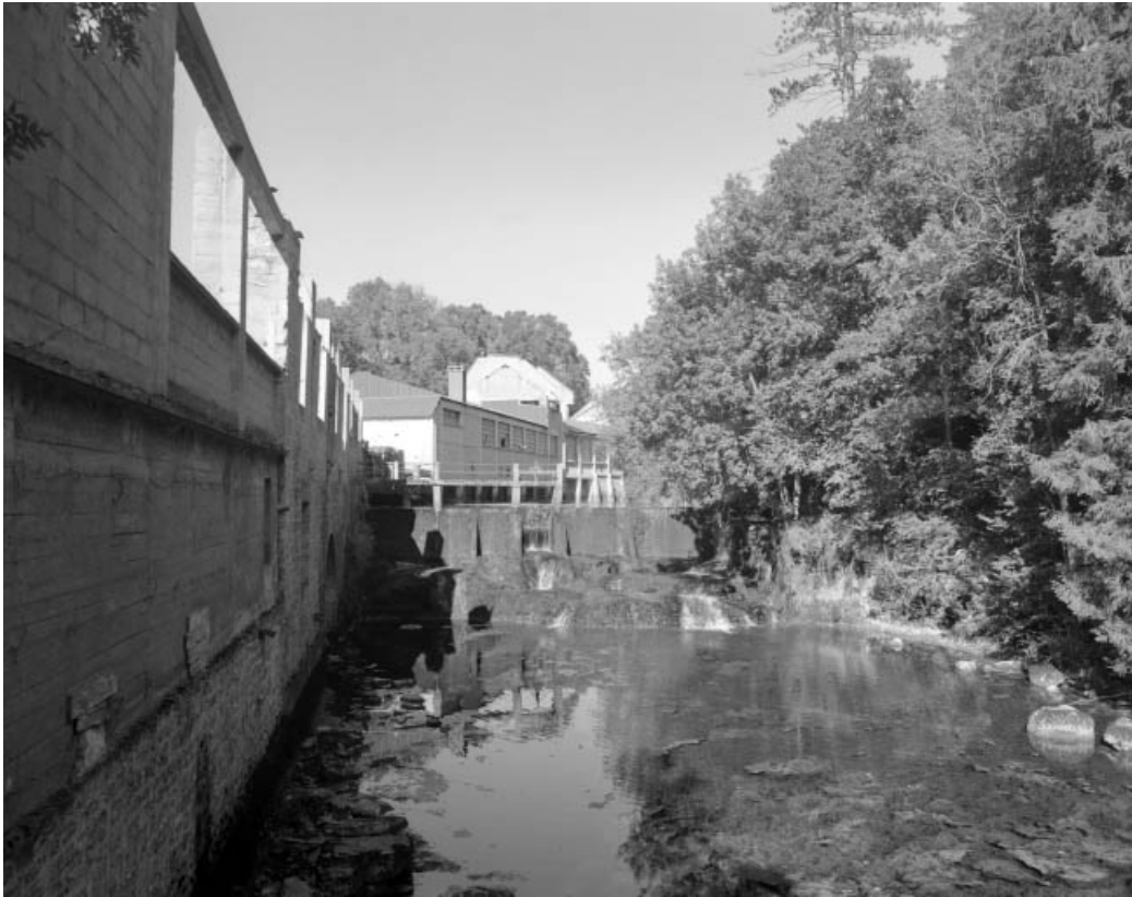
Façades de l'usine sur l'Angillon et barrage.