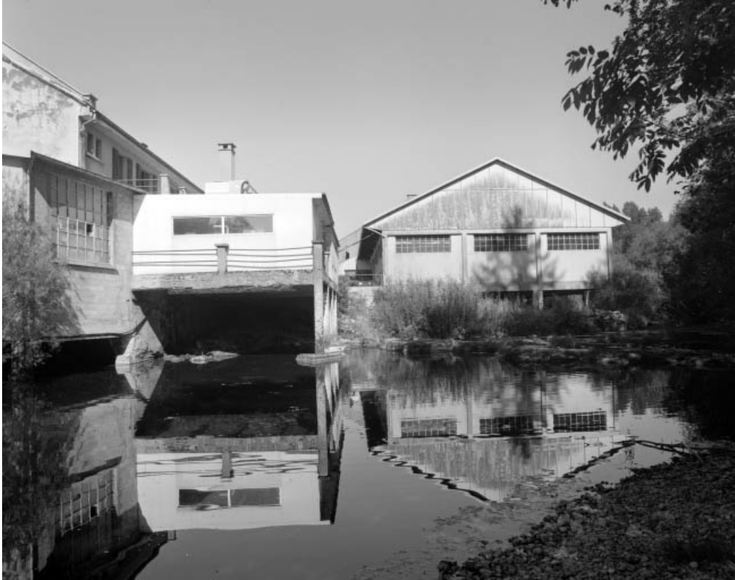
Atelier de fabrication et atelier de réparation depuis la rive gauche.