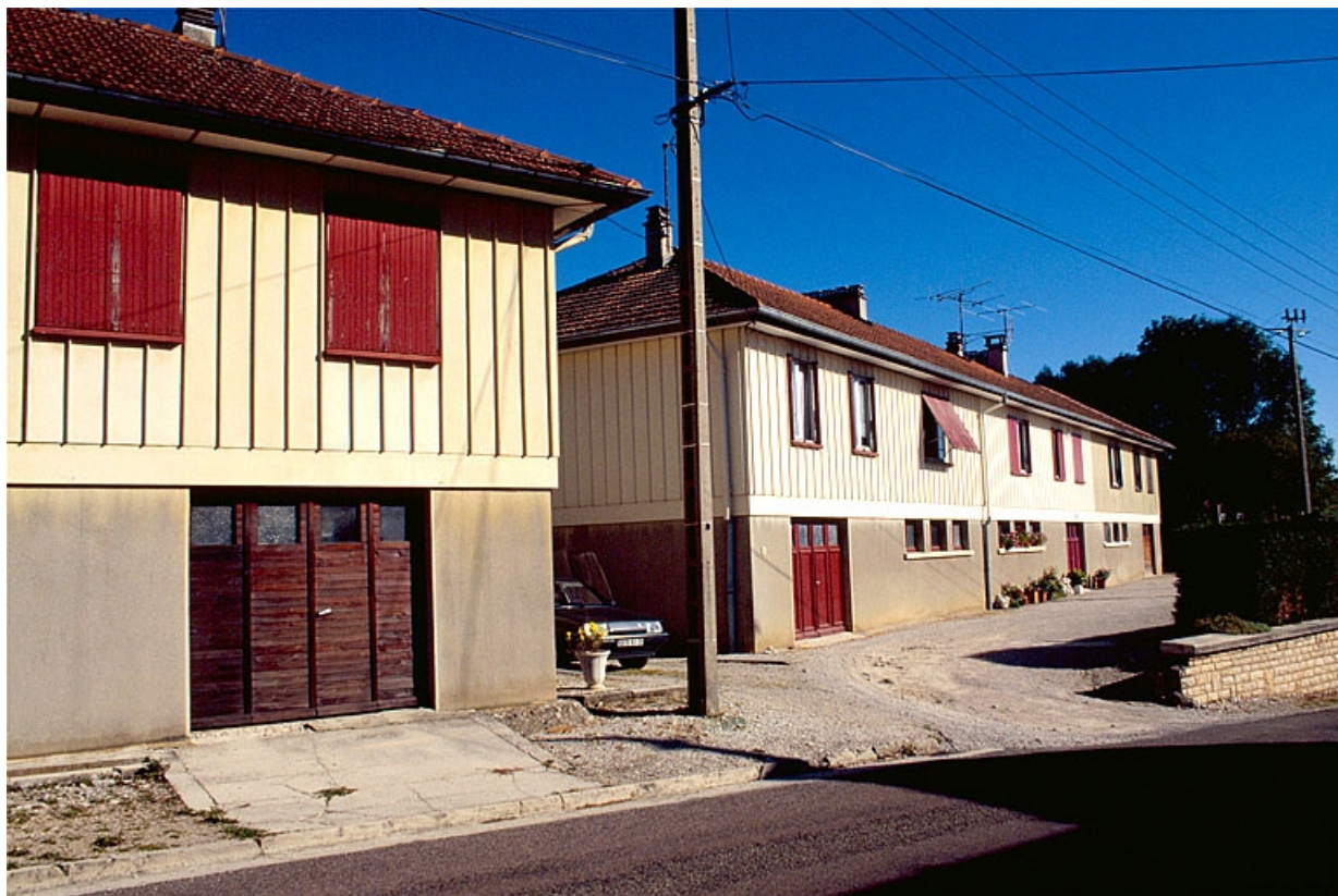
Logement triple (maison Fillod).