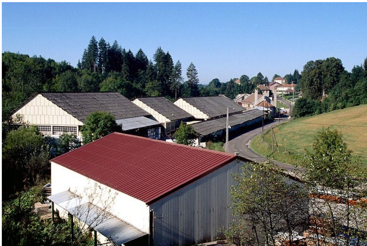
Vue d'ensemble depuis la voie ferrée.