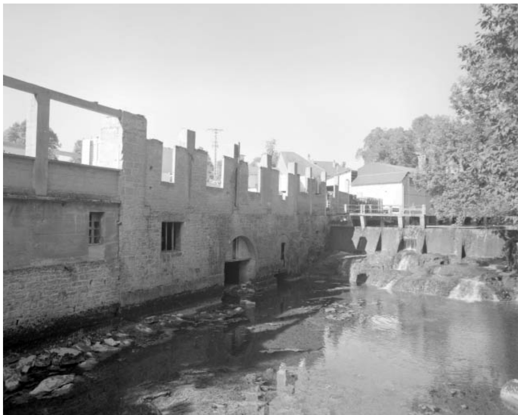
Vue depuis la rive gauche d'aval : vestiges de la scierie et barrage. 39, Ardon R.D. 27