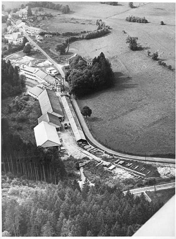
Vue aérienne depuis l'est.