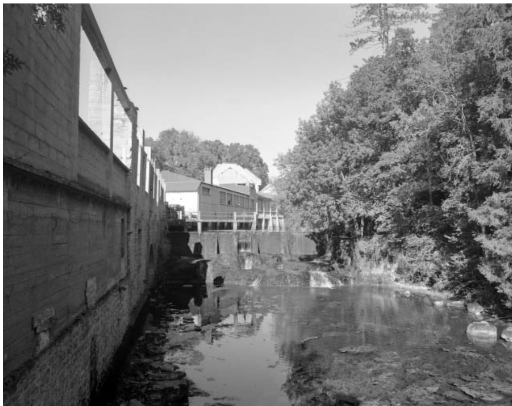
Façades de l'usine sur l'Angillon et barrage.