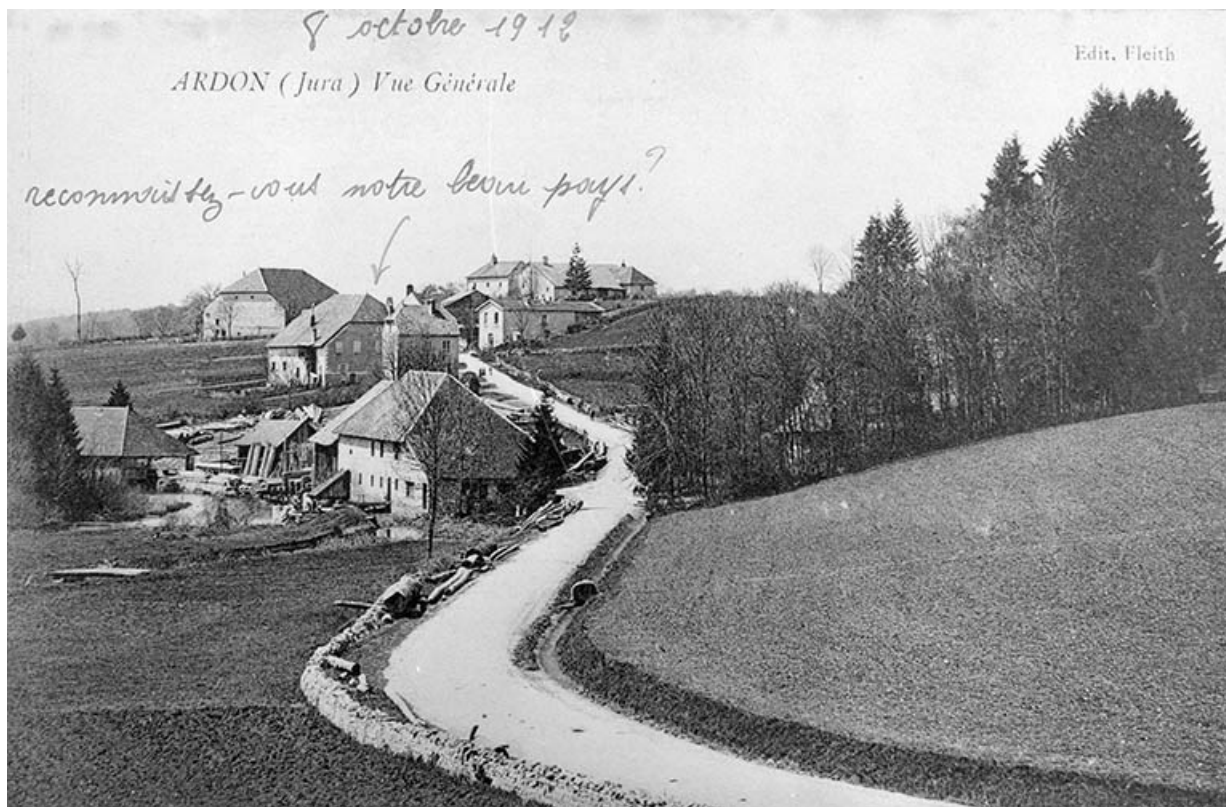
Ardon (Jura). Vue générale.