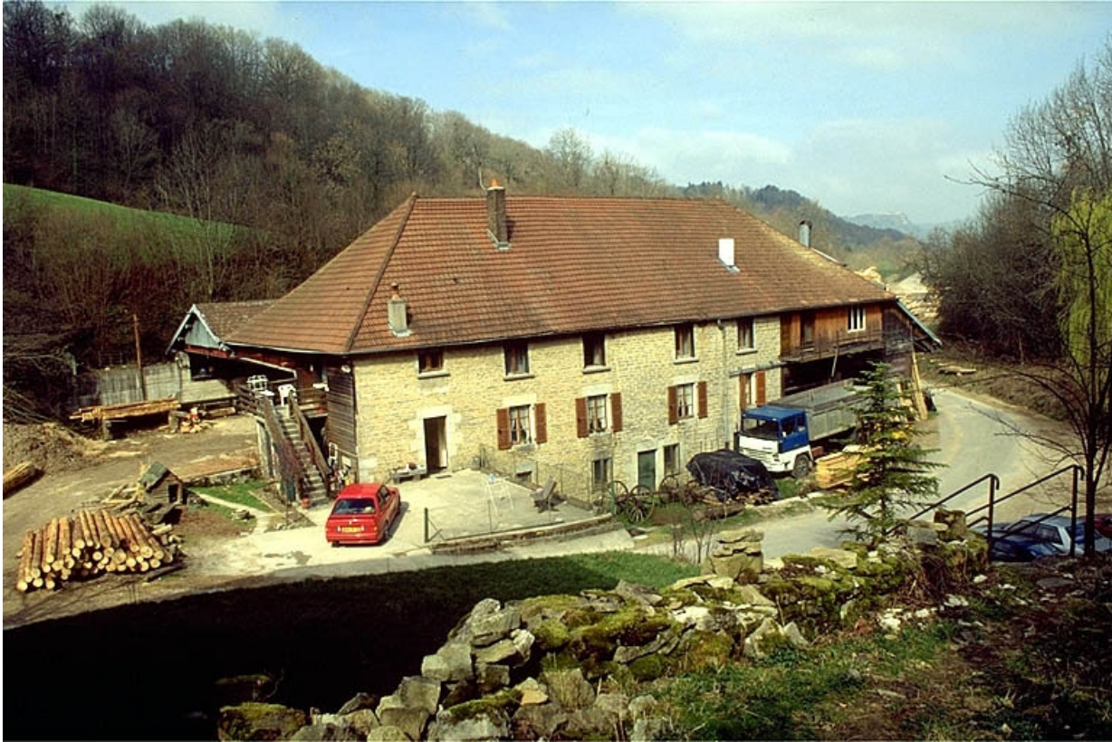
Vue d'ensemble depuis l'est.