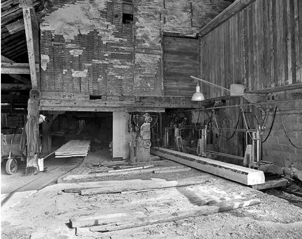
Intérieur de l'atelier de sciage.