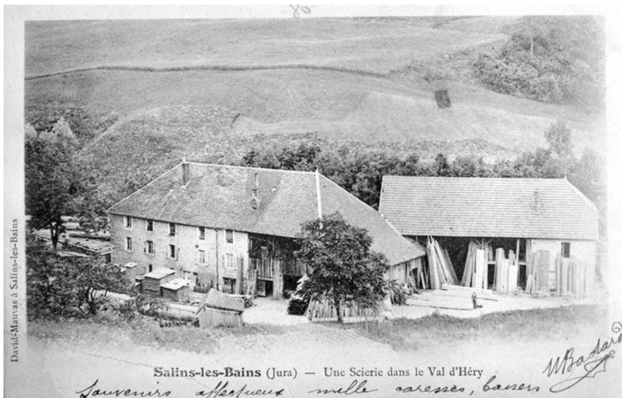
Salins-les-Bains (Jura) - Une Scierie dans le Val d'Héry. Datation : porte la date 18 juin 1903