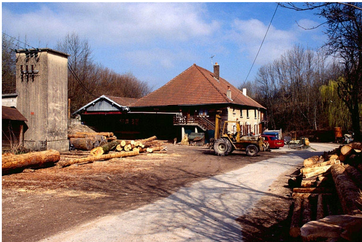
Vue d'ensemble depuis le sud.