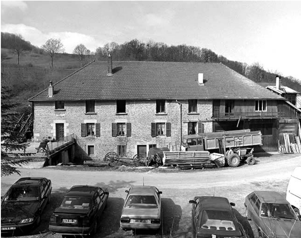
Logement et atelier de fabrication : façade antérieure.