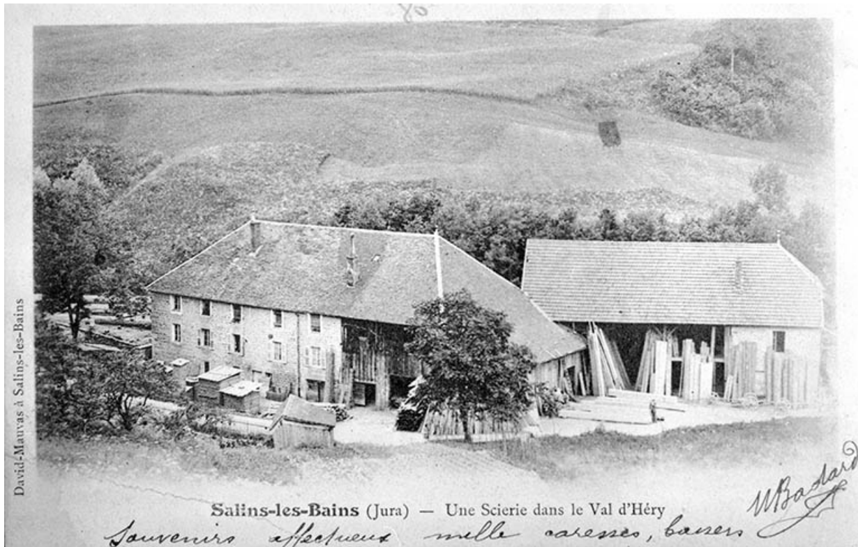
Salins-les-Bains (Jura) - Une Scierie dans le Val d'Héry. Datation : porte la date 18 juin 1903