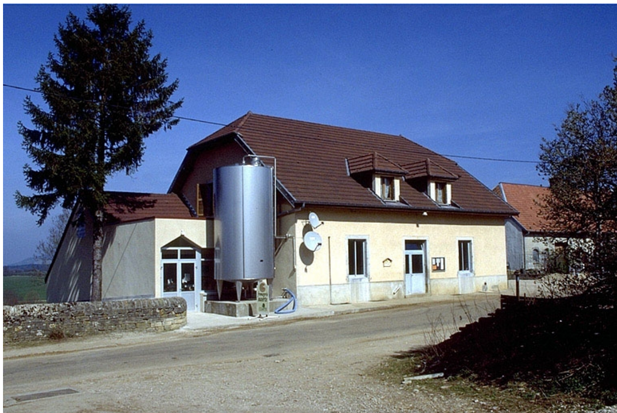
Vue de trois quarts gauche.