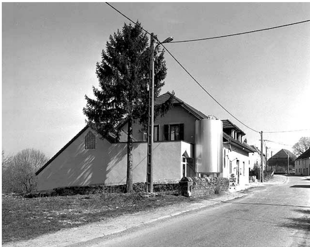
Vue d'ensemble depuis l'ouest.