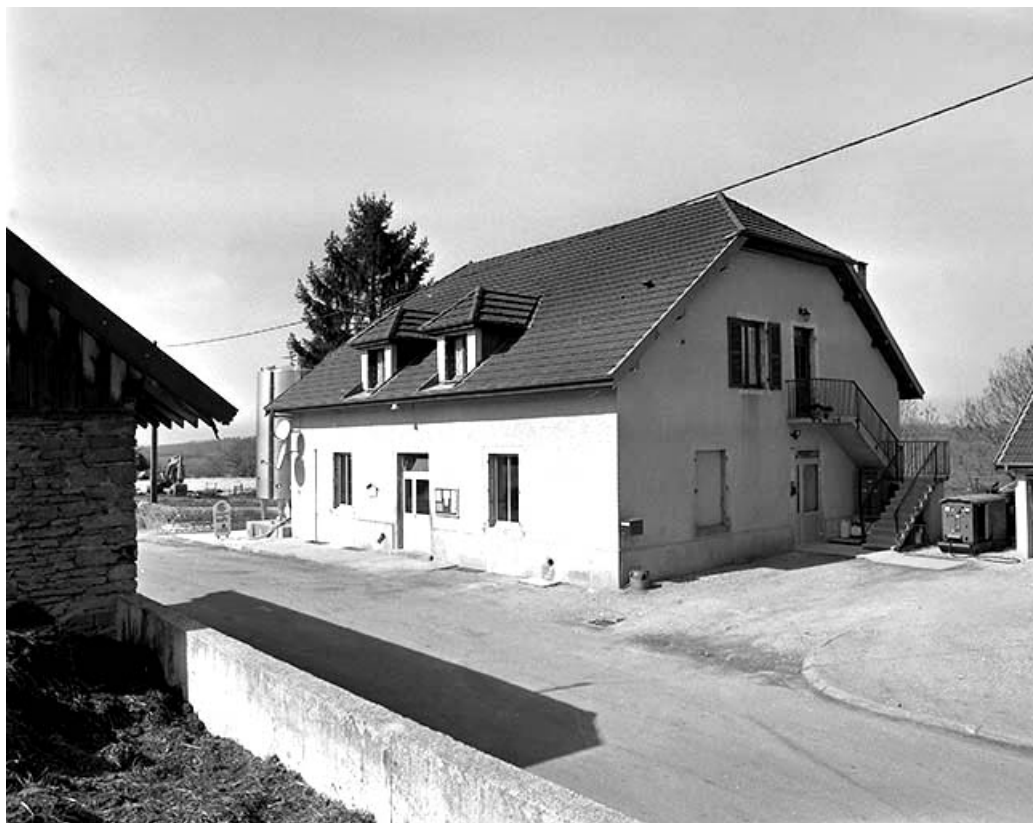
Vue de trois quarts droit.