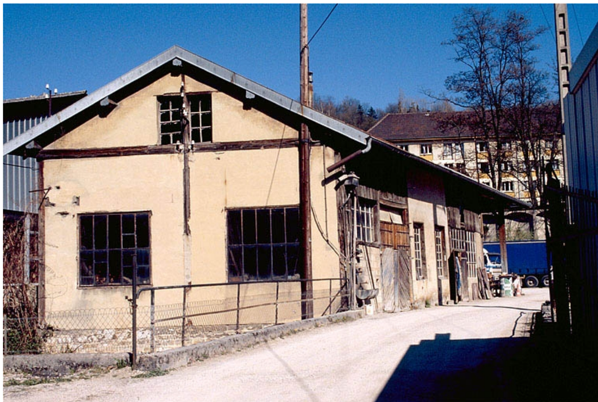
Atelier de réparation depuis la rive gauche. 39, Salins-les-Bains, 6, 8 avenue Aristide Briand