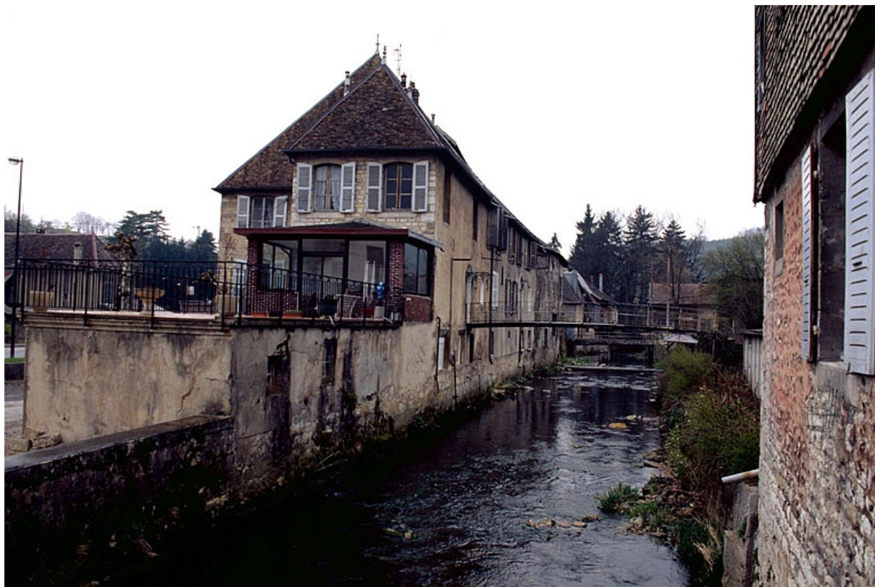
Façade sur rivière des bureaux et de l'atelier de fabrication.

39, Salins-les-Bains, 6, 8 avenue Aristide Briand