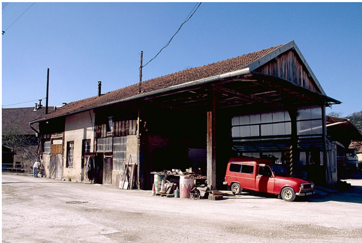
Vue de trois quarts de l'atelier de réparation. 39, Salins-les-Bains, 6, 8 avenue Aristide Briand