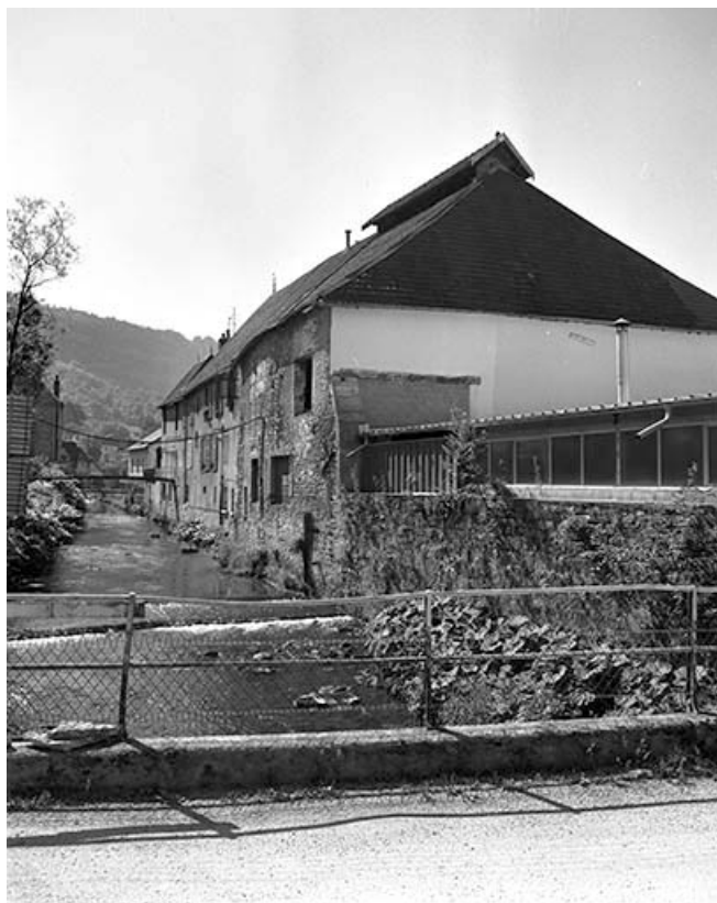
Façade postérieure de l'atelier de fabrication. 39, Salins-les-Bains, 6, 8 avenue Aristide Briand