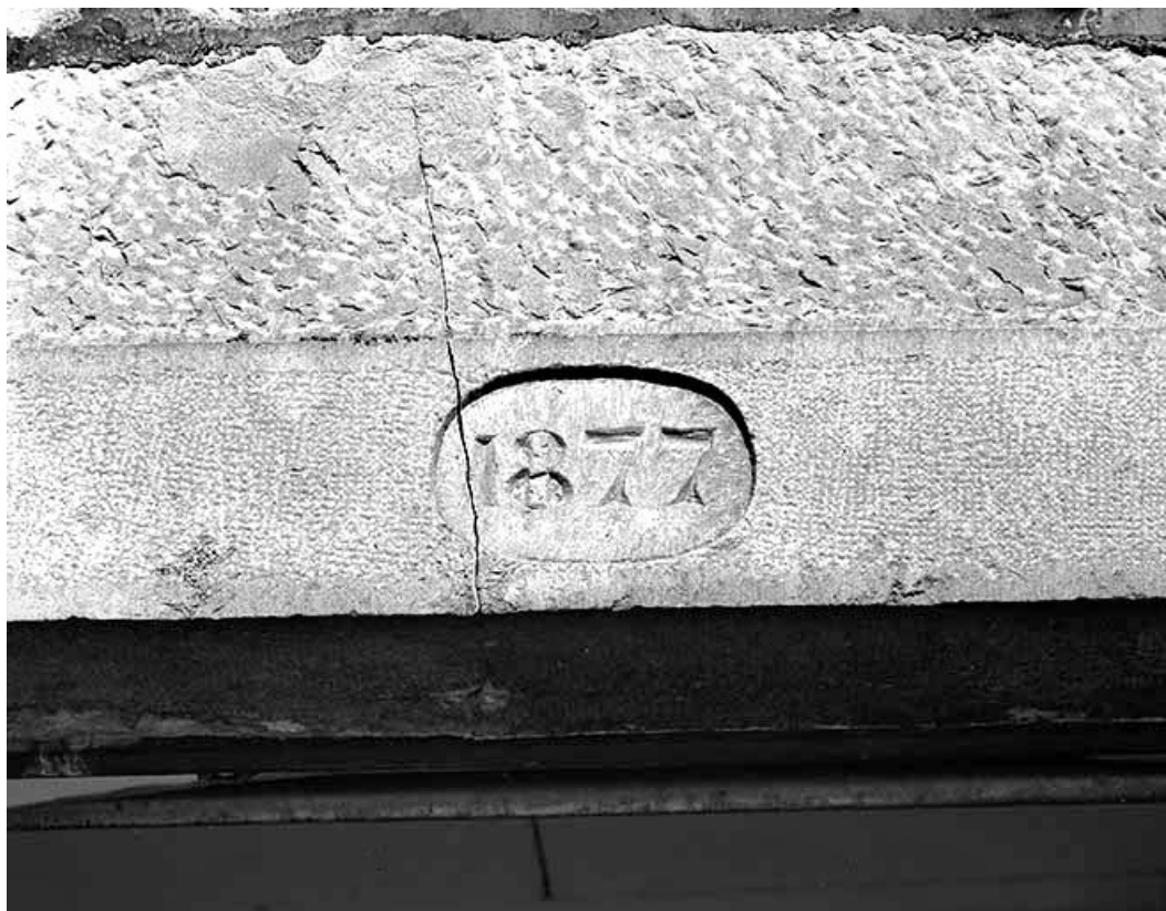
Détail du linteau de la porte d'entrée.