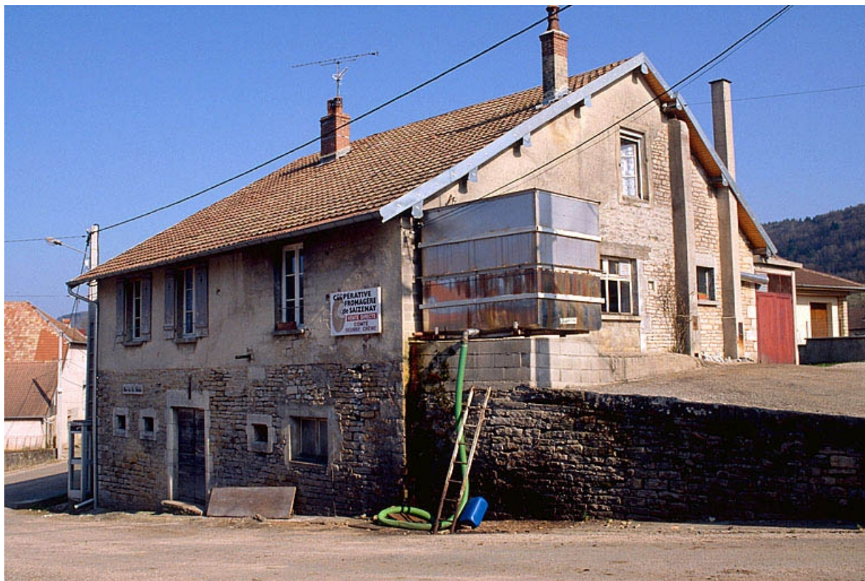
Vue de trois quarts droit.