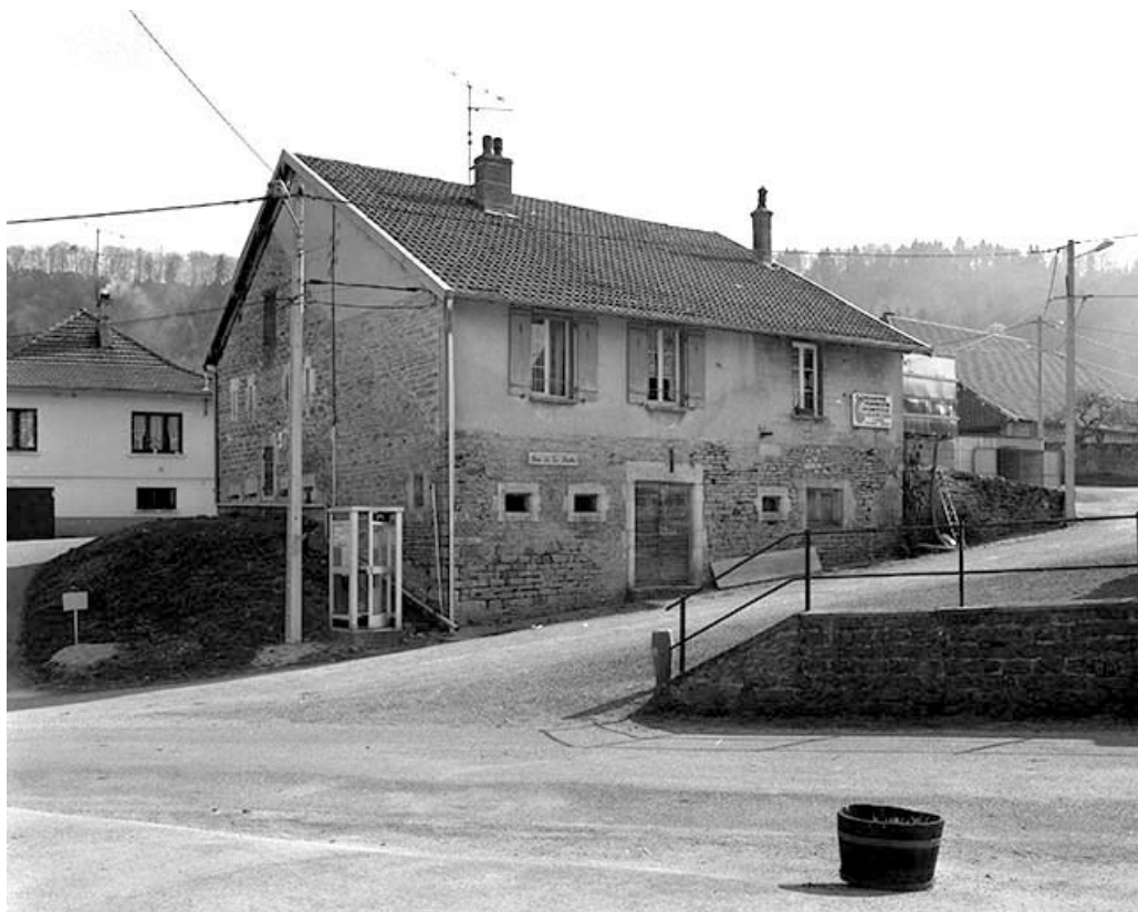
Vue d'ensemble depuis le nord.