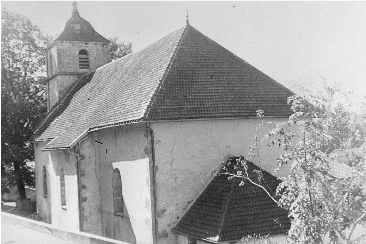
Face sud et chevet.

39, Villard-Saint-Sauveur, lieudit : le Villard