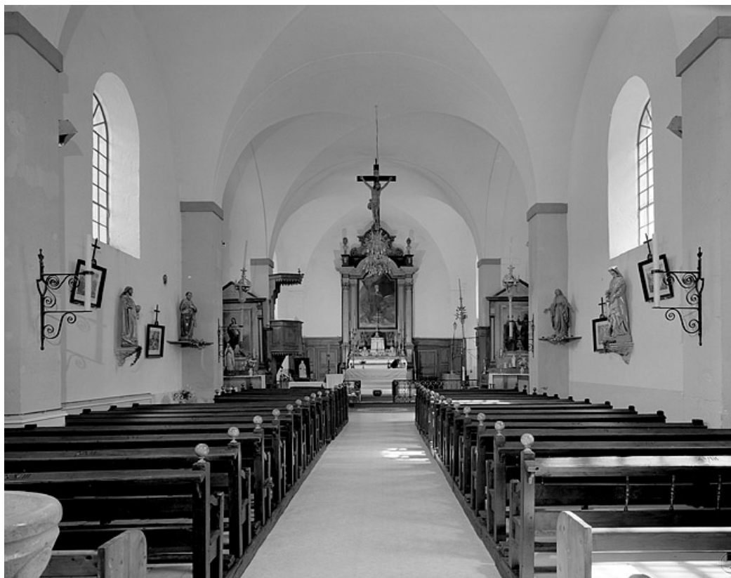
La nef et le chœur vus depuis l'entrée.

39, Villard-Saint-Sauveur, lieudit : le Villard