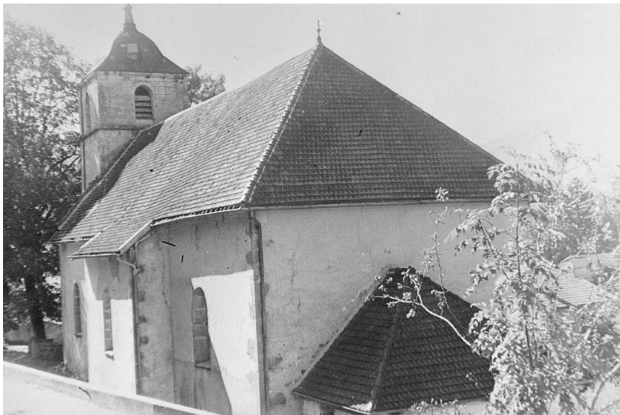
Face sud et chevet.

39, Villard-Saint-Sauveur, lieudit : le Villard