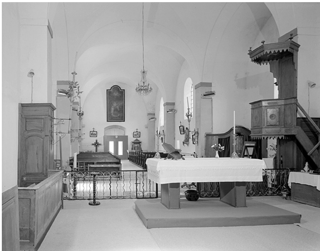
Élévation intérieure nord vue depuis le chœur.

39, Villard-Saint-Sauveur, lieudit : le Villard