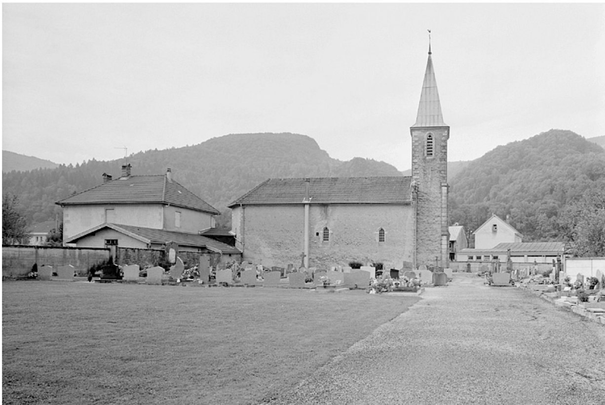
Vue de situation depuis le nord.