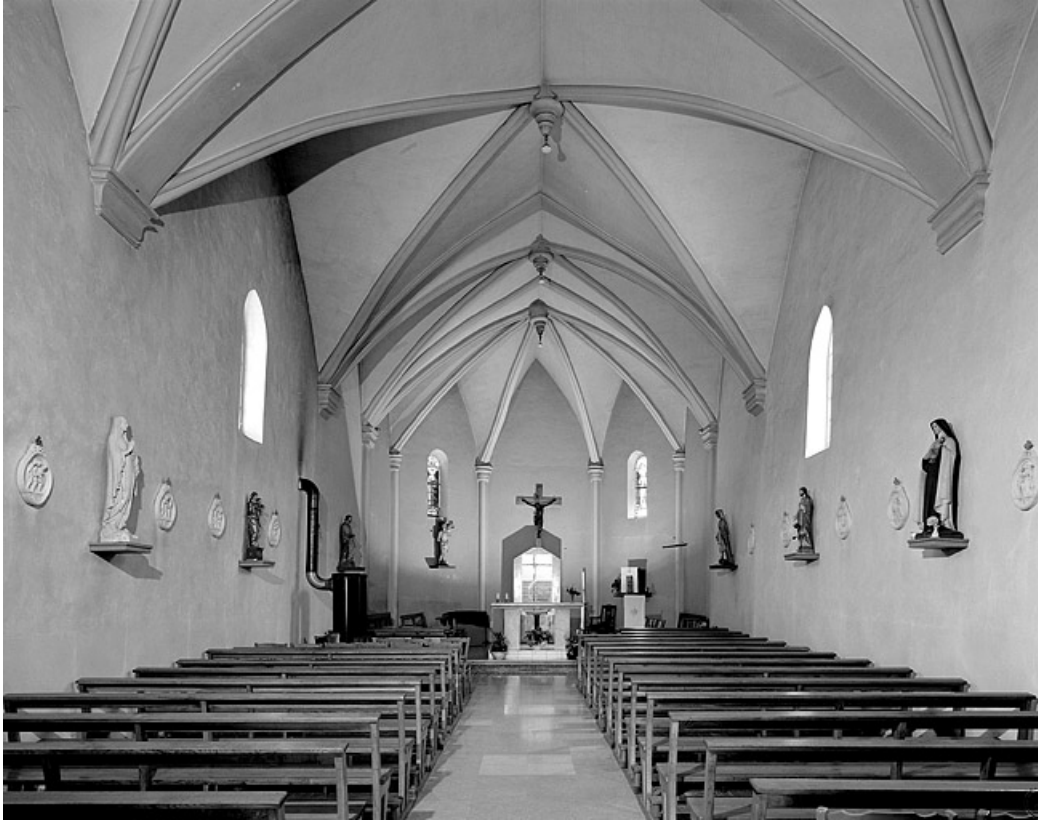
La nef et le chœur vus depuis l'entrée.