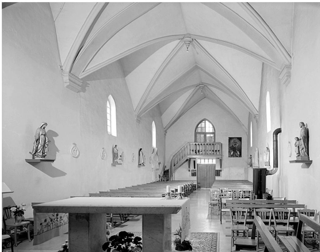
Élévation intérieure sud de la nef vue depuis le chœur.