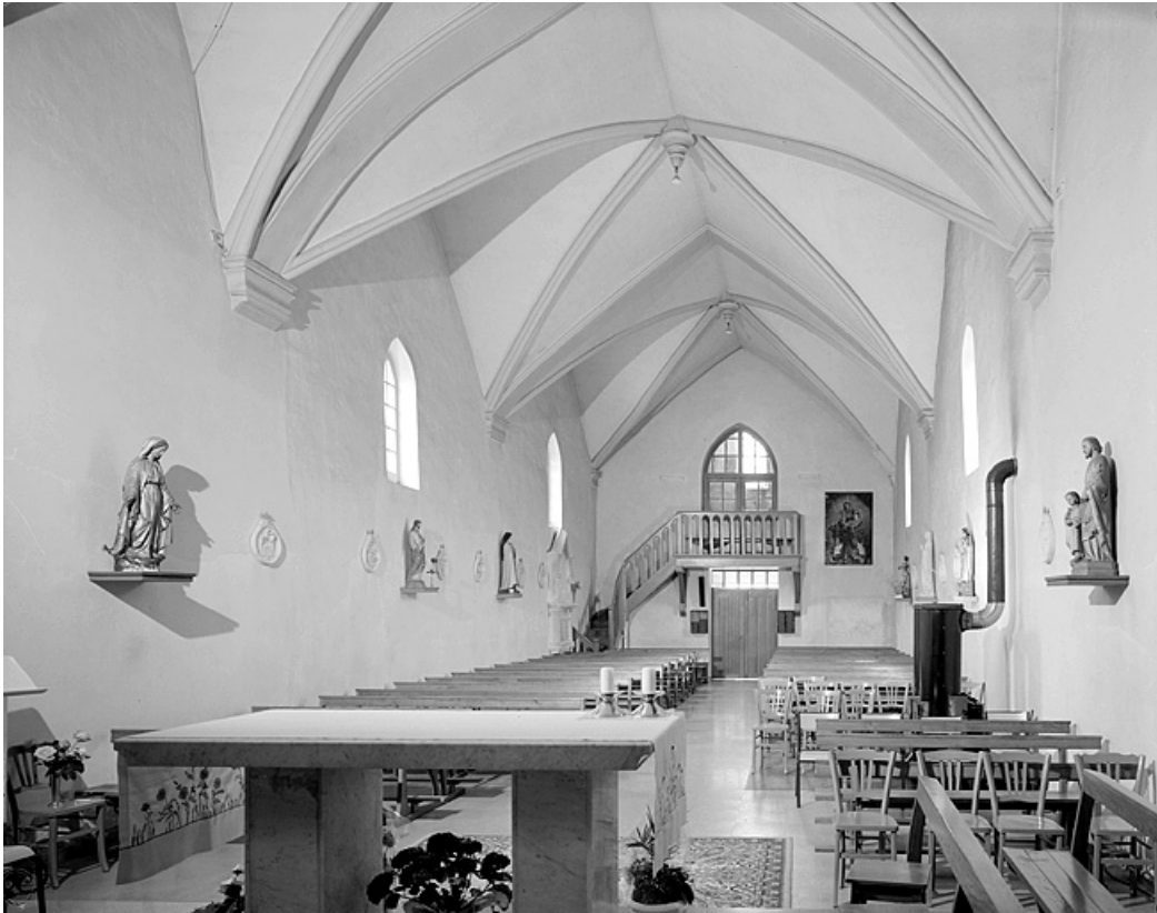
Elévation intérieure sud de la nef vue depuis le chœur.