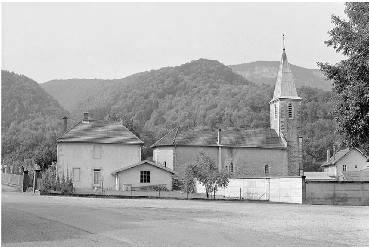
Vue de situation depuis le nord-est.