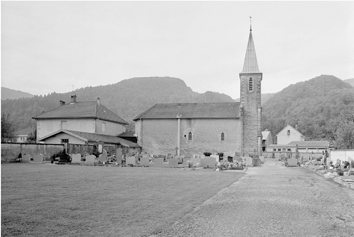
Vue de situation depuis le nord.