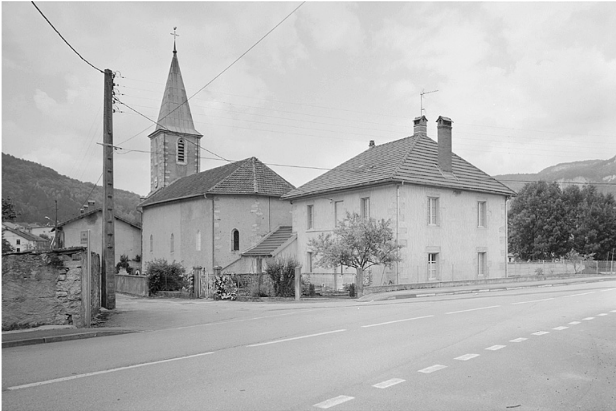
Vue de situation depuis le sud-est.