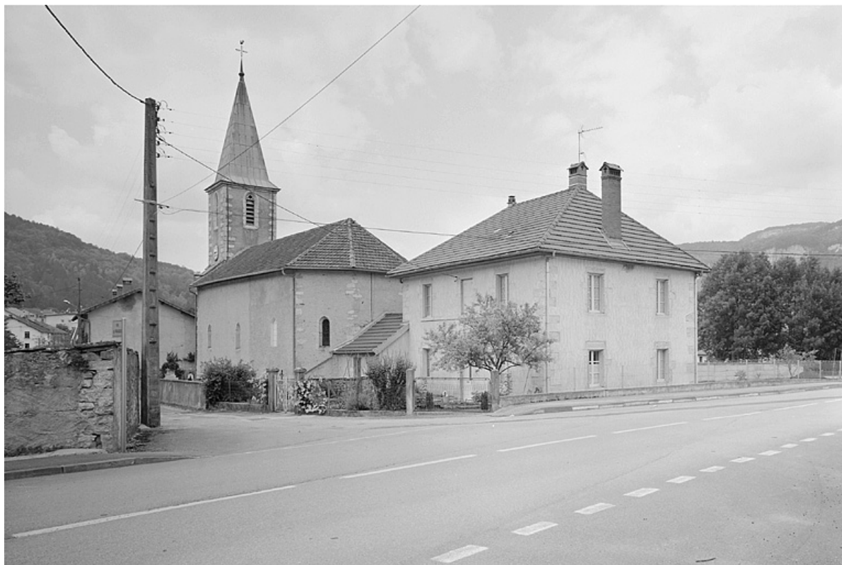
Vue de situation depuis le sud-est.