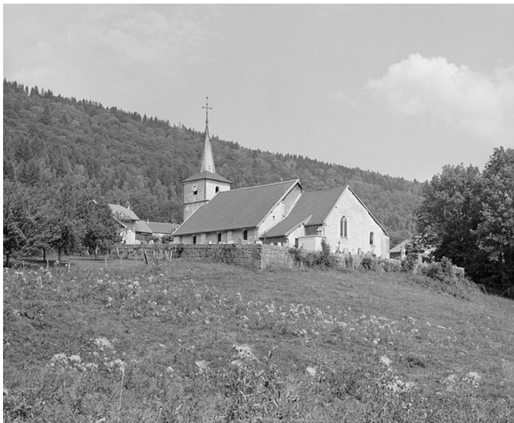
Vue de situation depuis le sud-est.