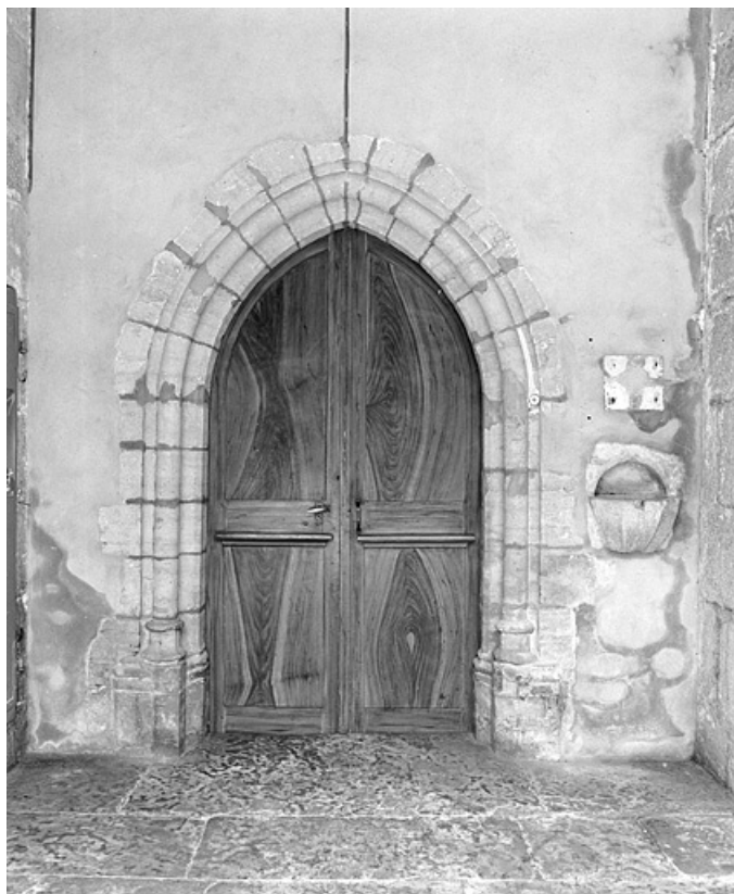
Le portail de la nef.