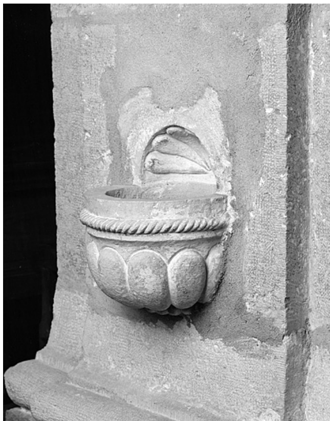
Bénitier encastré dans la nef, vu de trois quarts.