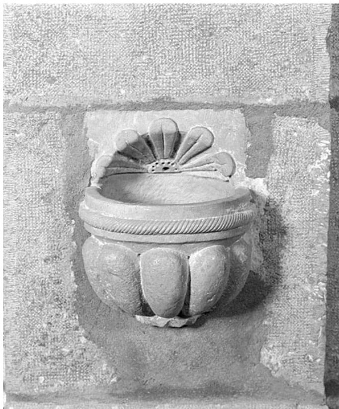
Bénitier encastré dans le chœur.