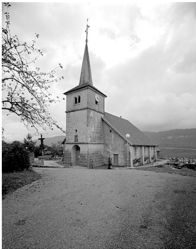
Façade antérieure et face droite.