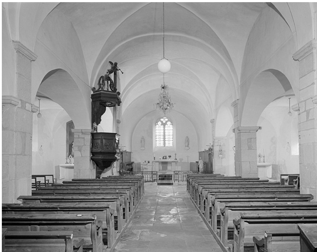
La nef et le chœur vus depuis l'entrée.