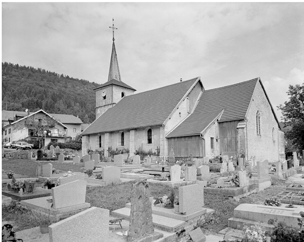
Face droite et chevet.