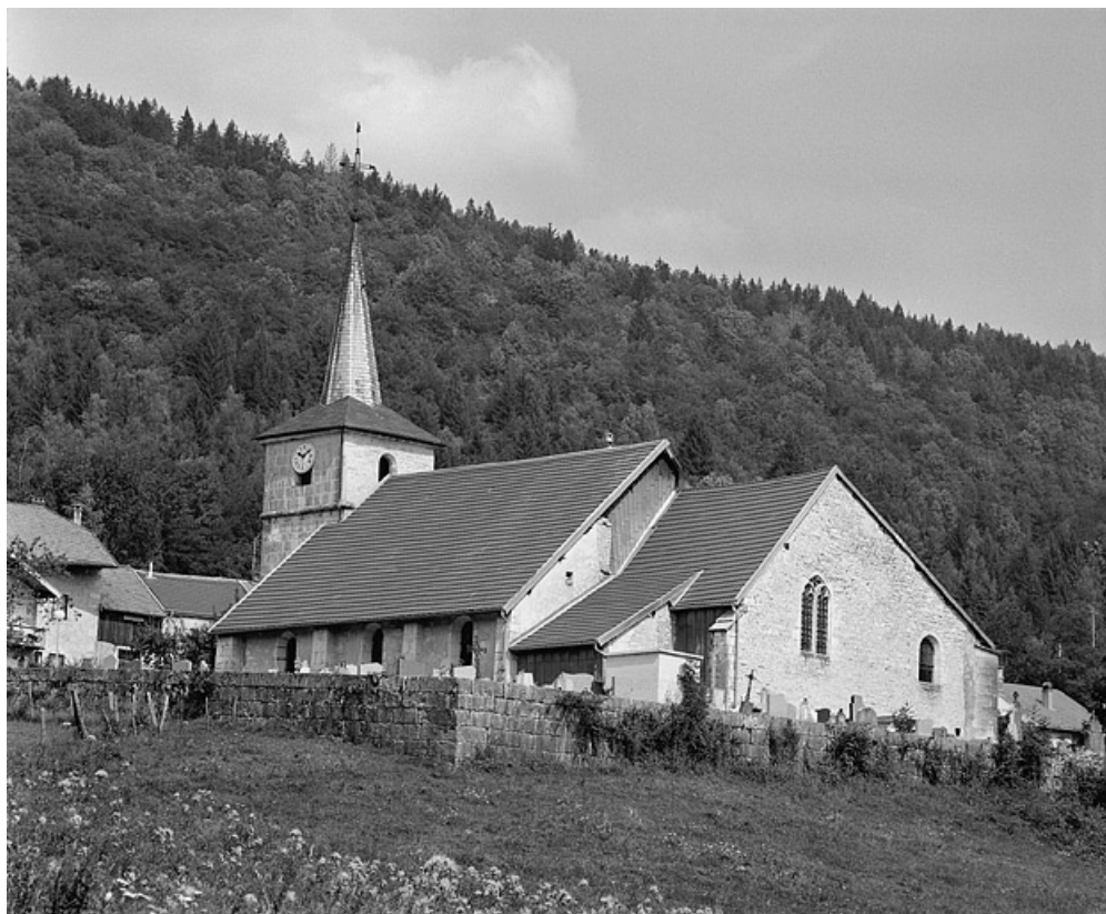
Vue générale depuis le sud-est.