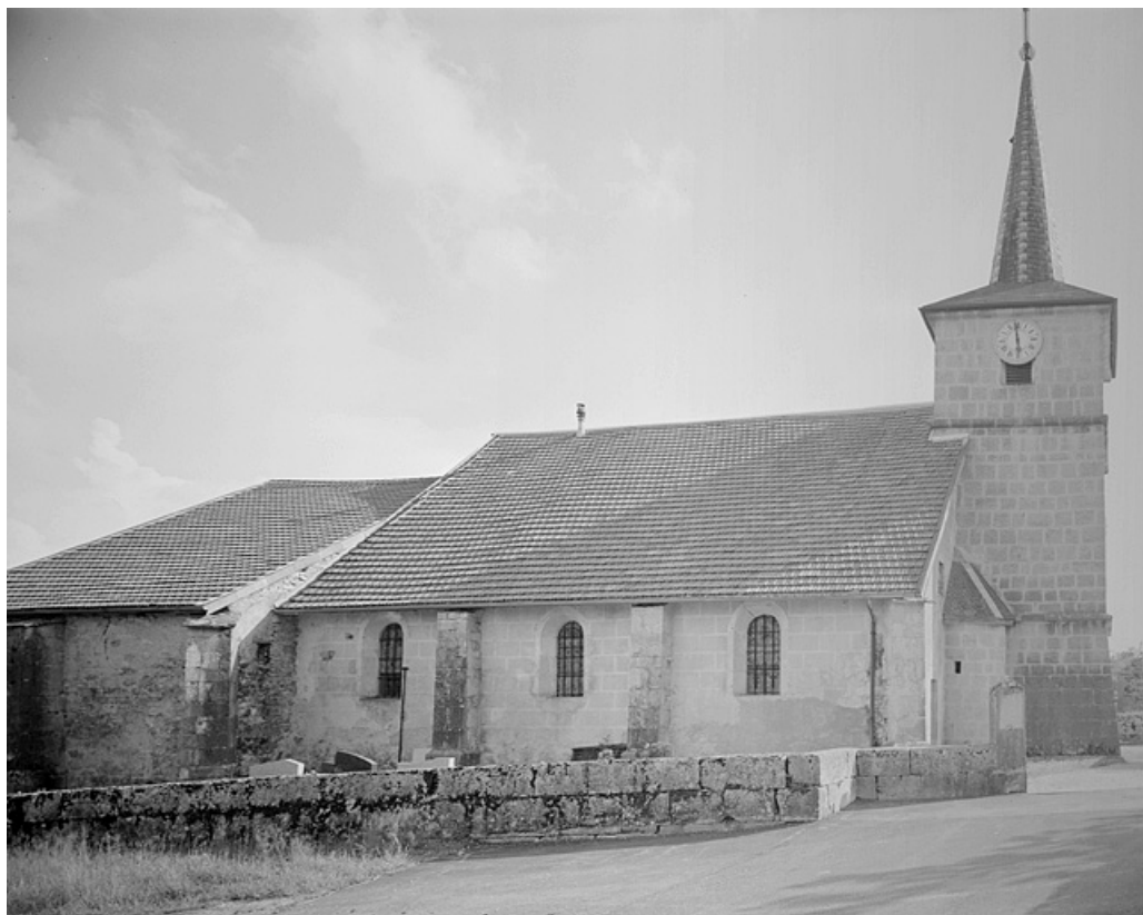
Face gauche. 39, La Rixouse