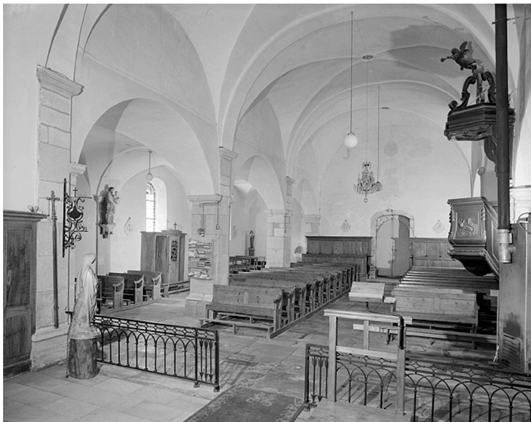
Élévation intérieure sud de la nef vue depuis le chœur.