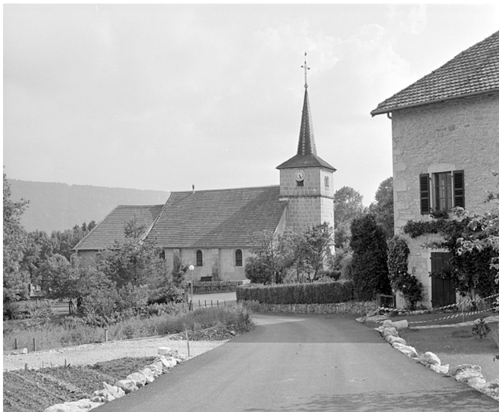
Vue de situation depuis le nord-ouest.