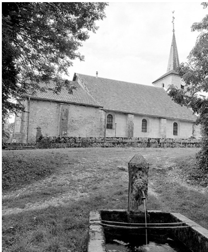
Face gauche, vue depuis le nord-est. 39, La Rixouse