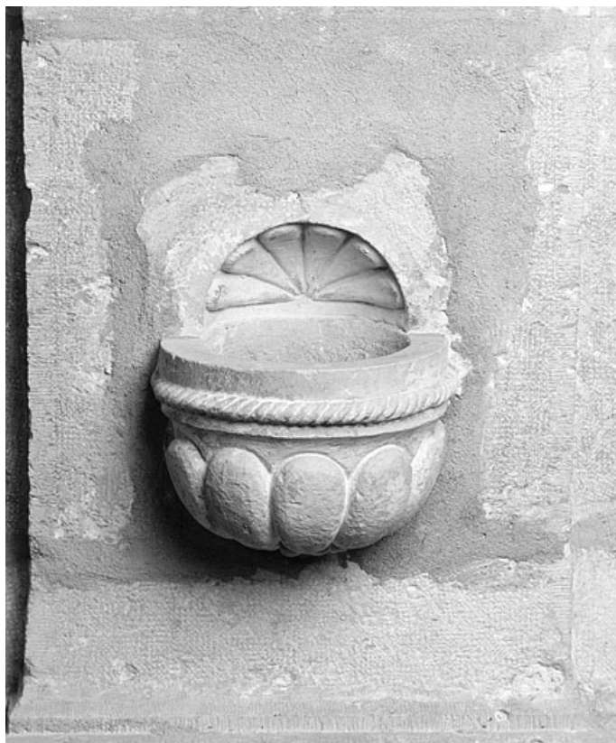
Bénitier encastré dans la nef, vu de face.