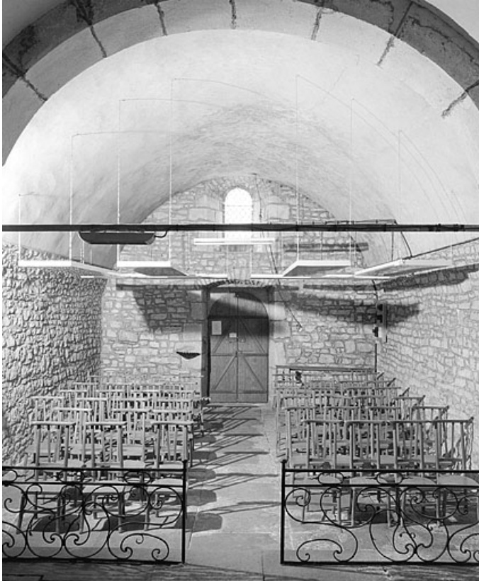
La nef vue depuis le chœur (vue verticale).