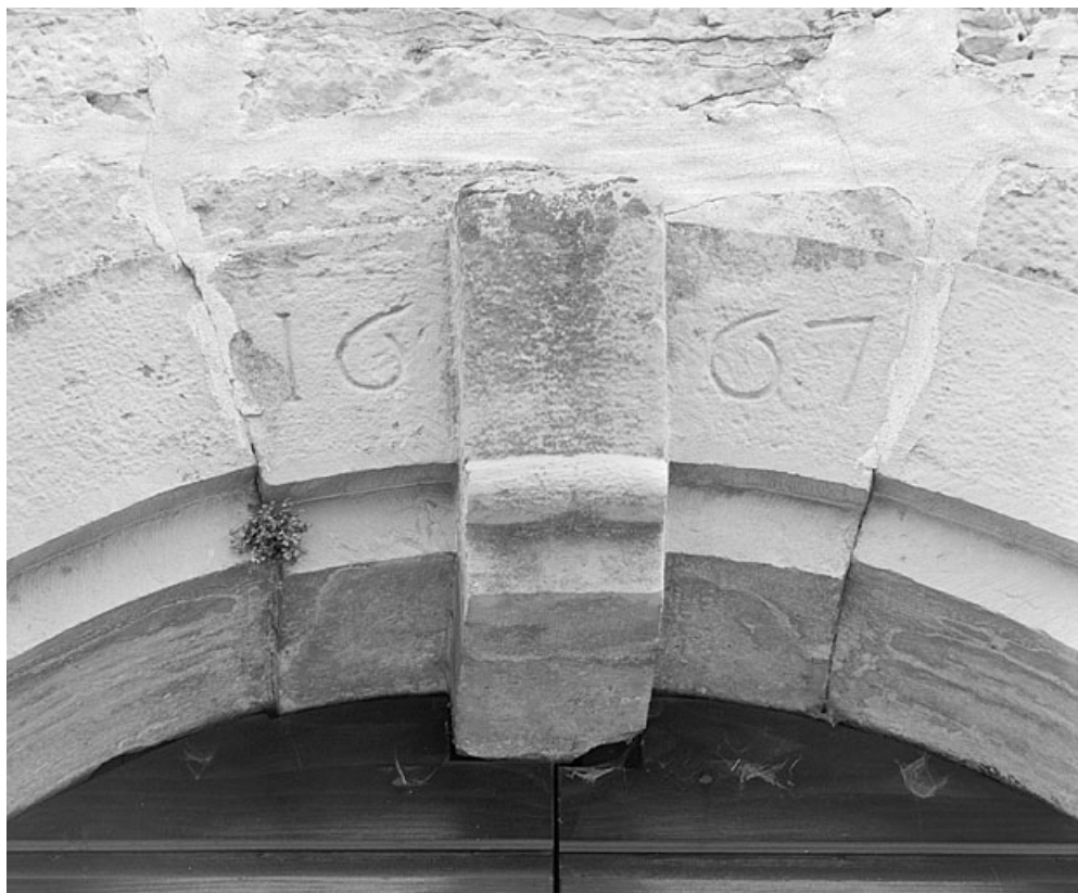
Date sur la clef de l'arc d'entrée de la nef. 39, Ravilloles