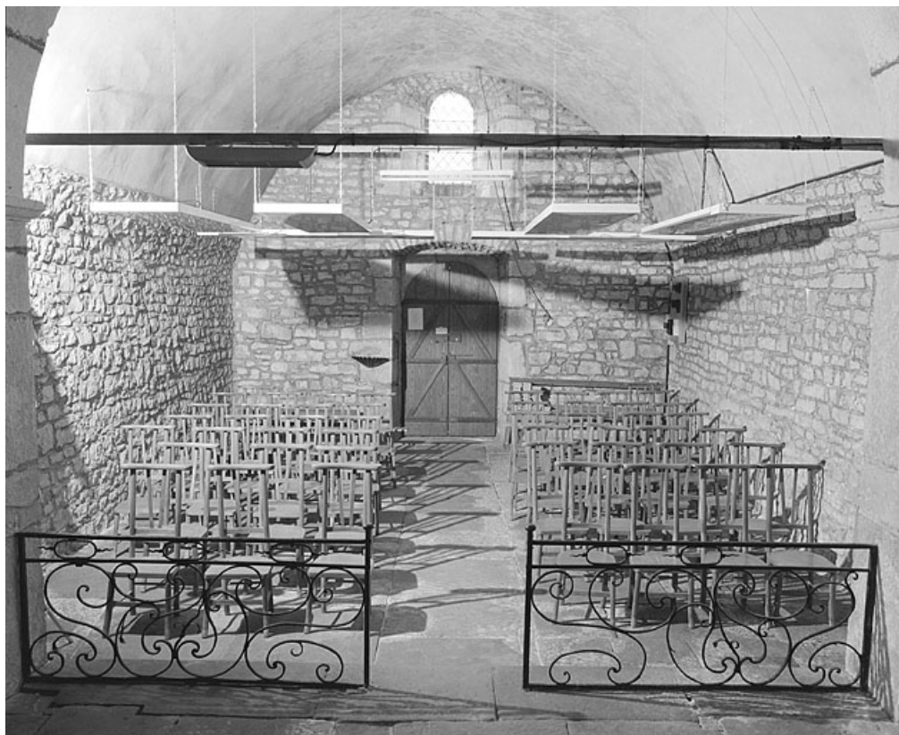
La nef vue depuis le chœur (vue horizontale).