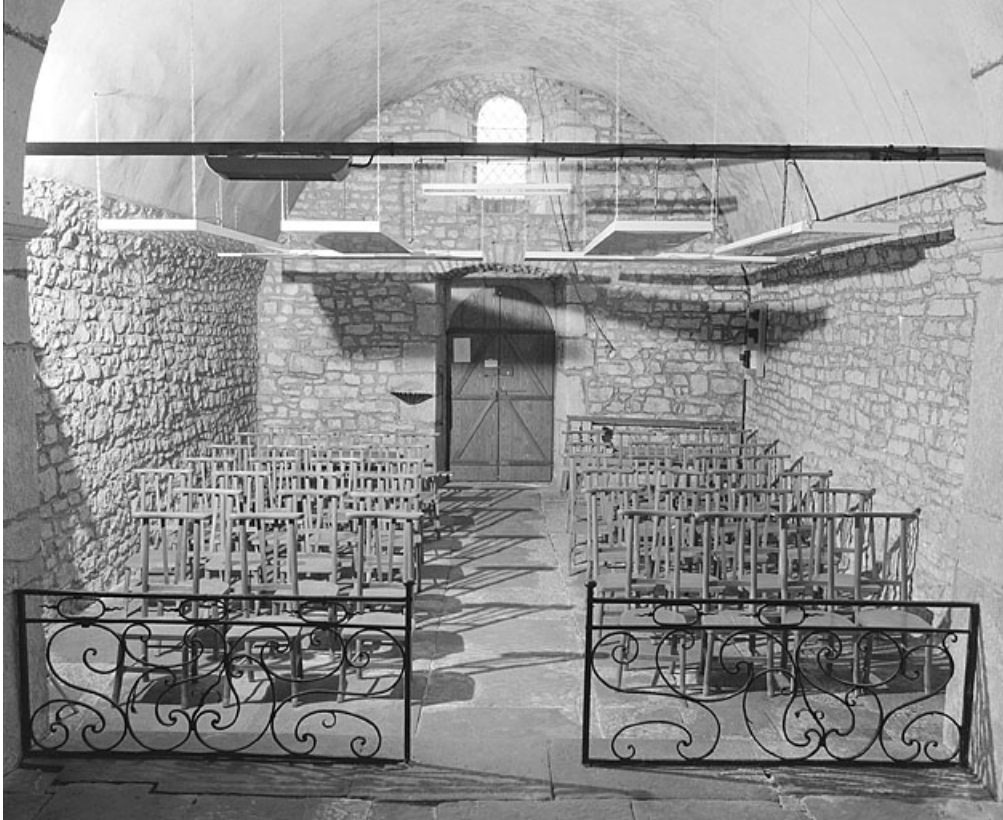
La nef vue depuis le chœur (vue horizontale).