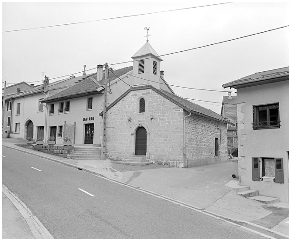
Vue de situation depuis le sud-ouest. 39, Ravilloles