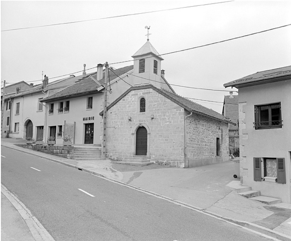
Vue de situation depuis le sud-ouest.