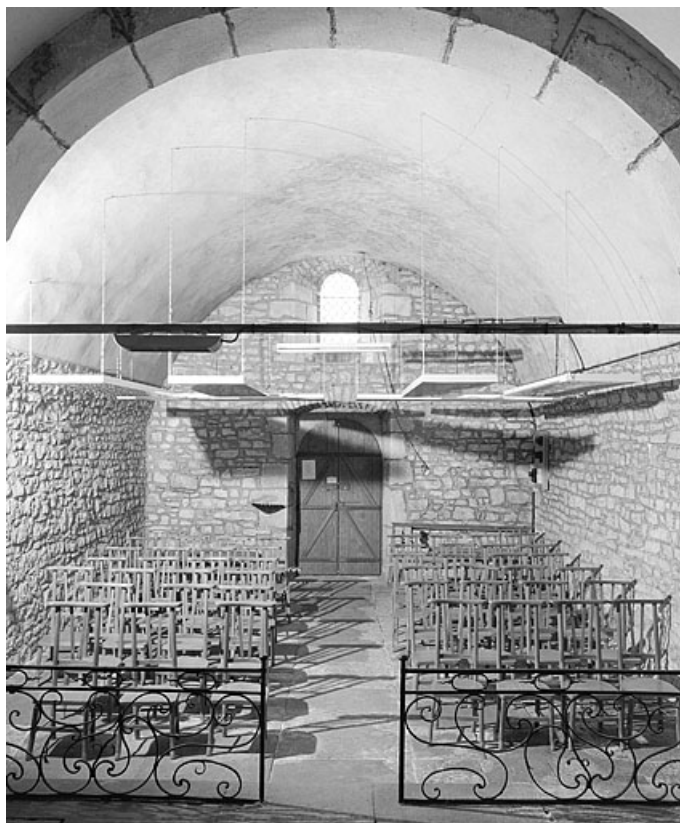
La nef vue depuis le chœur (vue verticale).