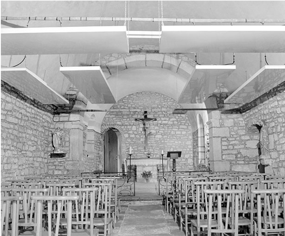
La nef et le chœur vus depuis l'entrée.