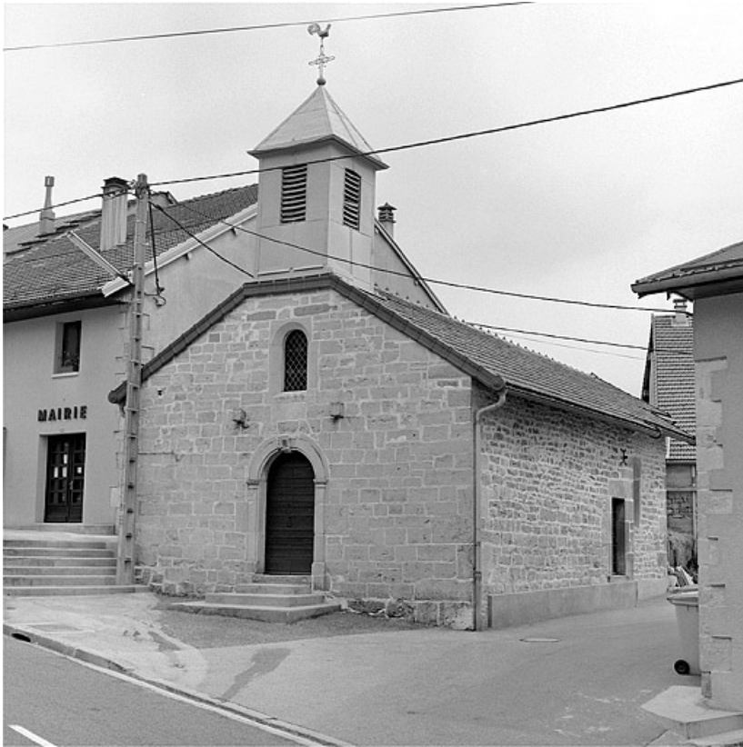
Façade ouest et face sud.