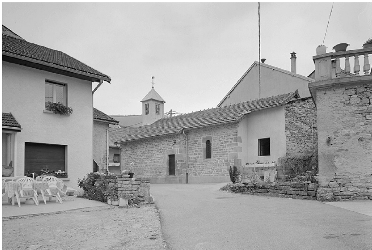
Face sud. 39, Ravilloles