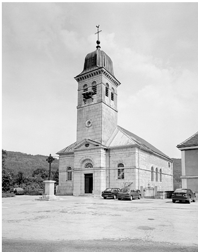
Façade antérieure et face droite.