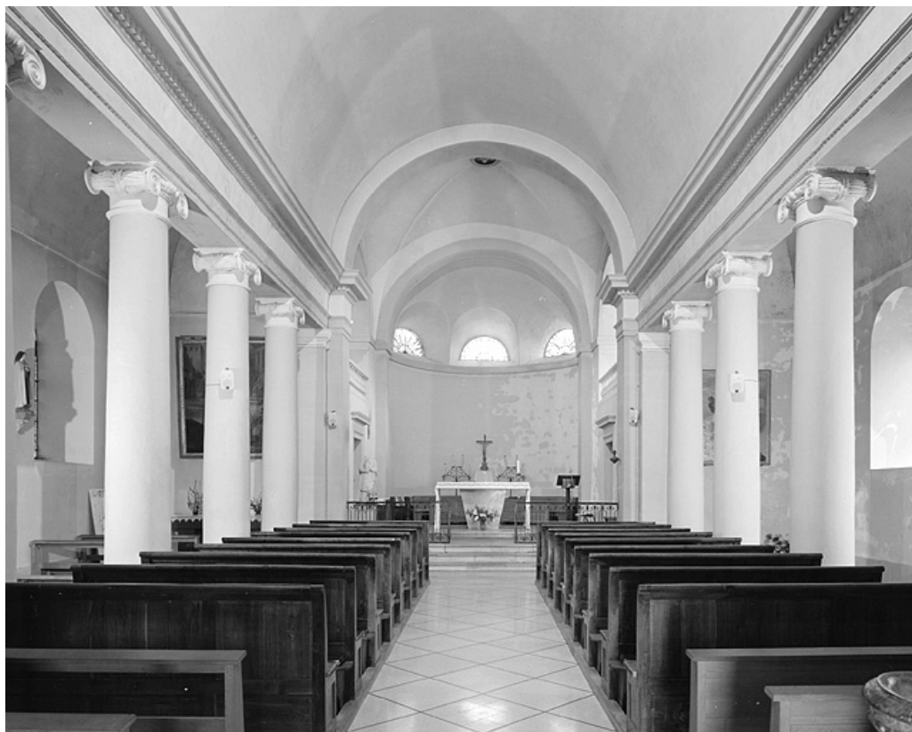
La nef et le chœur vus depuis l'entrée.