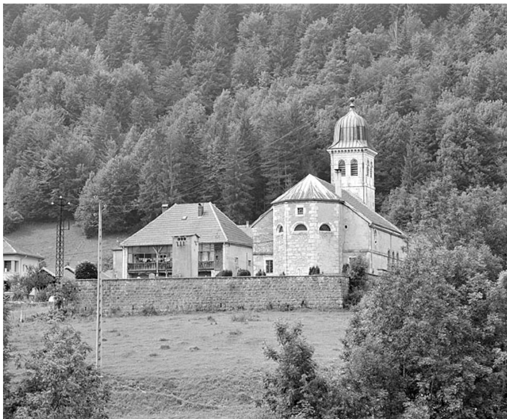
Le chevet et le presbytère.