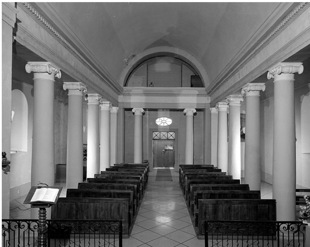
La nef vue depuis le chœur.