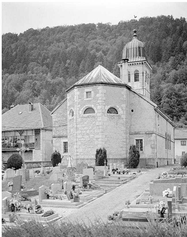
Le chevet, vu depuis le cimetière.