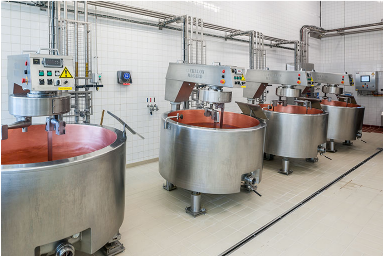
Salle de production de Comté. 39, Poligny rue du Champ de Foire