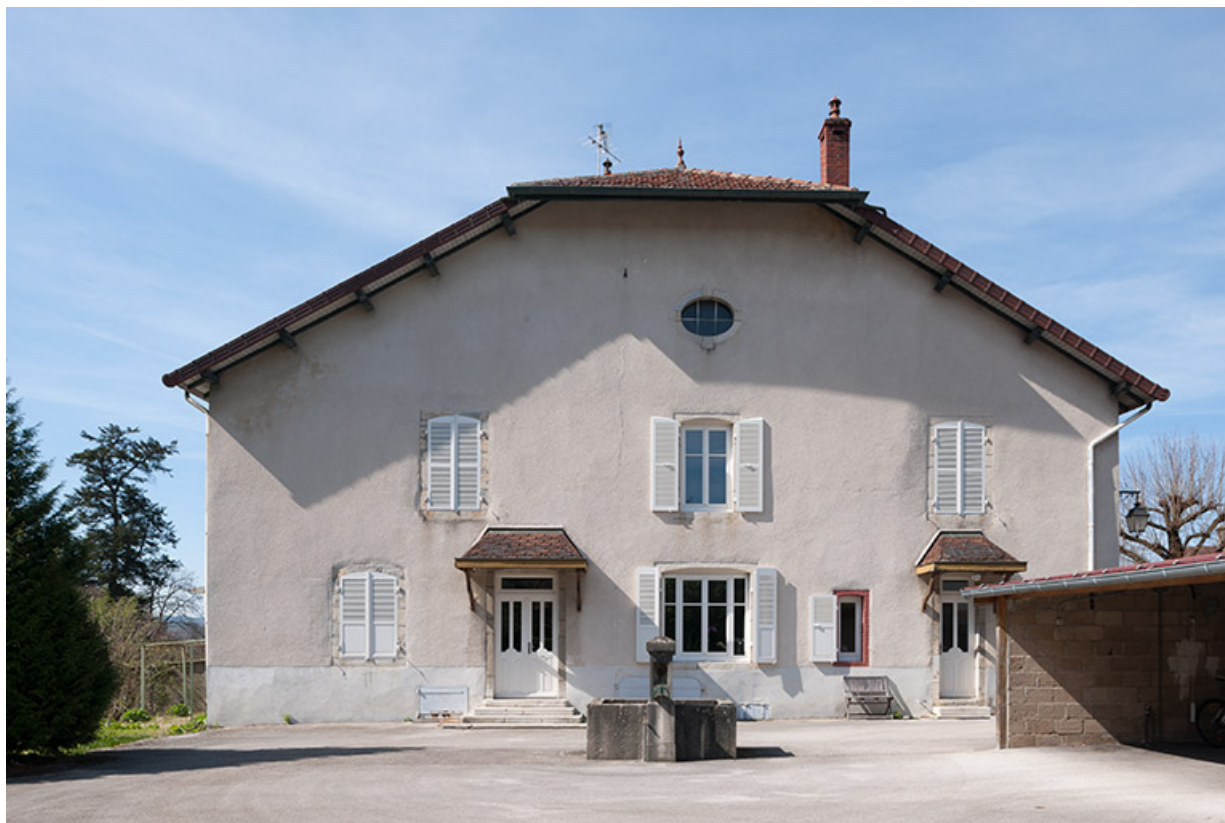
Façade est sur cour de la maison de fonction, 9 place Notre Dame.