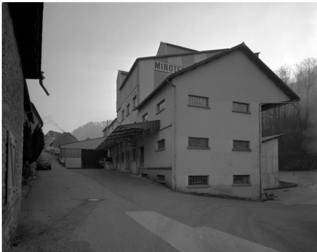
Vue d'ensemble depuis le nord.