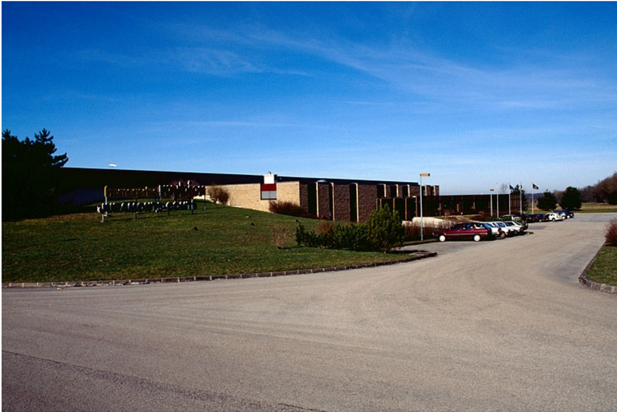
Chaufferie, quai d'expédition et bureaux depuis l'entrée.