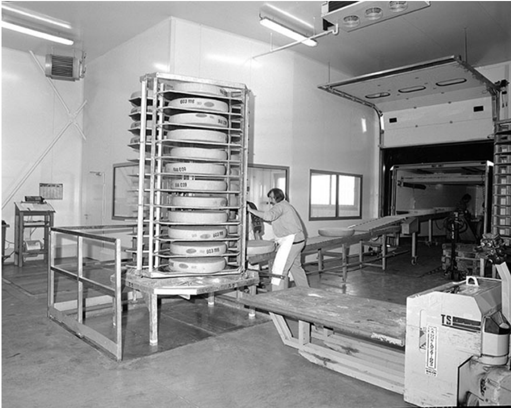
Module de chargement sur le monte-charge.