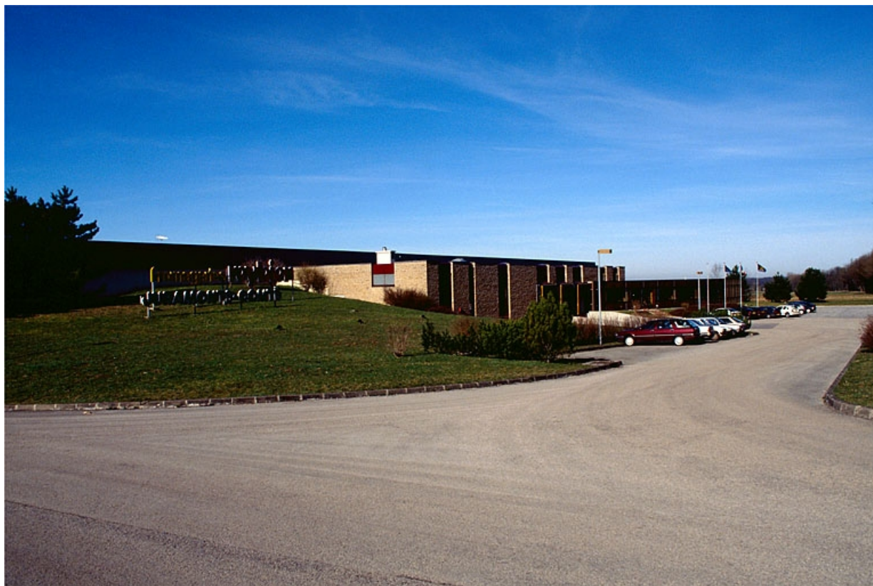
Chaufferie, quai d'expédition et bureaux depuis l'entrée.