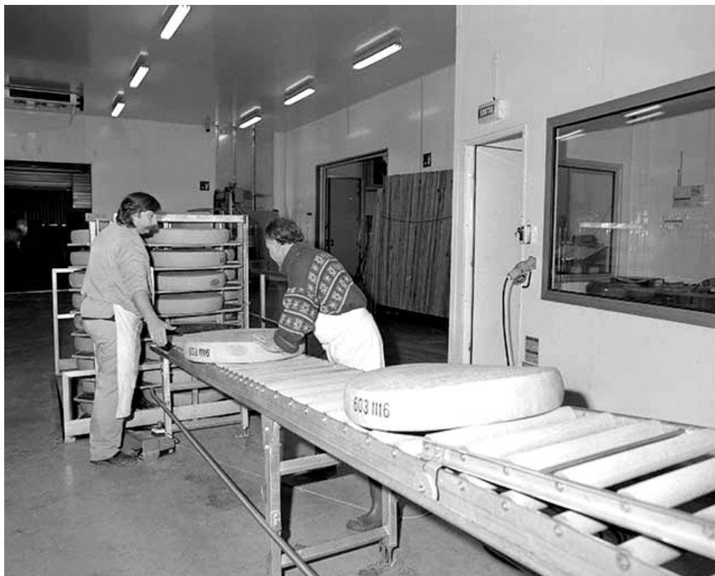
Quai de réception : déchargement des meules de comté.