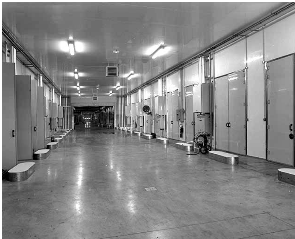
Couloir central des pièces d'affinage.