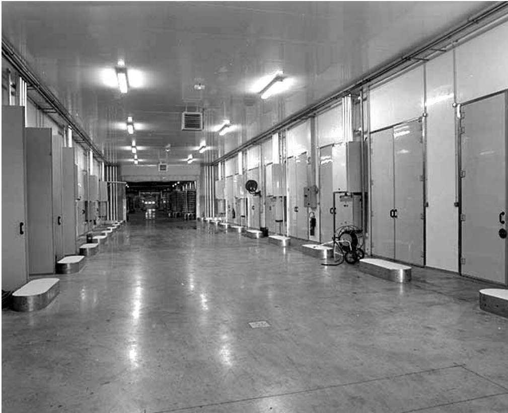
Couloir central des pièces d'affinage.