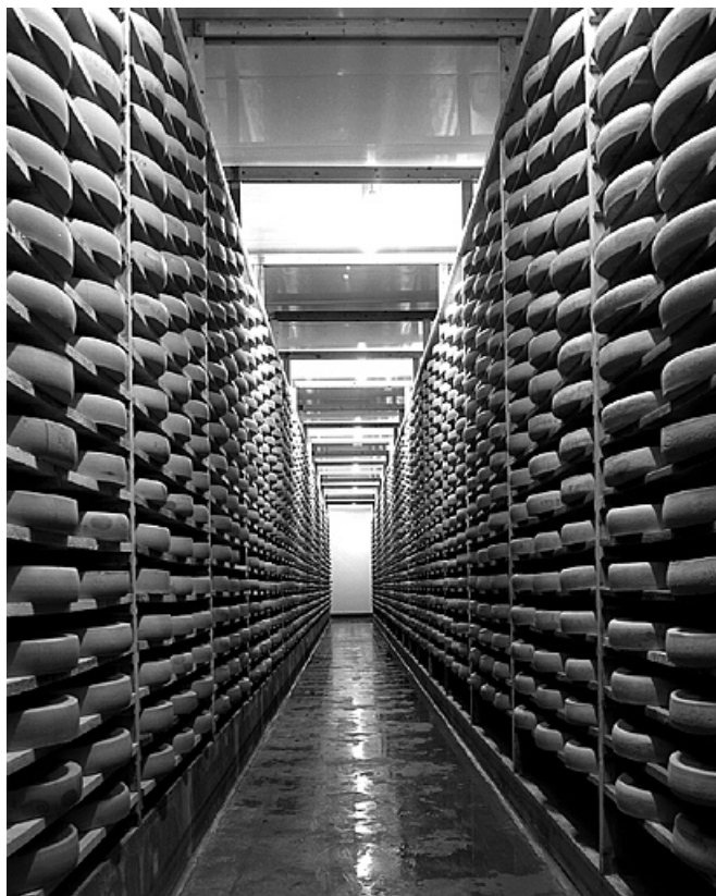
Intérieur d'une pièce d'affinage.