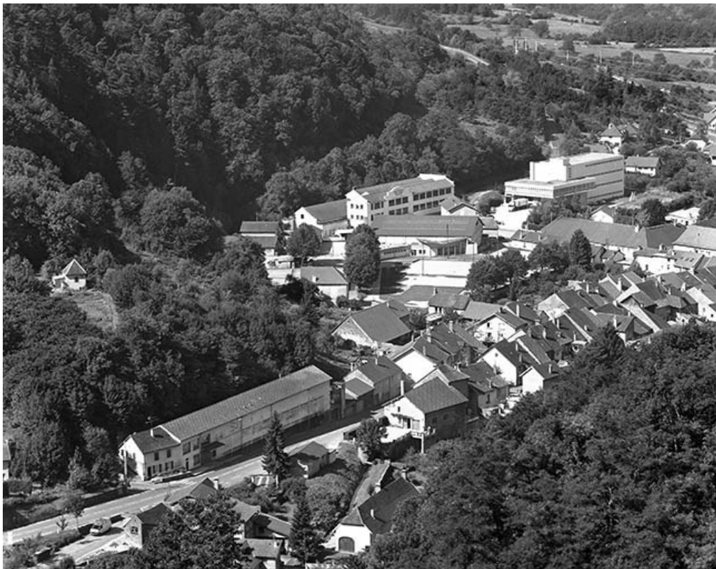
Vue générale depuis le nord-est.