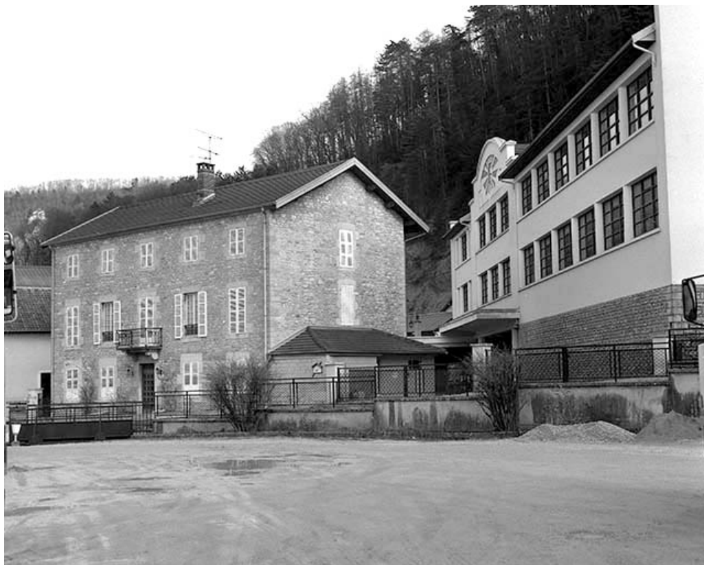
Logement patronal et atelier de fabrication vus de trois quarts droit.