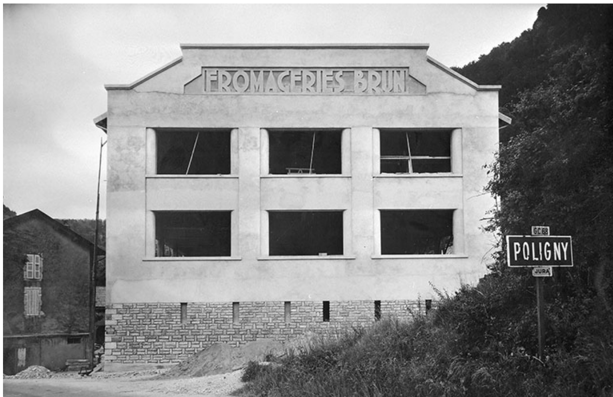
[Pignon ouest du nouvel atelier de fabrication].