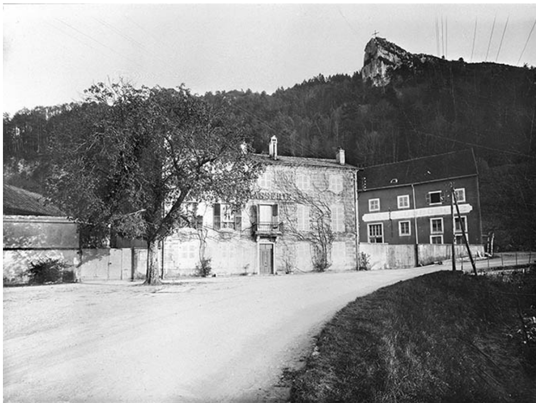
[Vue d'ensemble de la brasserie Dubouloz].