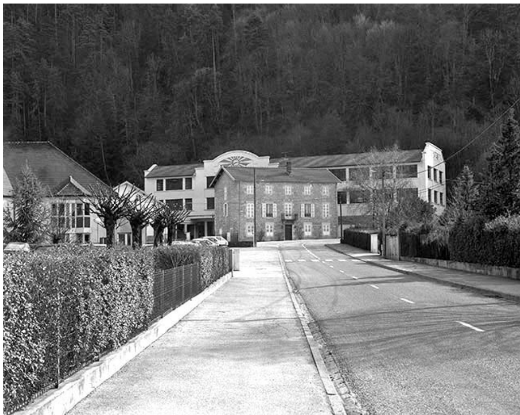
Vue d'ensemble depuis l'avenue Foch.