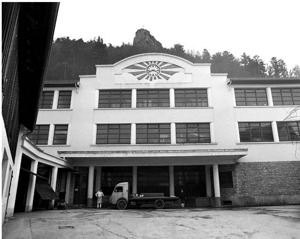
Atelier de fabrication : fronton de la façade.