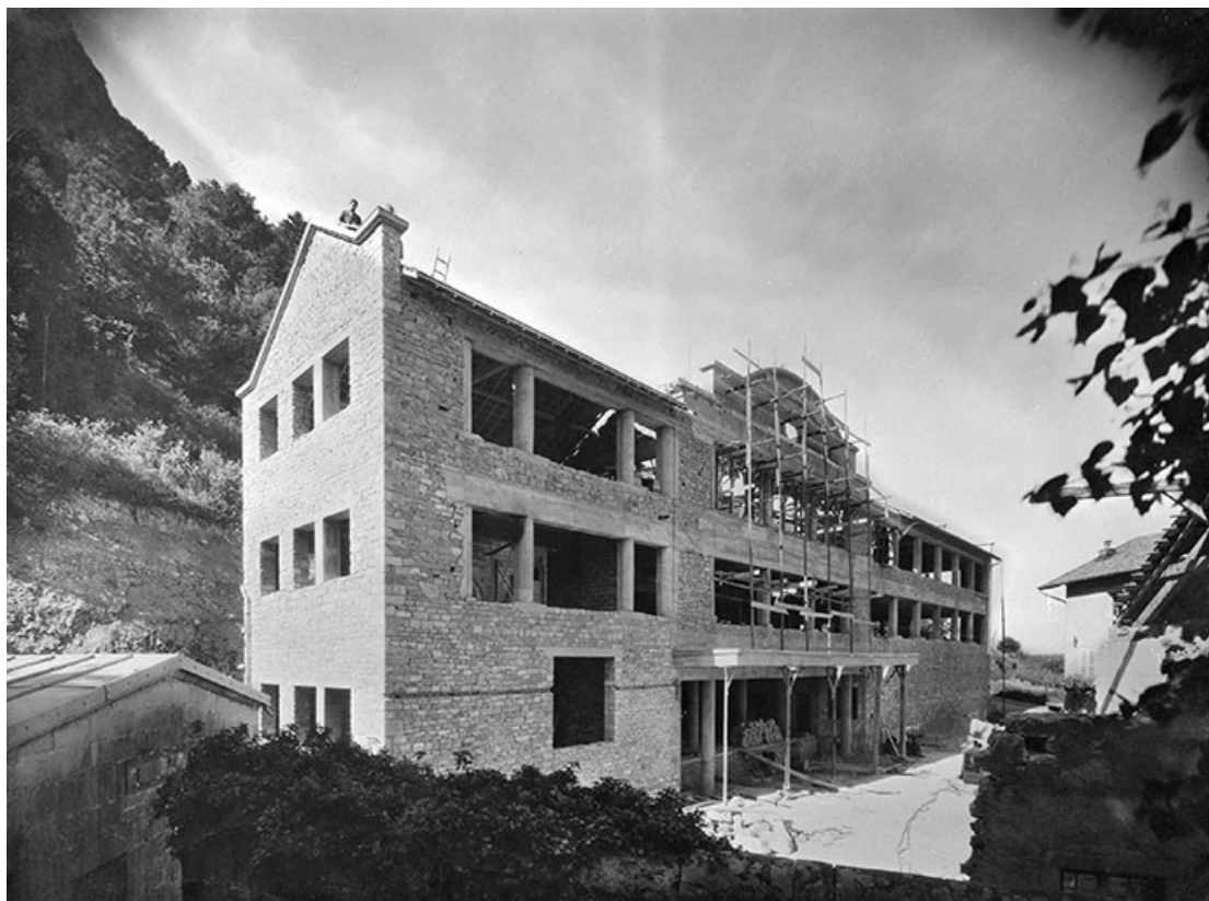
[L'atelier de fabrication de la fromagerie en construction].