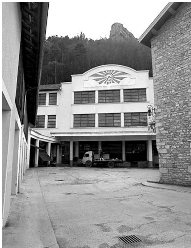
L'atelier de fabrication depuis l'entrée.