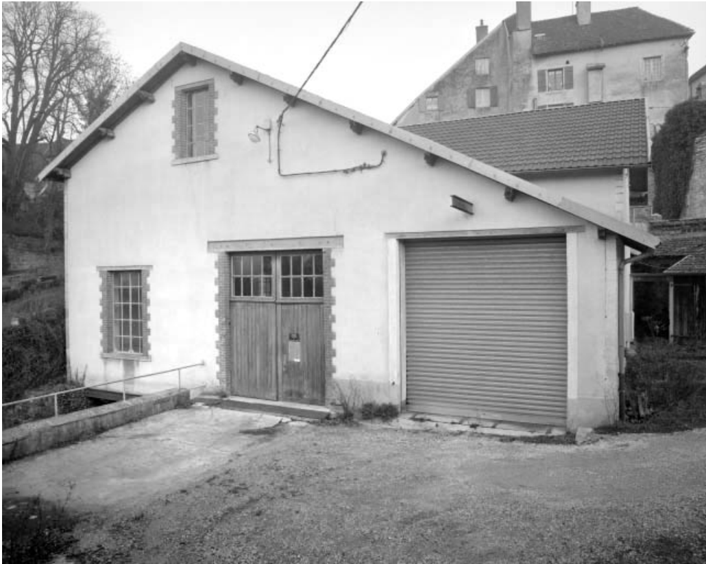
Façade antérieure depuis le sud-ouest.