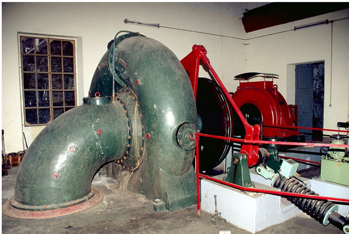
Vue rapprochée de la turbine n° 3.