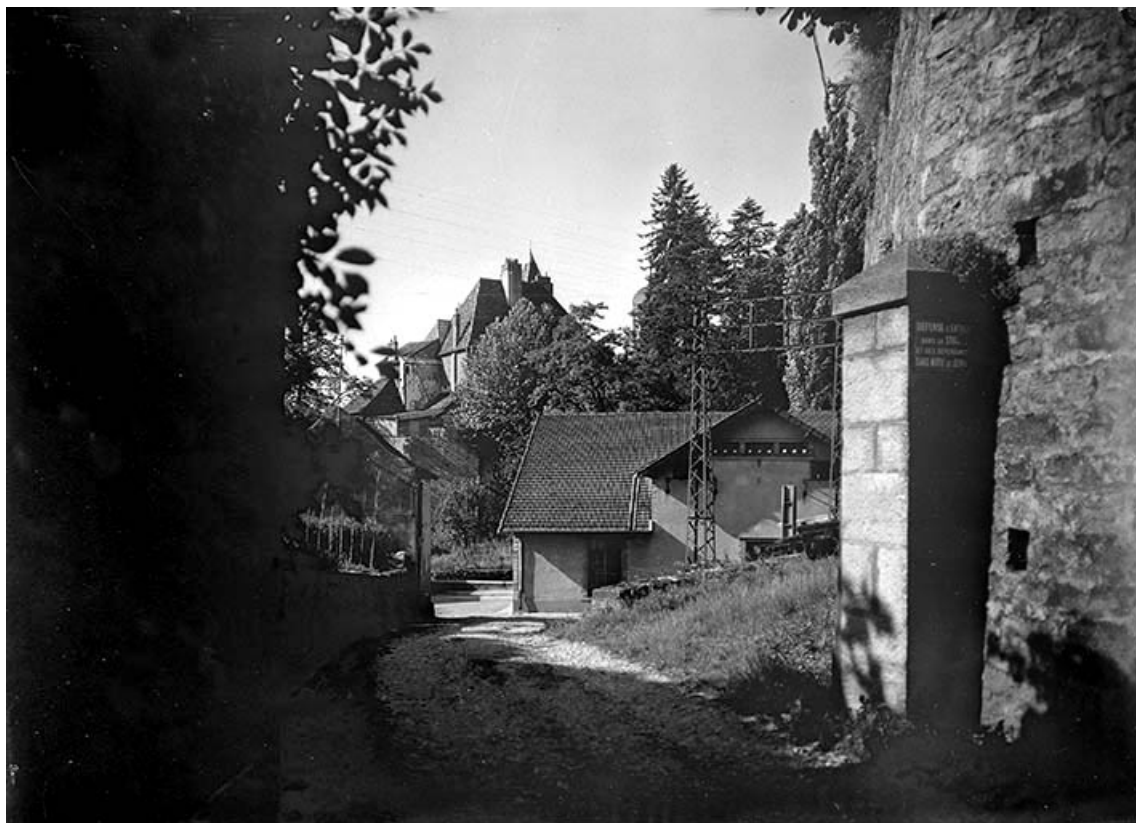
La centrale hydroélectrique depuis l'entrée.