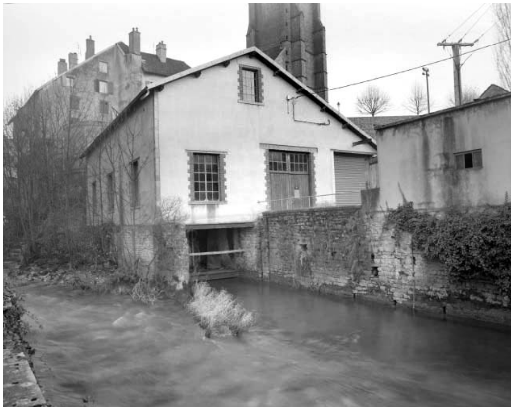
La salle des machines et la remise depuis la rive droite.