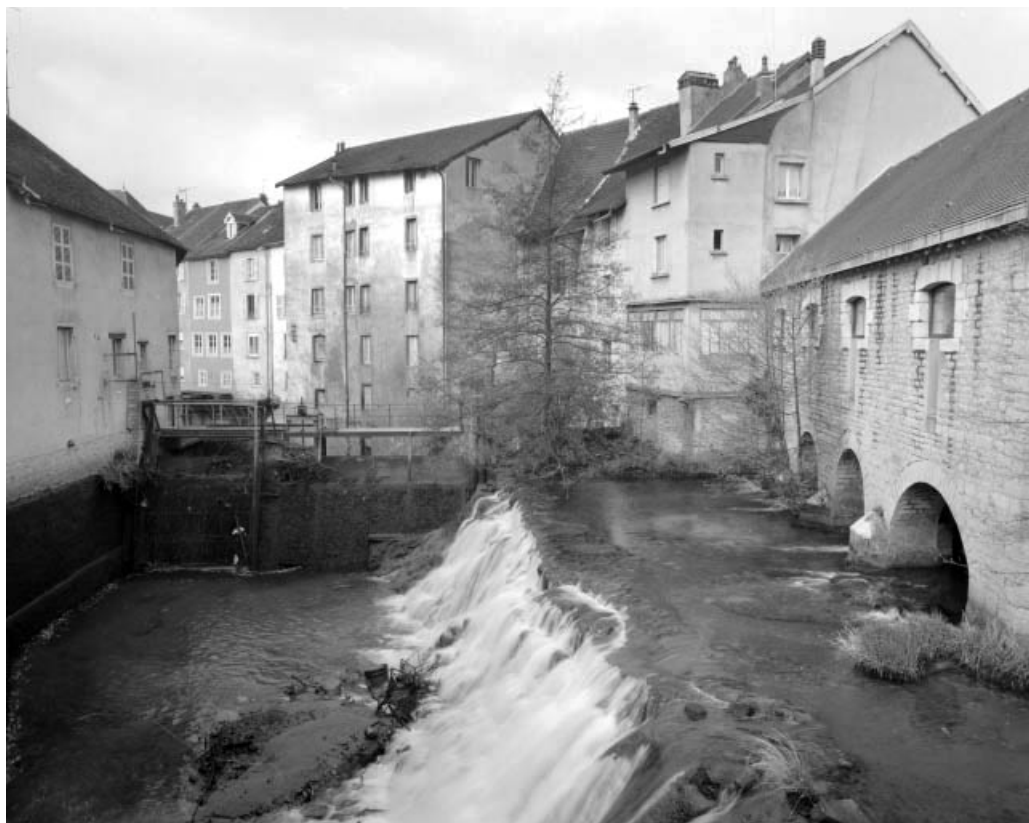
Le bassin de retenue vidé. 39, Arbois rue des Familiers