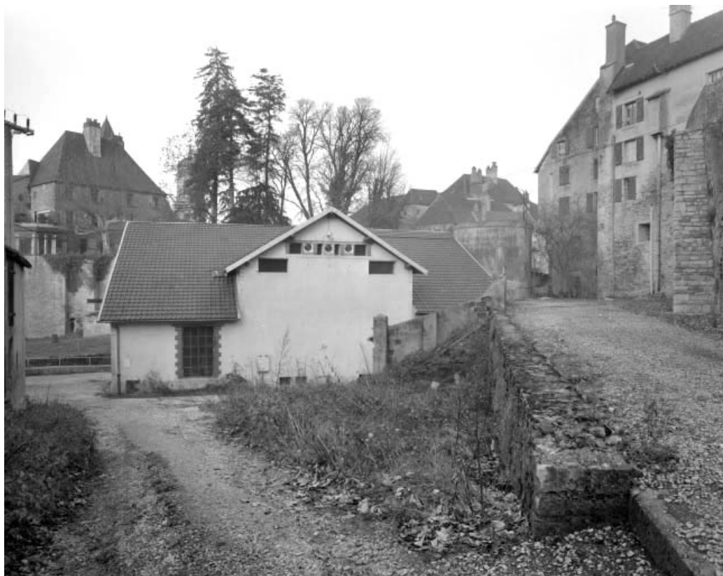
La centrale vue depuis l'entrée.