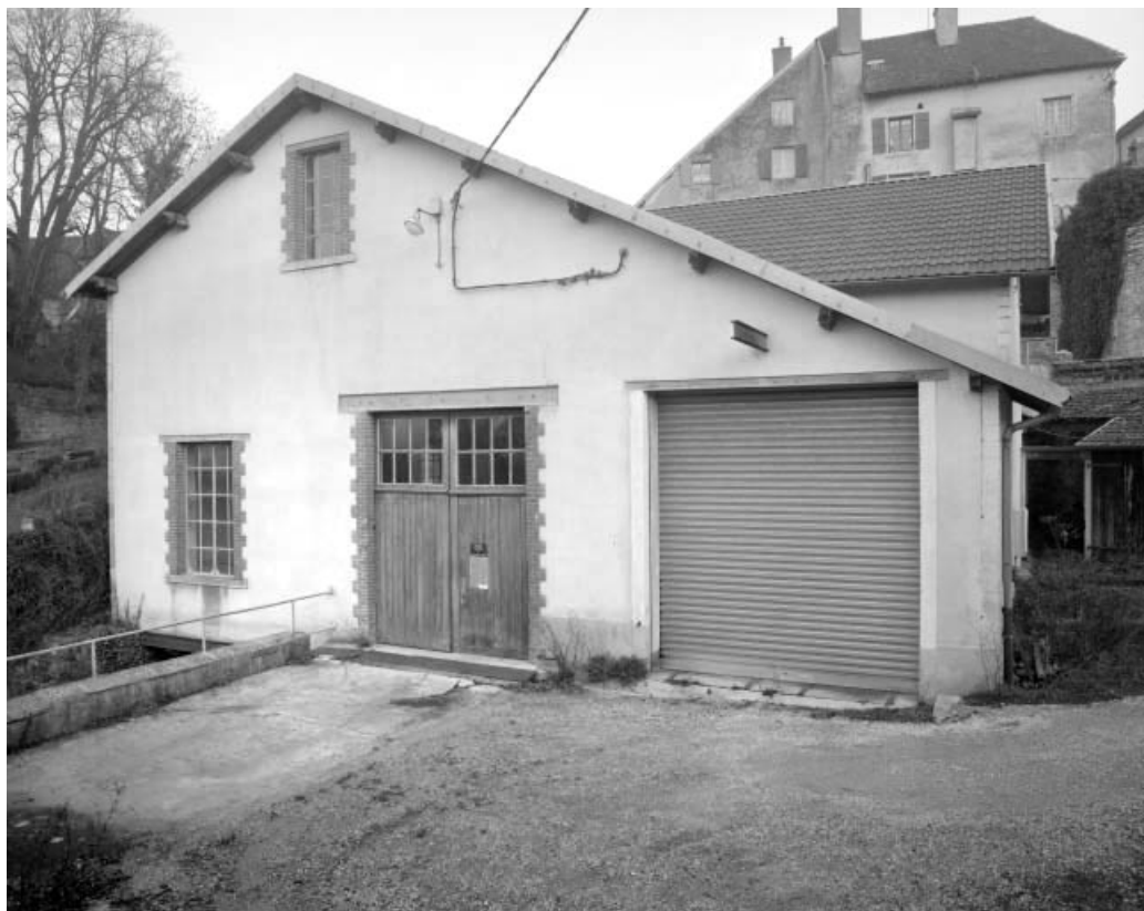
Façade antérieure depuis le sud-ouest.