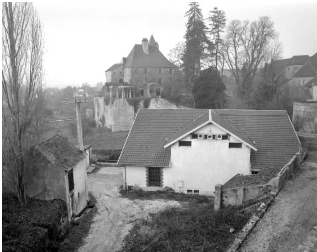
Vue plongeante sur la centrale.