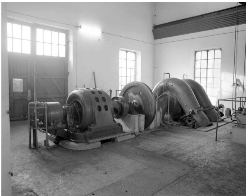
Groupe turbine alternateur n° 1.