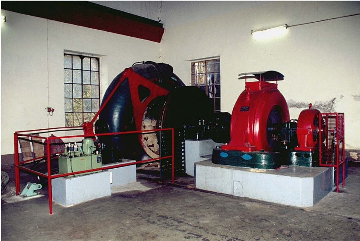
Groupe turbine alternateur n° 3.