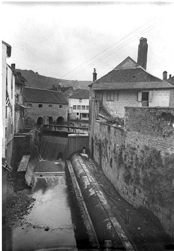
Bassin de retenue et conduite forcée depuis le pont.