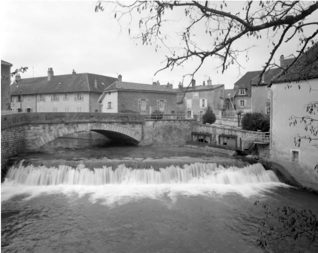
Chute d'eau sur la Cuisance.