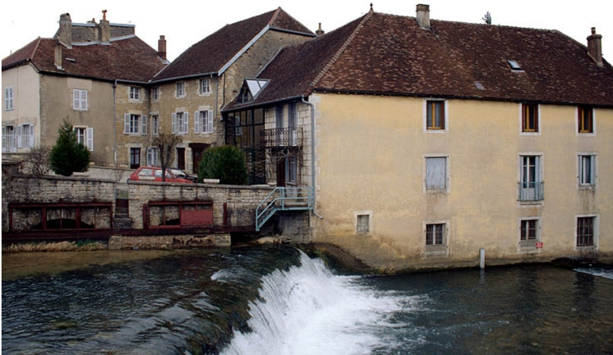
Vue d'ensemble depuis la rive droite.