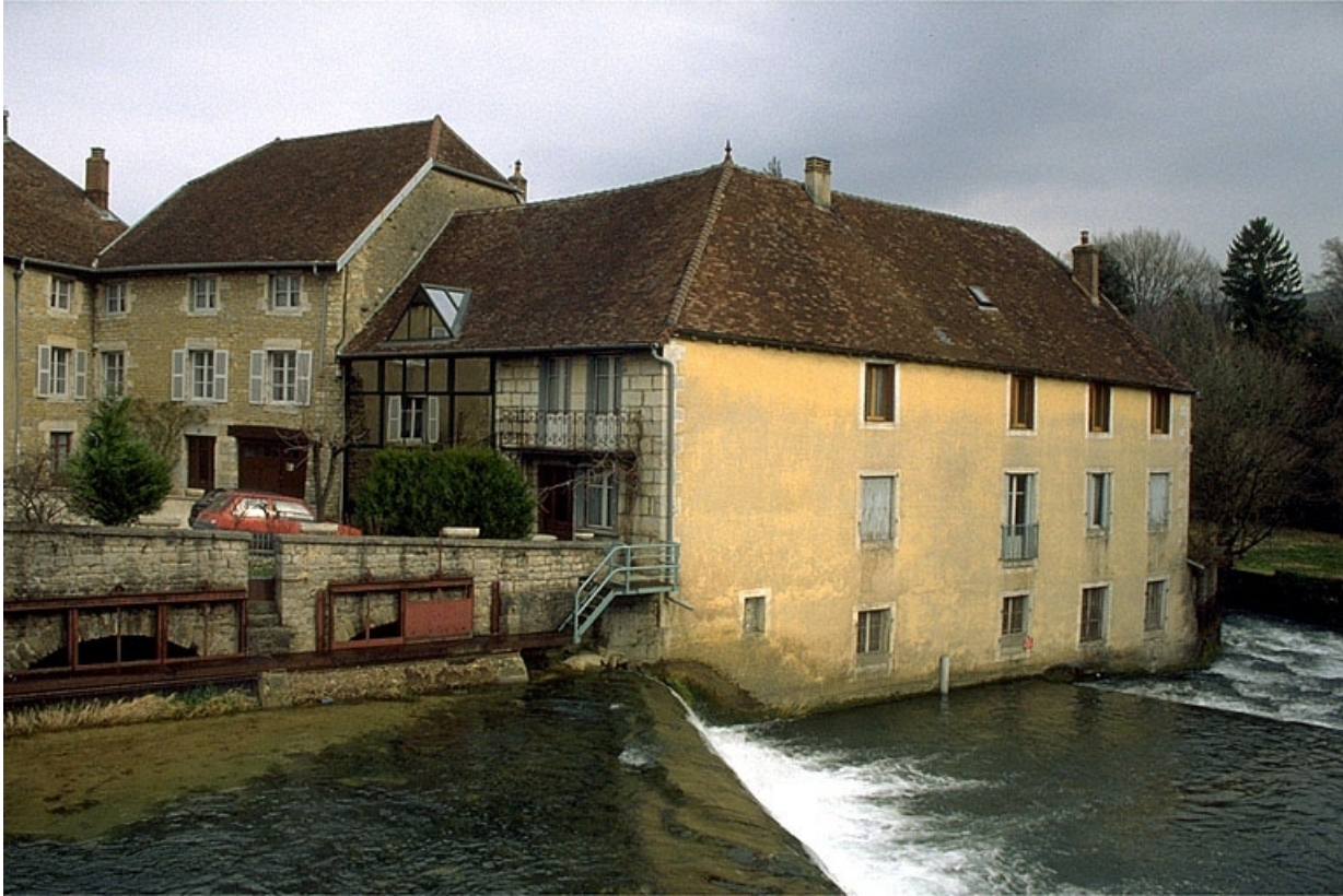
Vue d'ensemble depuis le sud-ouest.