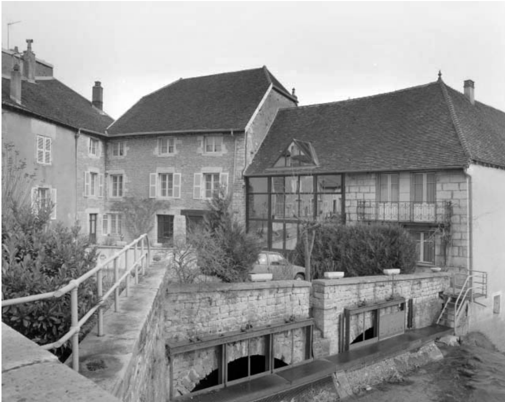
Logement patronal et atelier de fabrication de trois quarts droit.