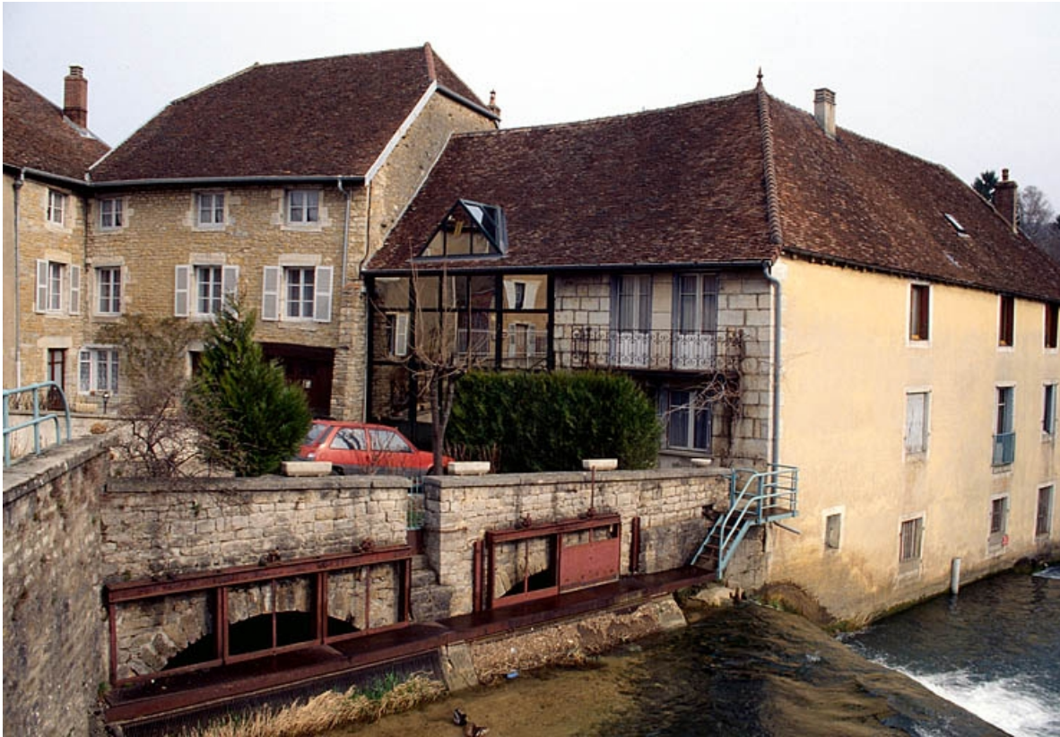
Prises d'eau de l'ancien moulin et atelier de fabrication depuis le pont.