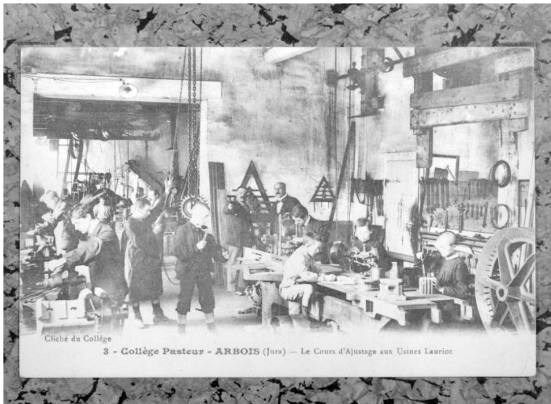
Collège Pasteur - Arbois (Jura) - Le cours d'ajustage aux usines Laurioz.