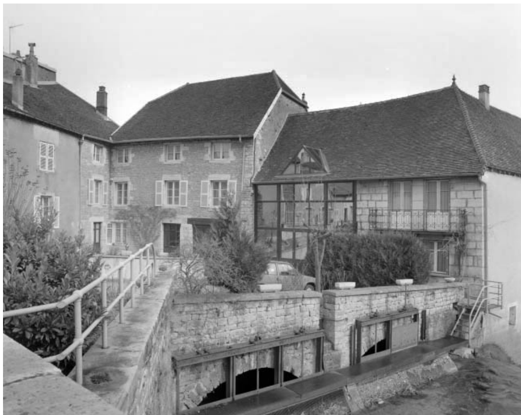
Logement patronal et atelier de fabrication de trois quarts droit.