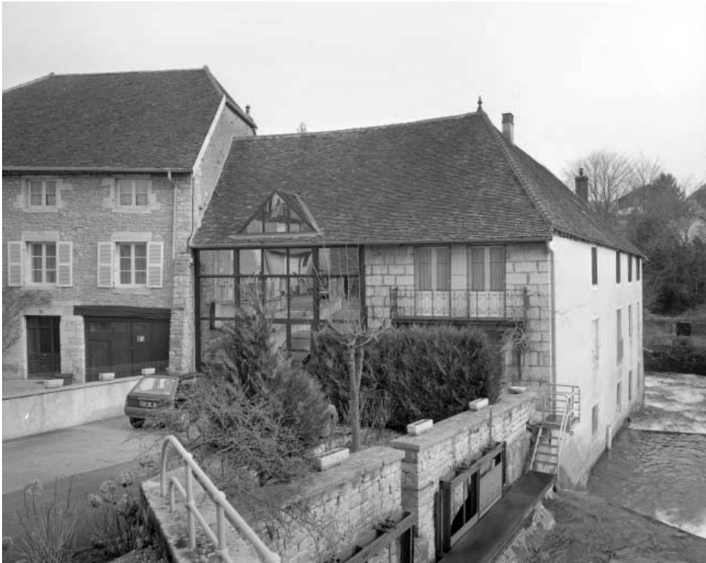
Atelier de fabrication : façades sur cour et sur rivière.