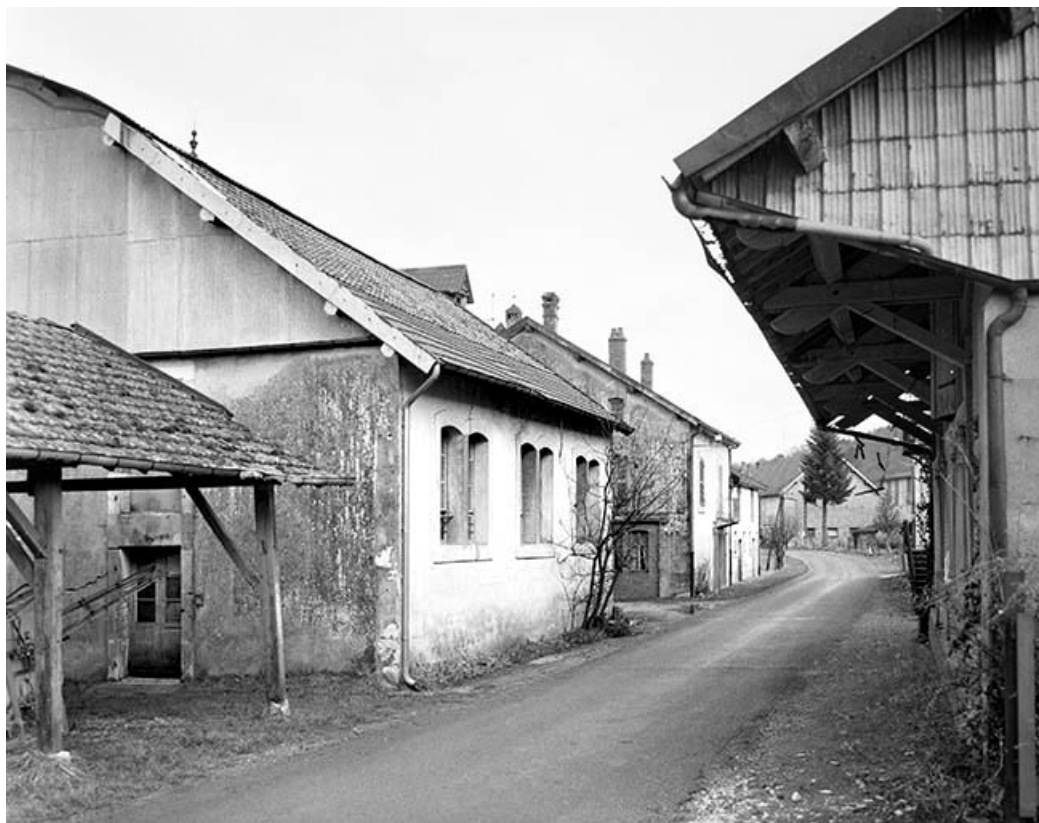
Vue en enfilade depuis la route. De gauche à droite : atelier de fabrication, bureau, logements et parties agricoles. 39, Champagne-sur-Loue, lieudit : Moulin Neuf