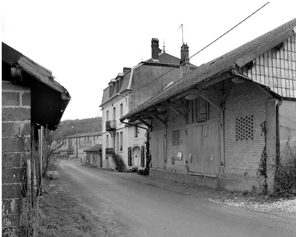
Vue en enfilade depuis la route. De gauche à droite : logement patronal, logement d'ouvriers et entrepôt industriel. 39, Champagne-sur-Loue, lieudit : Moulin Neuf