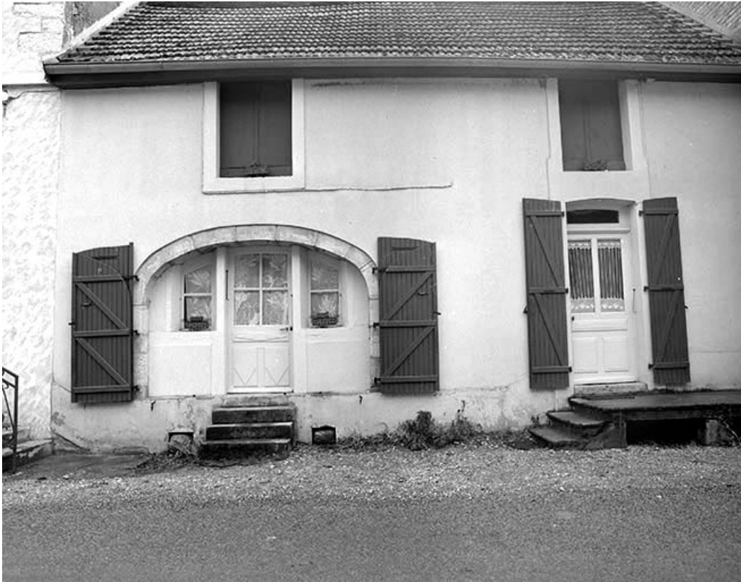
Façade antérieure du logement d'ouvriers.

39, Champagne-sur-Loue, lieudit : Moulin Neuf