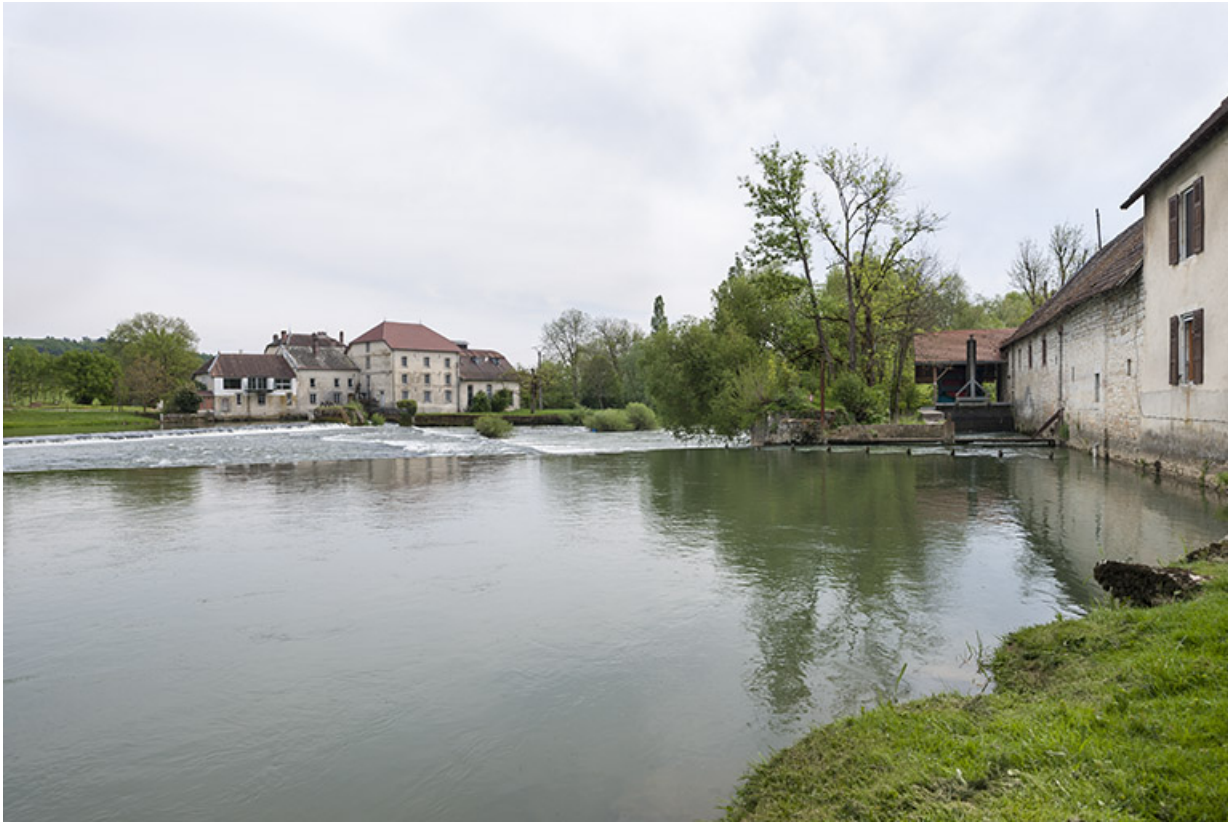
Vue d'ensemble depuis la rive droite.

39, Champagne-sur-Loue, lieudit : Moulin Neuf