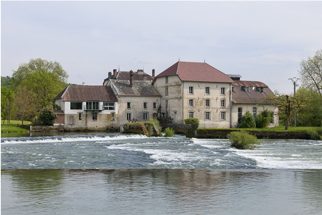
Façades sur la Loue depuis la rive droite.

39, Champagne-sur-Loue, lieudit : Moulin Neuf