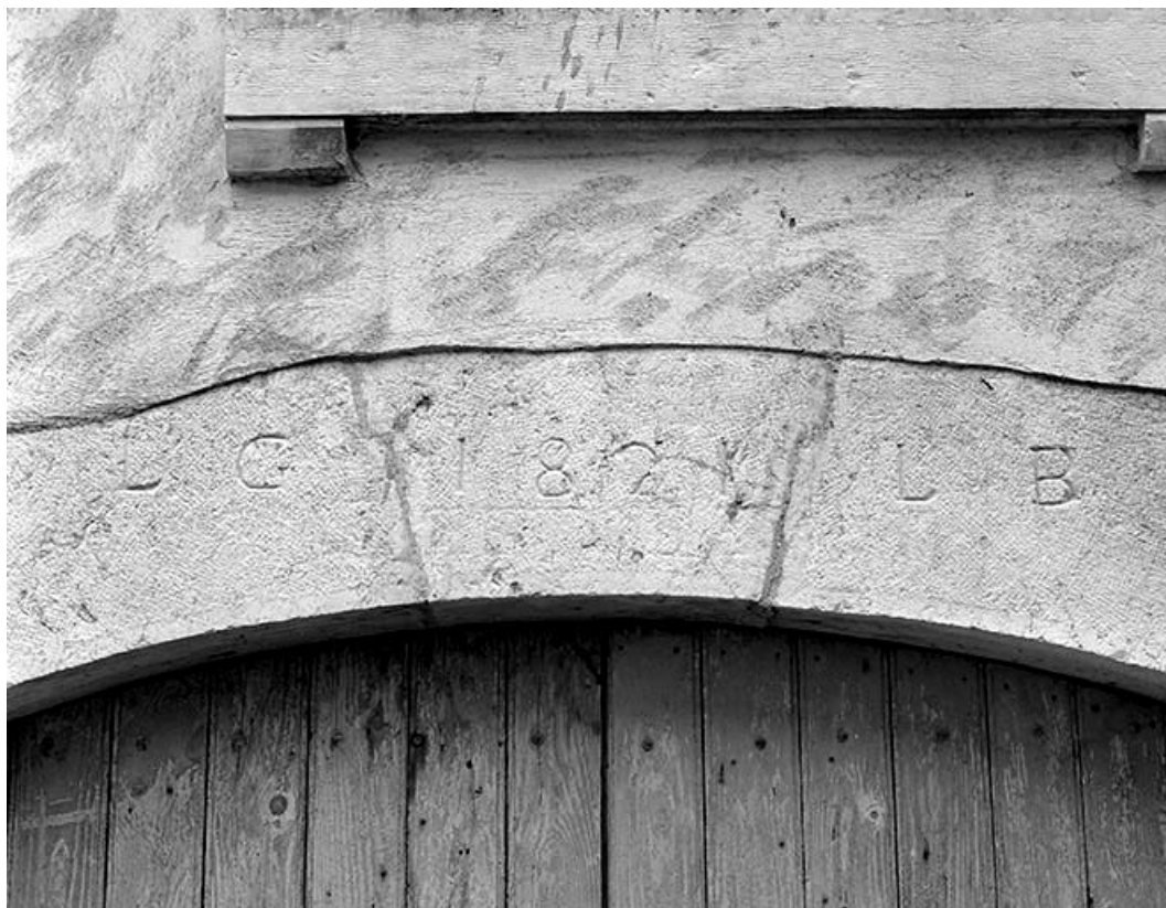
Façade antérieure du logement patronal : détail d'un arc.

39, Champagne-sur-Loue, lieudit : Moulin Neuf