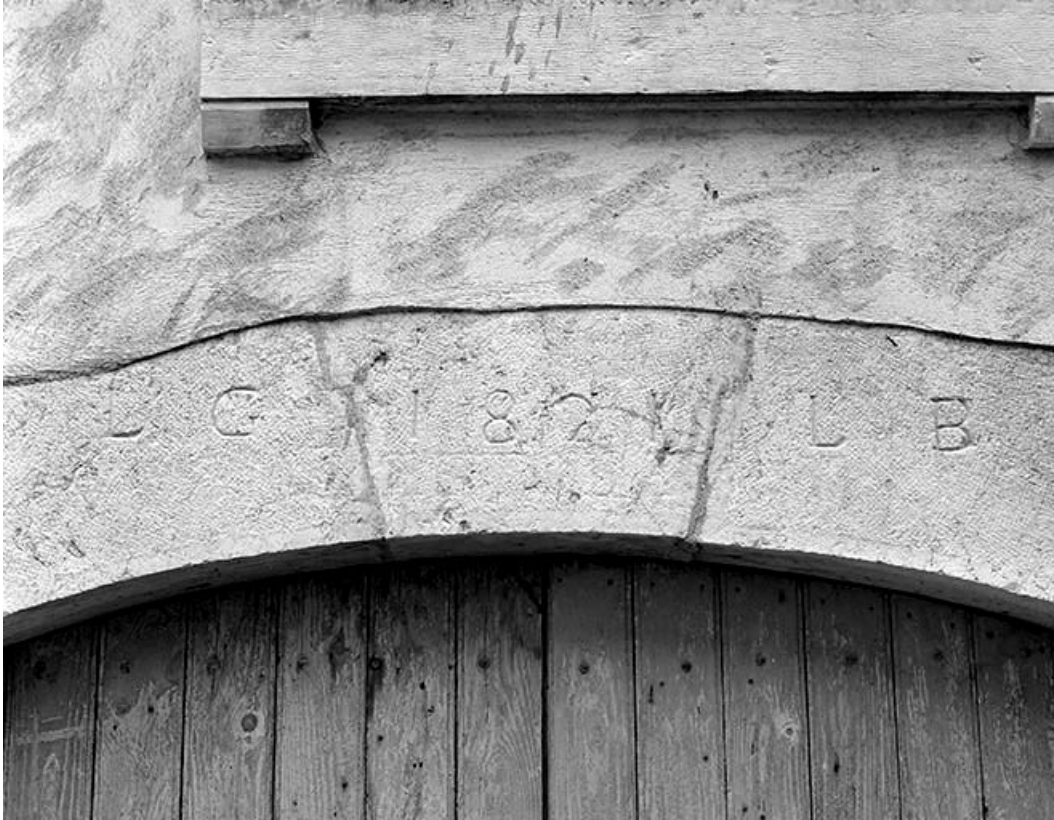
Façade antérieure du logement patronal : détail d'un arc.

39, Champagne-sur-Loue, lieudit : Moulin Neuf