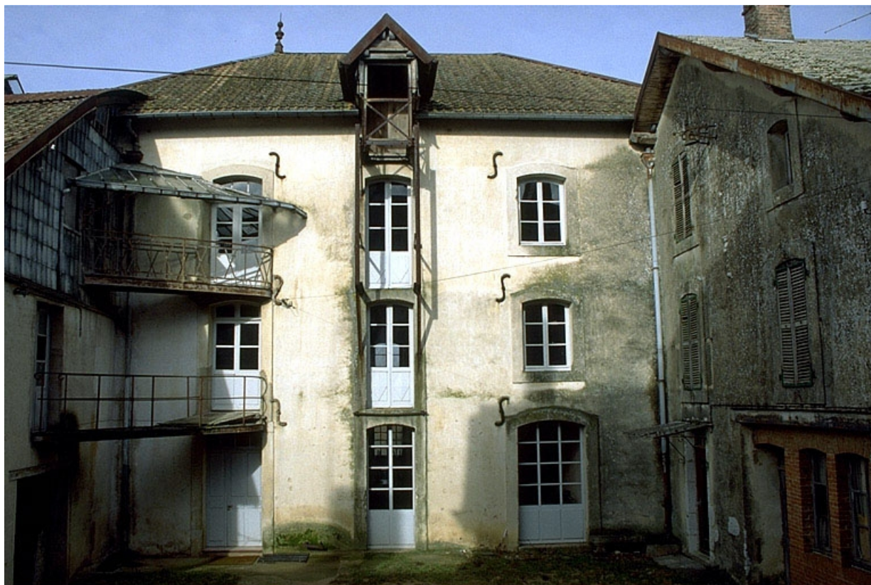
Façade antérieure de l'atelier de fabrication. 39, Champagne-sur-Loue, lieudit : Moulin Neuf