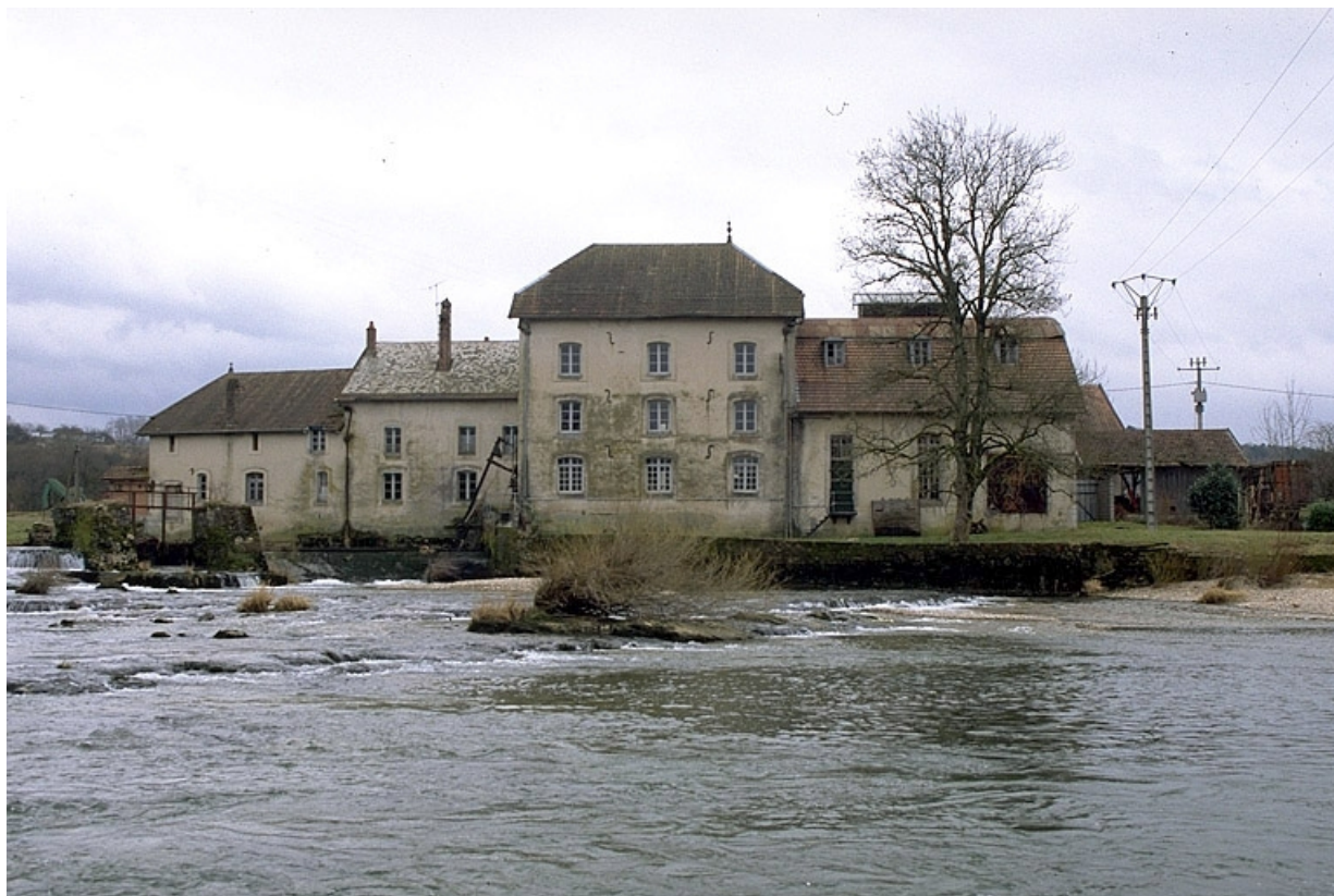
Vue d'ensemble depuis le nord-ouest.