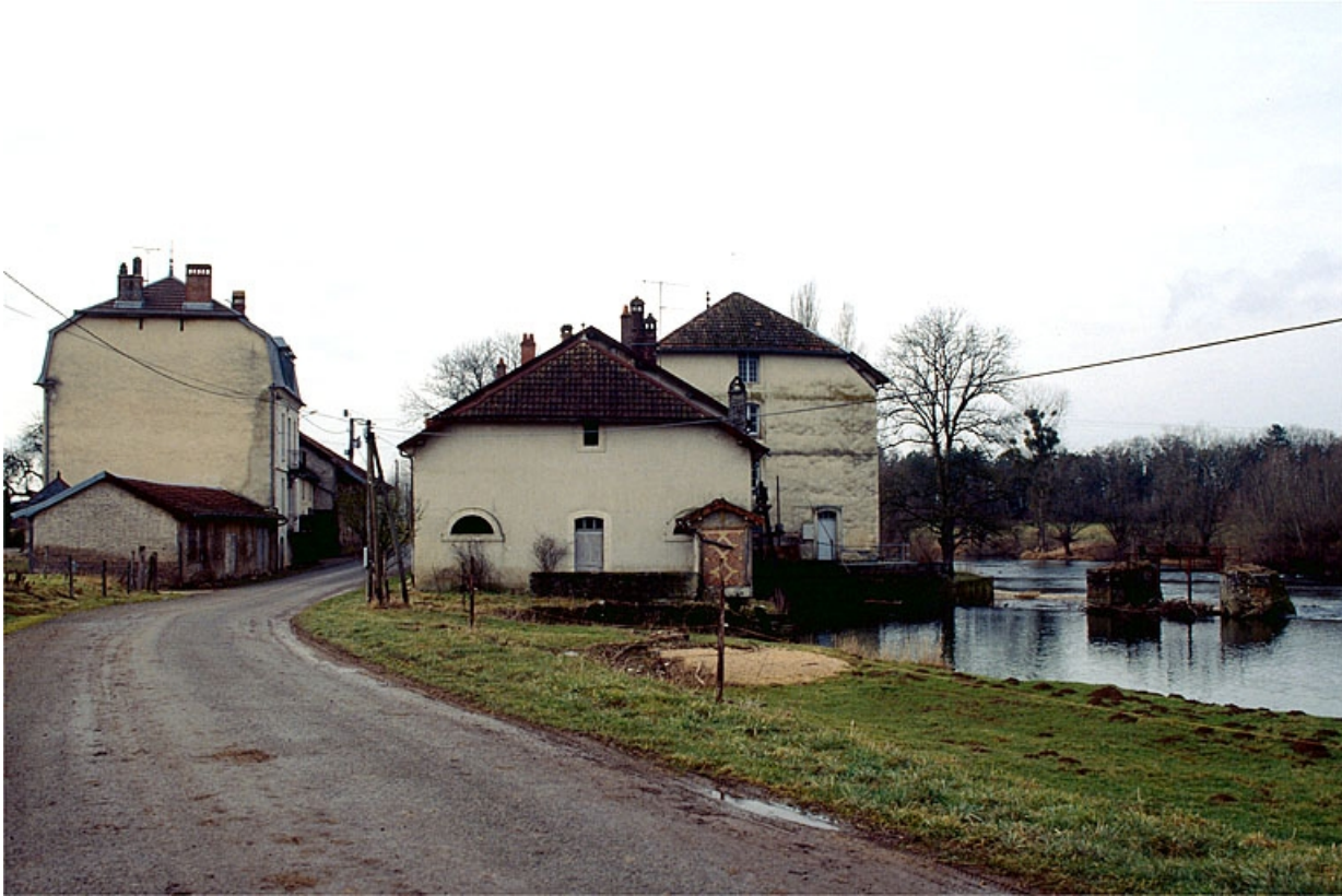
Vue d'ensemble depuis la route départementale.

39, Champagne-sur-Loue, lieudit : Moulin Neuf