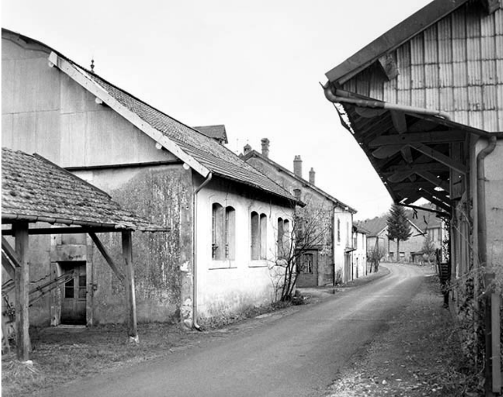
Vue en enfilade depuis la route. De gauche à droite : atelier de fabrication, bureau, logements et parties agricoles.

39, Champagne-sur-Loue, lieudit : Moulin Neuf