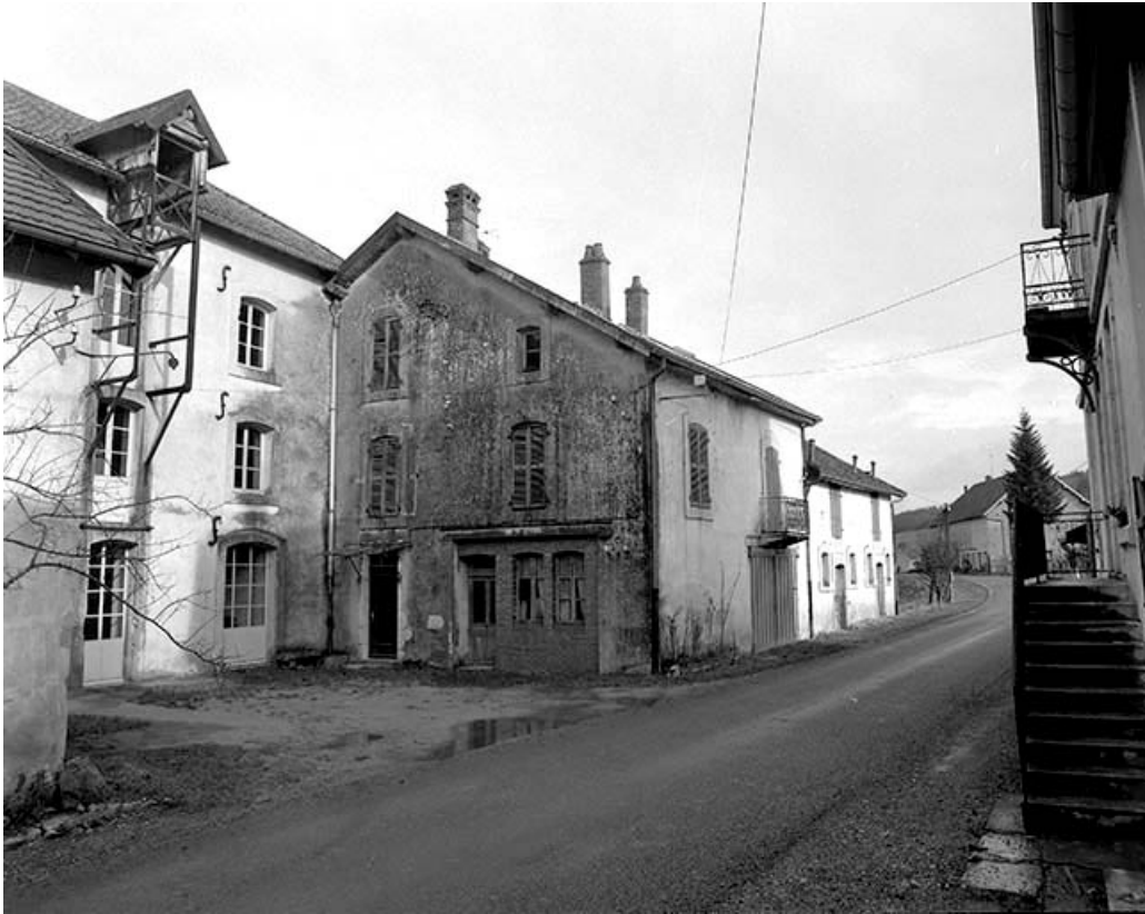
Façades sur cour de l'atelier de fabrication et du bâtiment des logements et bureau.

39, Champagne-sur-Loue, lieudit : Moulin Neuf