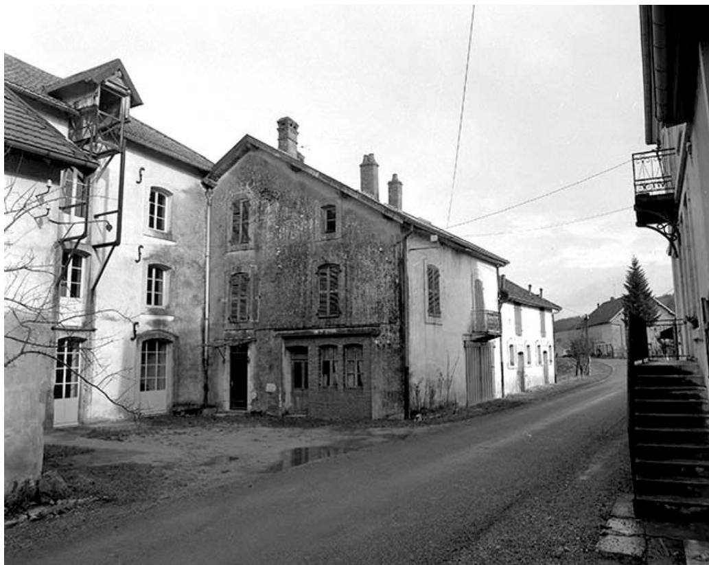
Façades sur cour de l'atelier de fabrication et du bâtiment des logements et bureau.

39, Champagne-sur-Loue, lieudit : Moulin Neuf