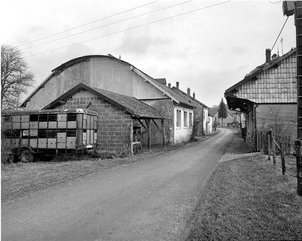
Ateliers de fabrication depuis le sud.

39, Champagne-sur-Loue, lieudit : Moulin Neuf