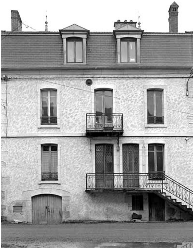
Façade antérieure du logement patronal.

39, Champagne-sur-Loue, lieudit : Moulin Neuf