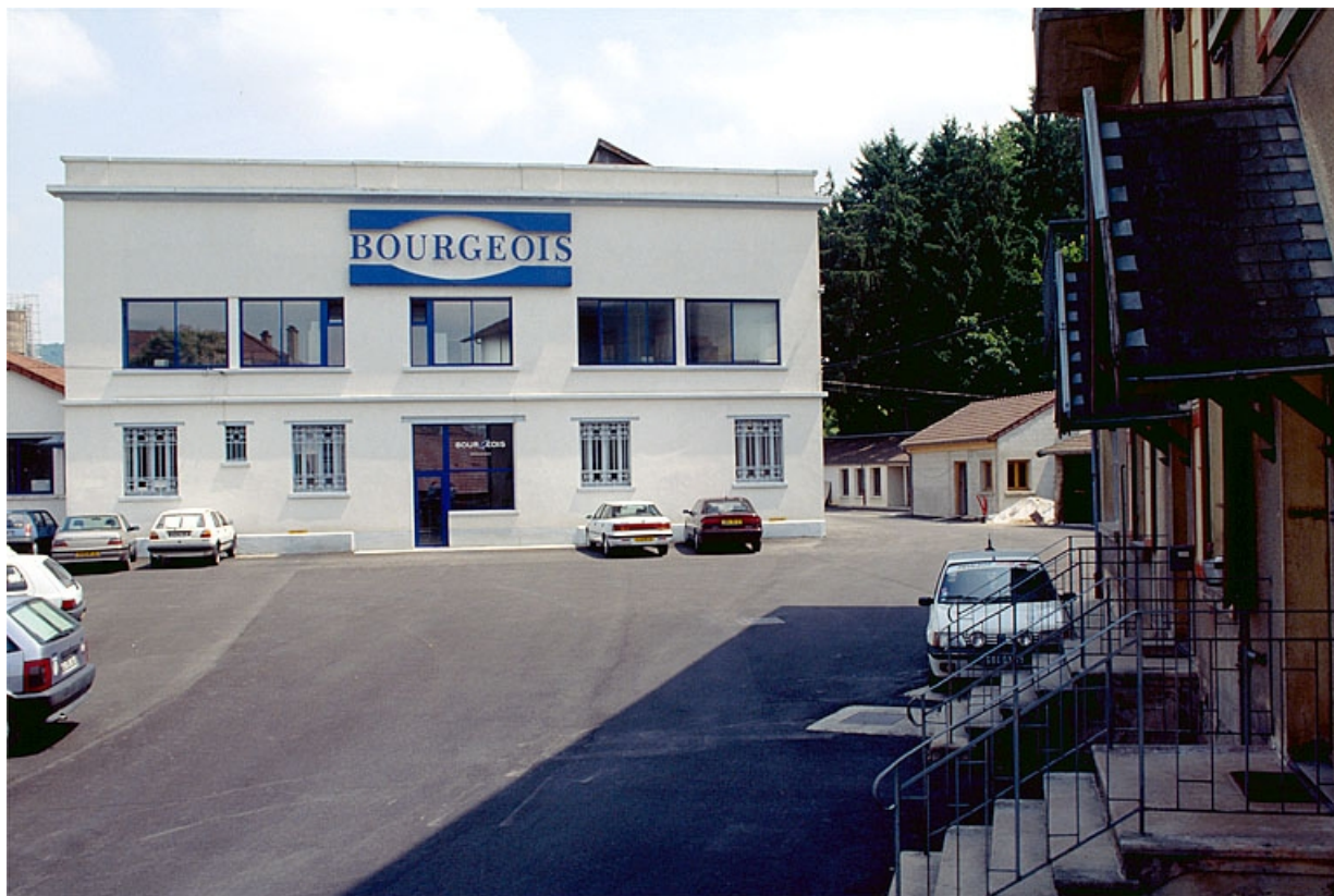
Vue d'ensemble depuis l'entrée : la façade du bureau.

39, Lons-le-Saunier, 2 rue des Mouillères