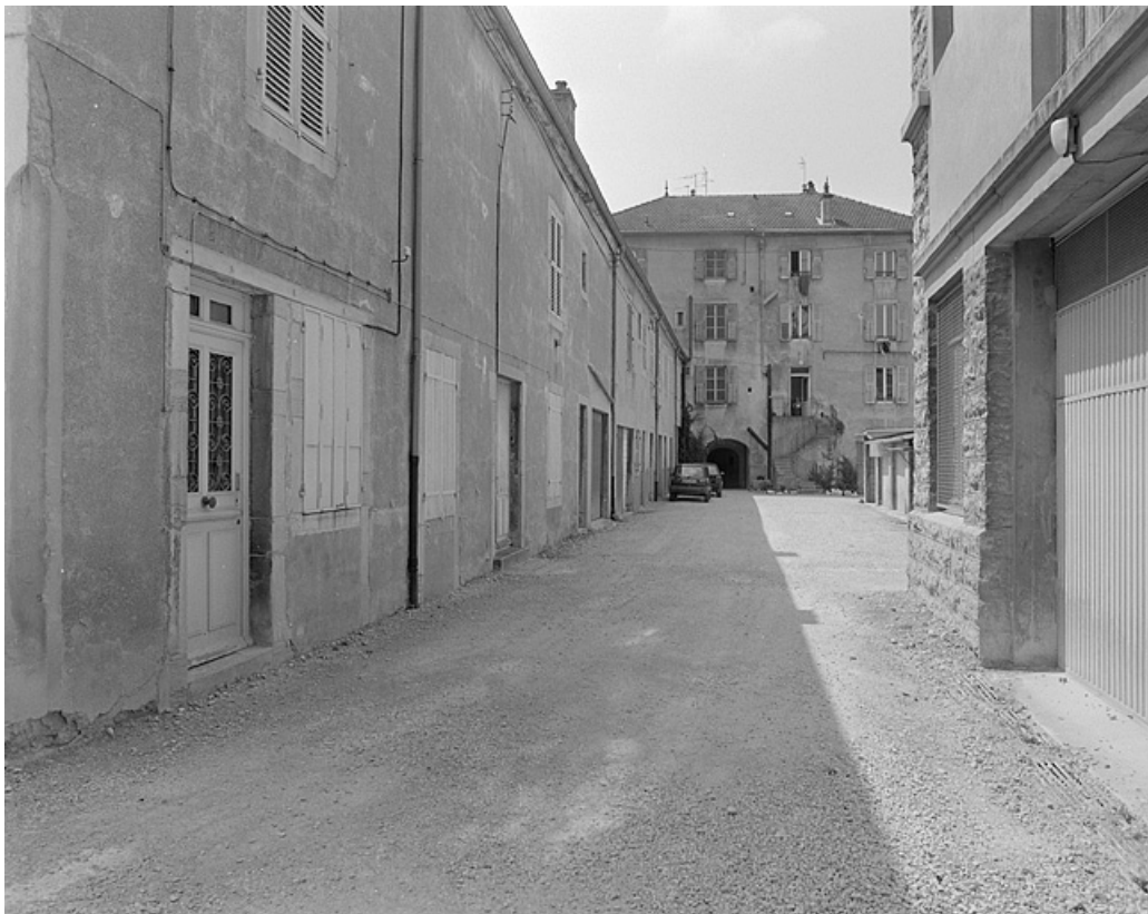
Bureau, entrepôt industriel et logement patronal.

39, Lons-le-Saunier, 10, 12 rue des Tanneurs