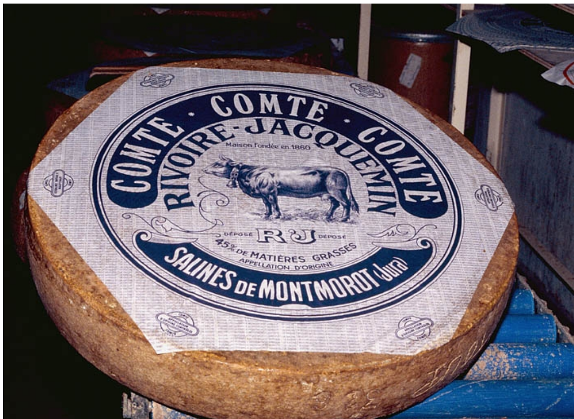
Meule de comté étiquetée.