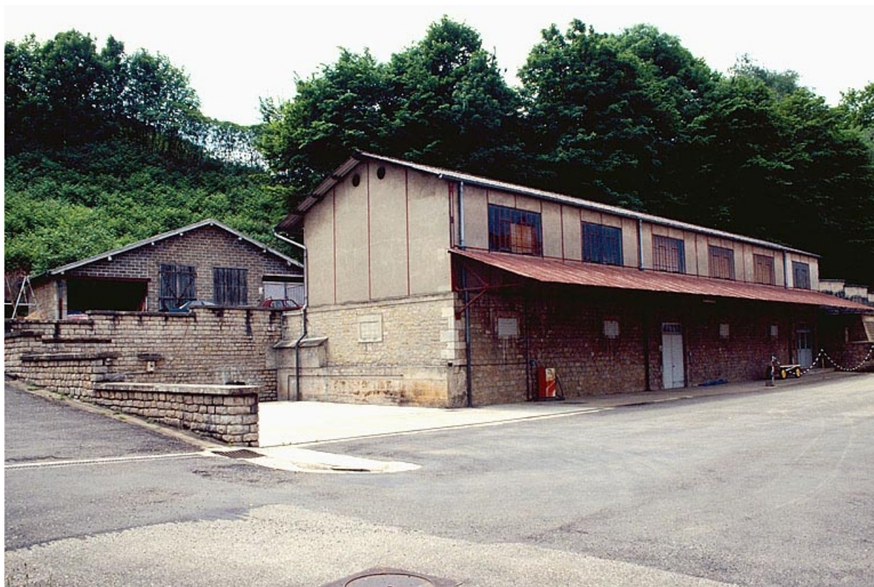
Atelier de conditionnement (1933).