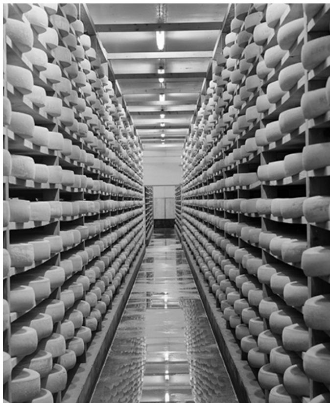
Travée d'une pièce d'affinage.