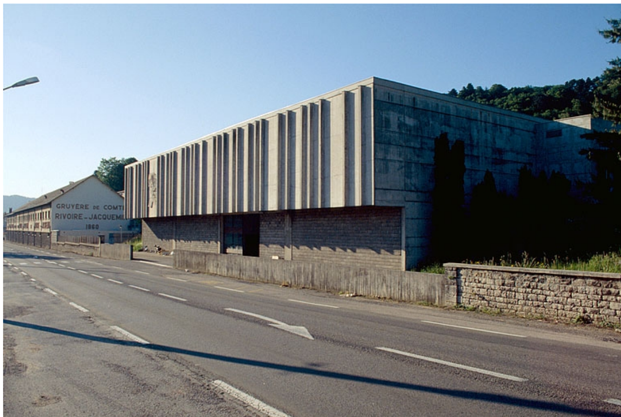
Pièce d'affinage (1996).