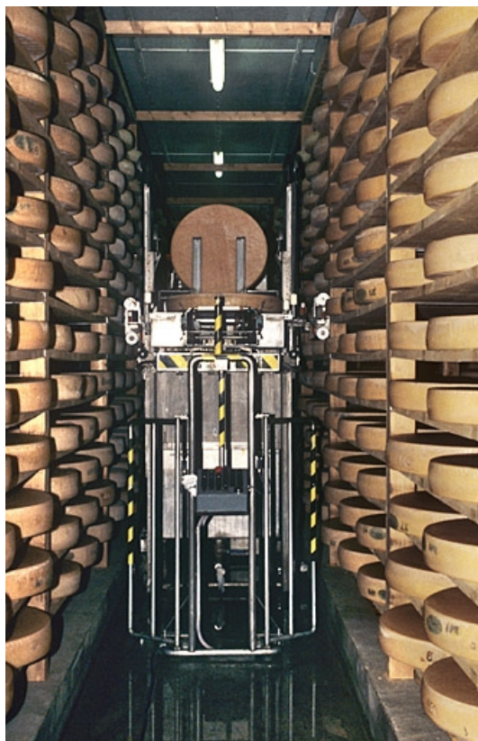
Robot de retournement et de salage des meules de comté.