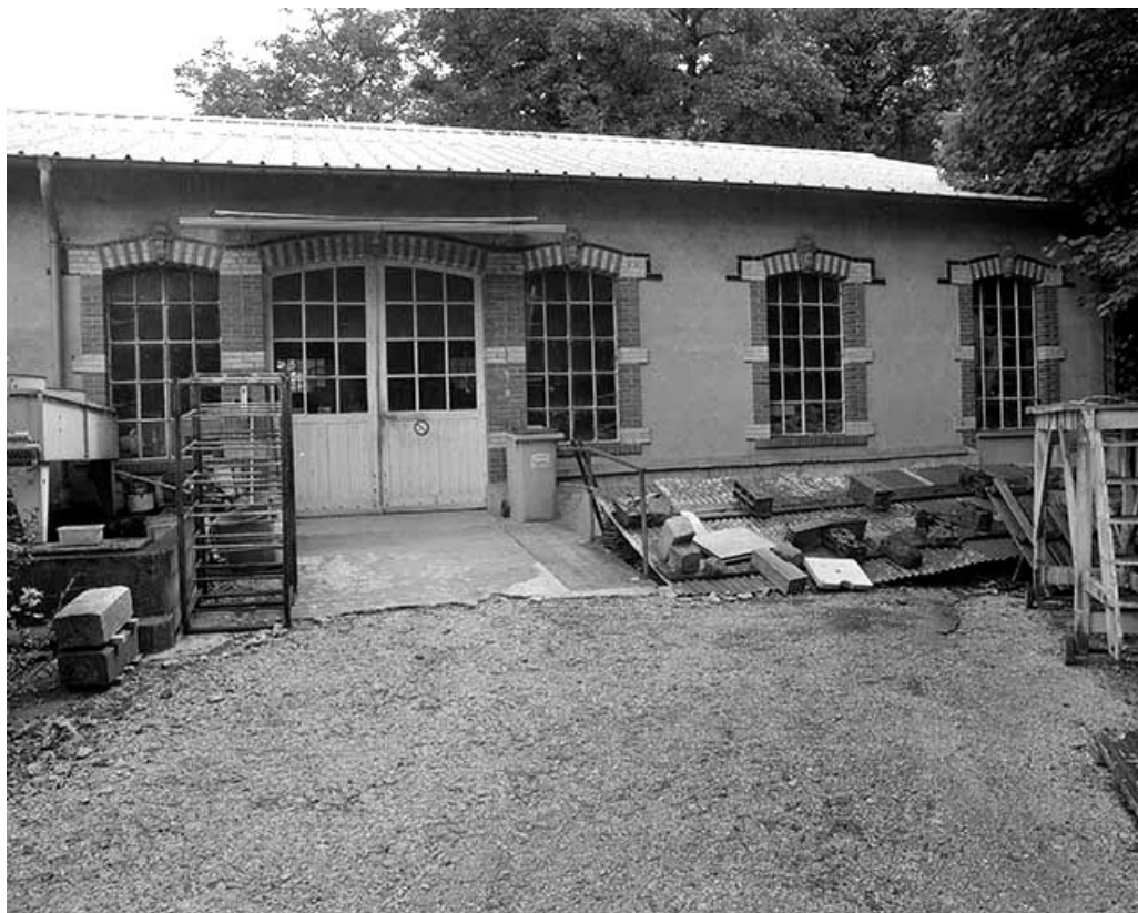
Atelier de fabrication (menuiserie).