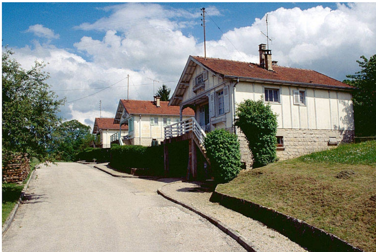
Logements d'ouvriers depuis l'ouest.