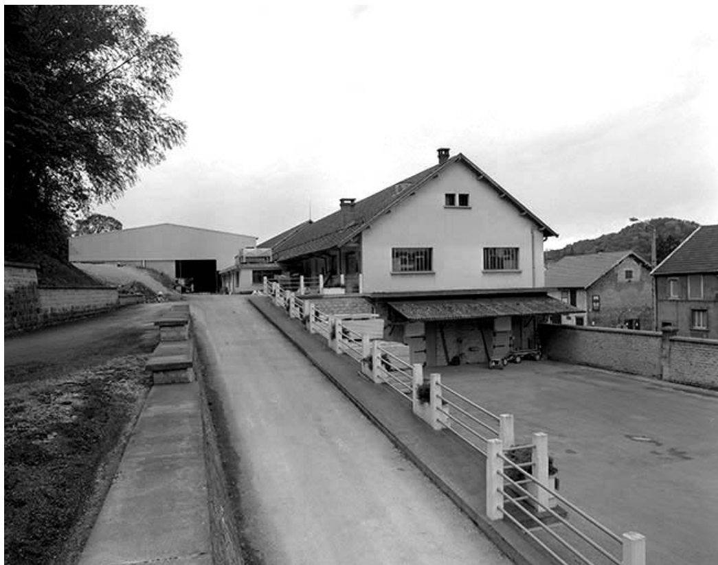
Pièces d'affinage depuis l'est.