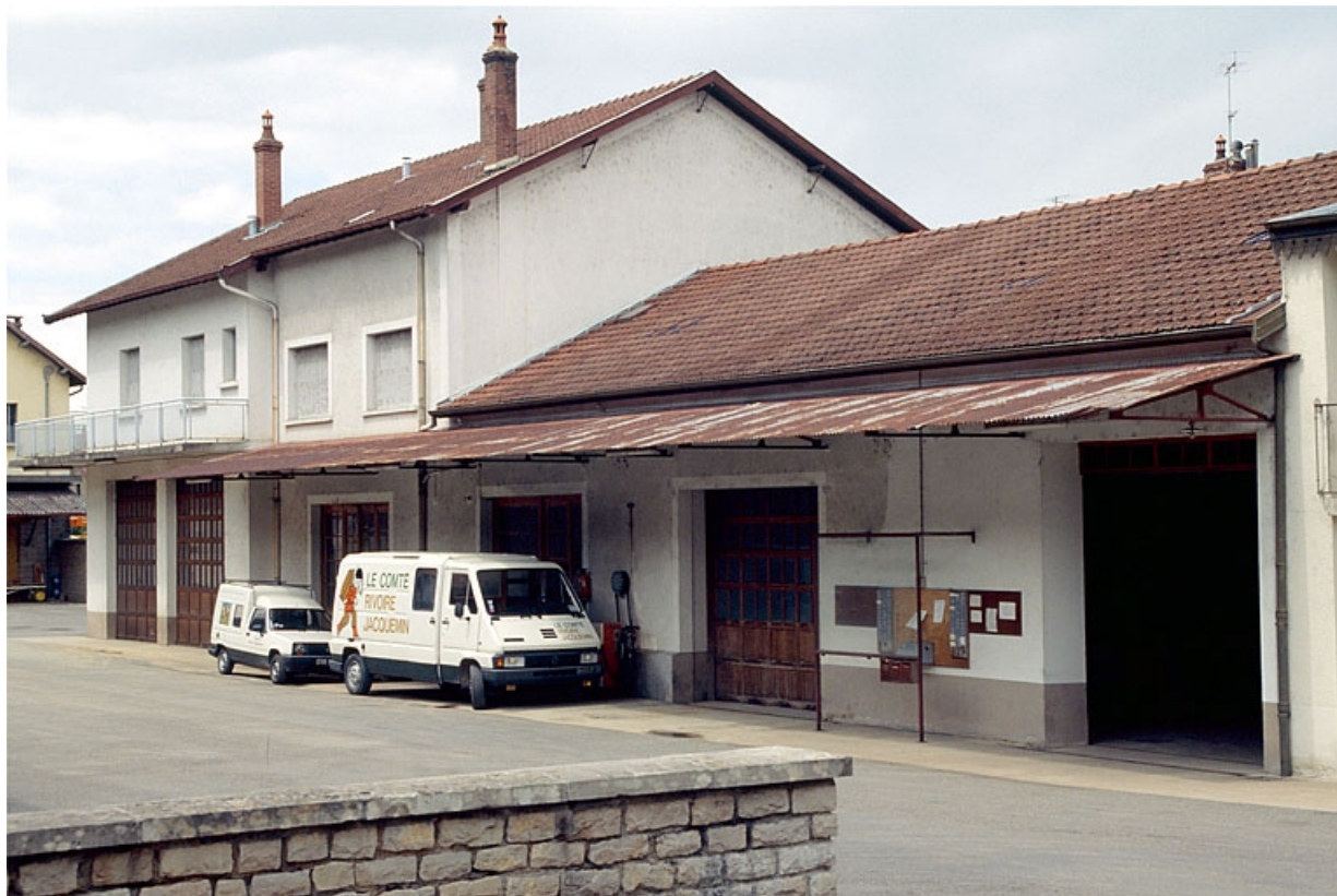
Atelier de réparation, logement et remise.