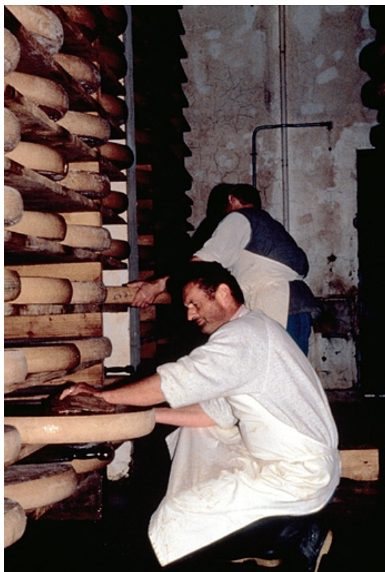
Salage et retournement manuel des meules de comté.