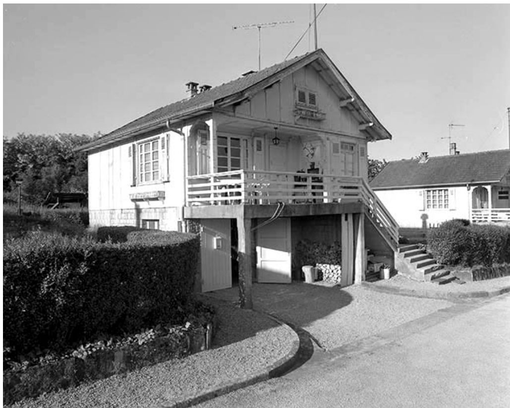
Logement d'ouvriers vu de trois quarts gauche.