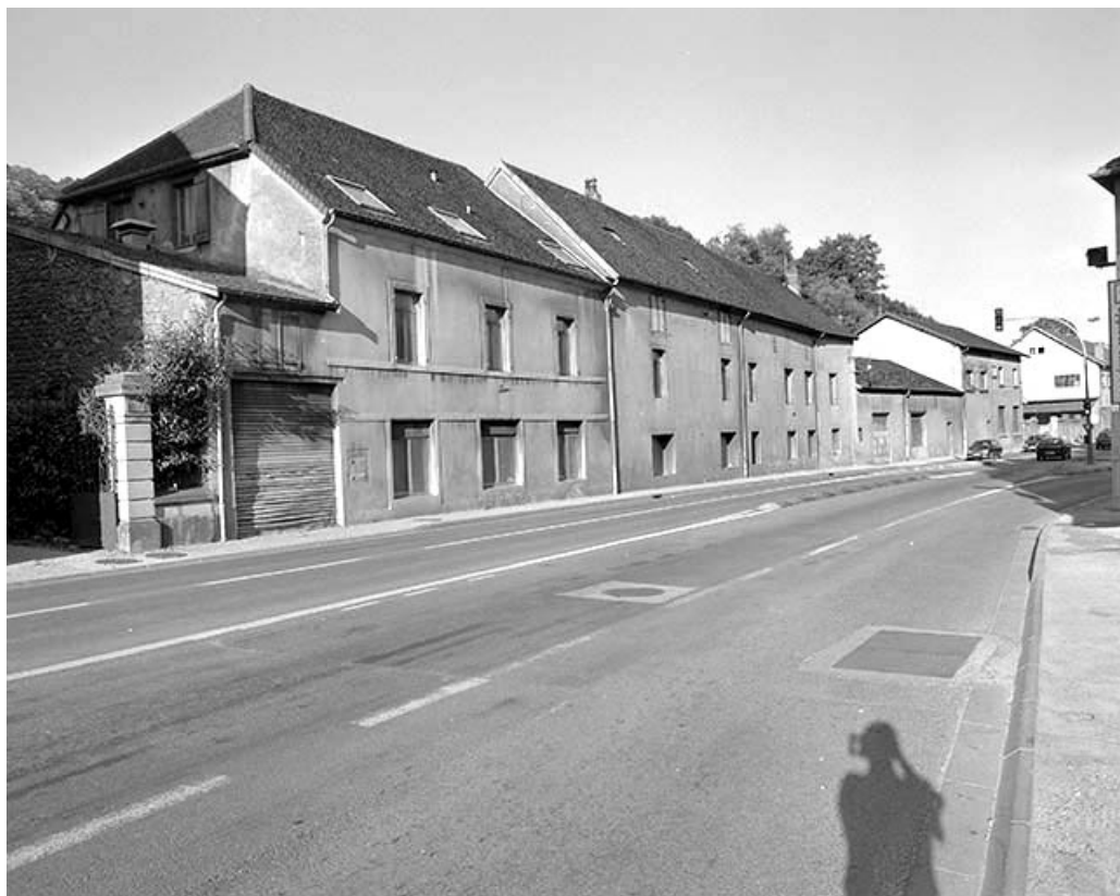
Bureau, remise, atelier de réparation et logement depuis le nord-est.