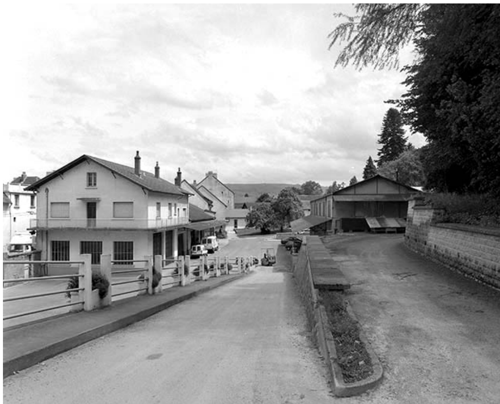
Atelier de réparation, remise, bureau et atelier de conditionnement depuis l'ouest.