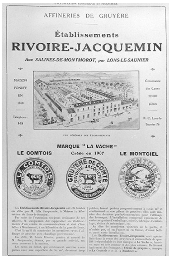
[Vue générale des établissements Rivoire-Jacquemin], milieu des années 1920.