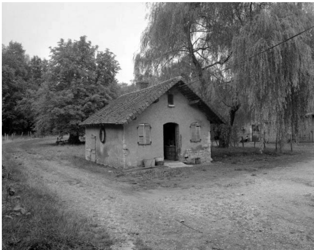
Four à pain.