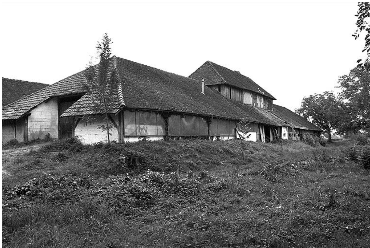
Pièce de séchage surmontée de son logement d'ouvriers.