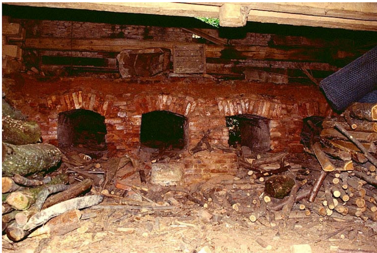
Gueules de charge du four.