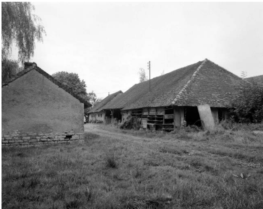
Atelier de fabrication depuis le nord.