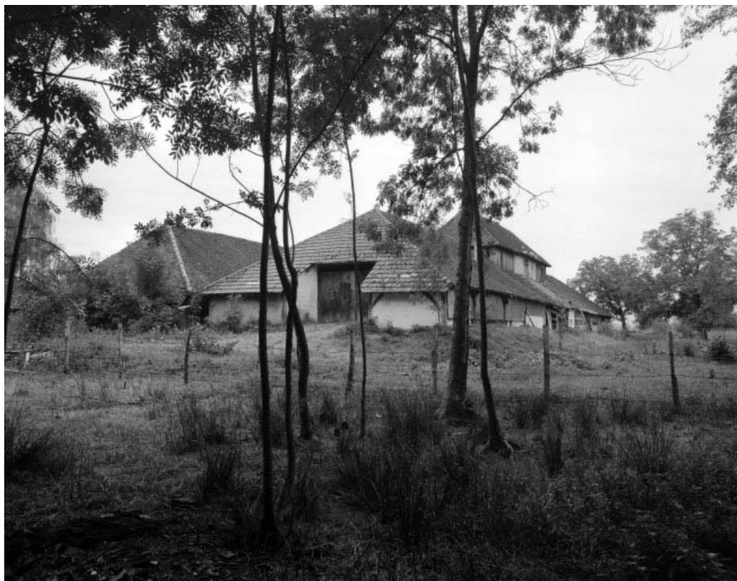
Vue d'ensemble depuis le nord-ouest.