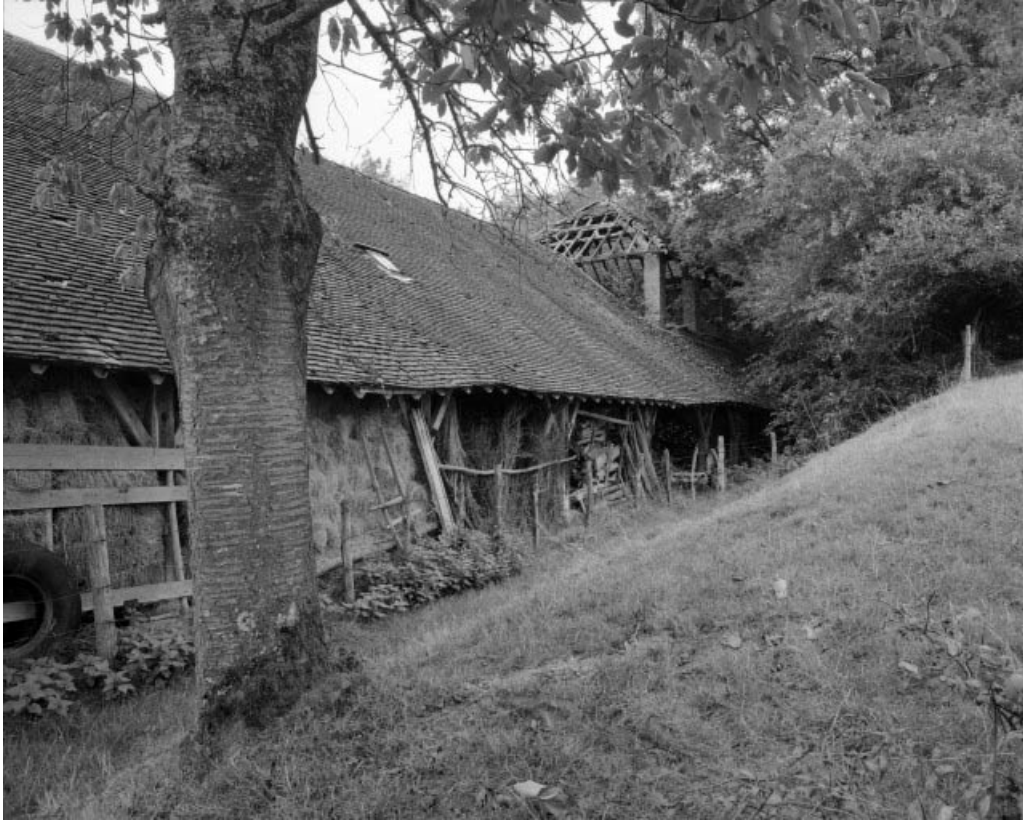
Pièce de séchage et four industriel depuis le sud-est.