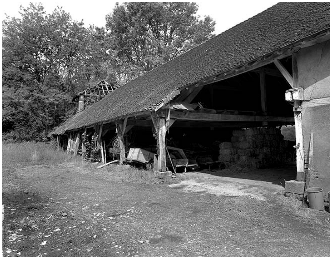
Pièce de séchage.