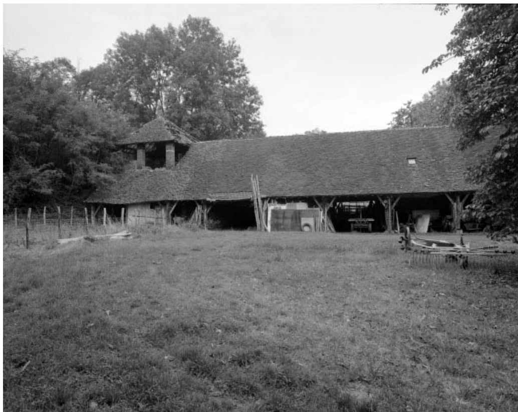
Four industriel et pièce de séchage.