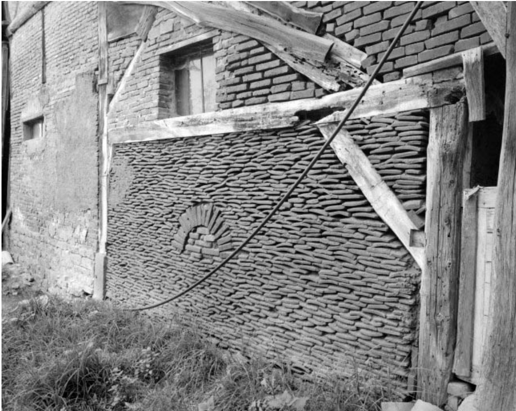
Façade ouest de l'écurie. Détail du pan-de-bois hourdé de tuiles et briques.