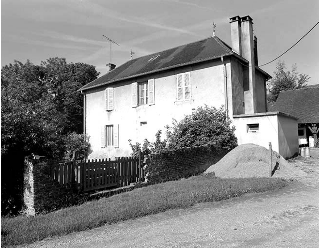
Façade postérieure du logement patronal.