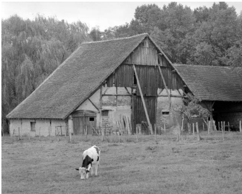
Remise, écurie et fenil depuis le sud-est.