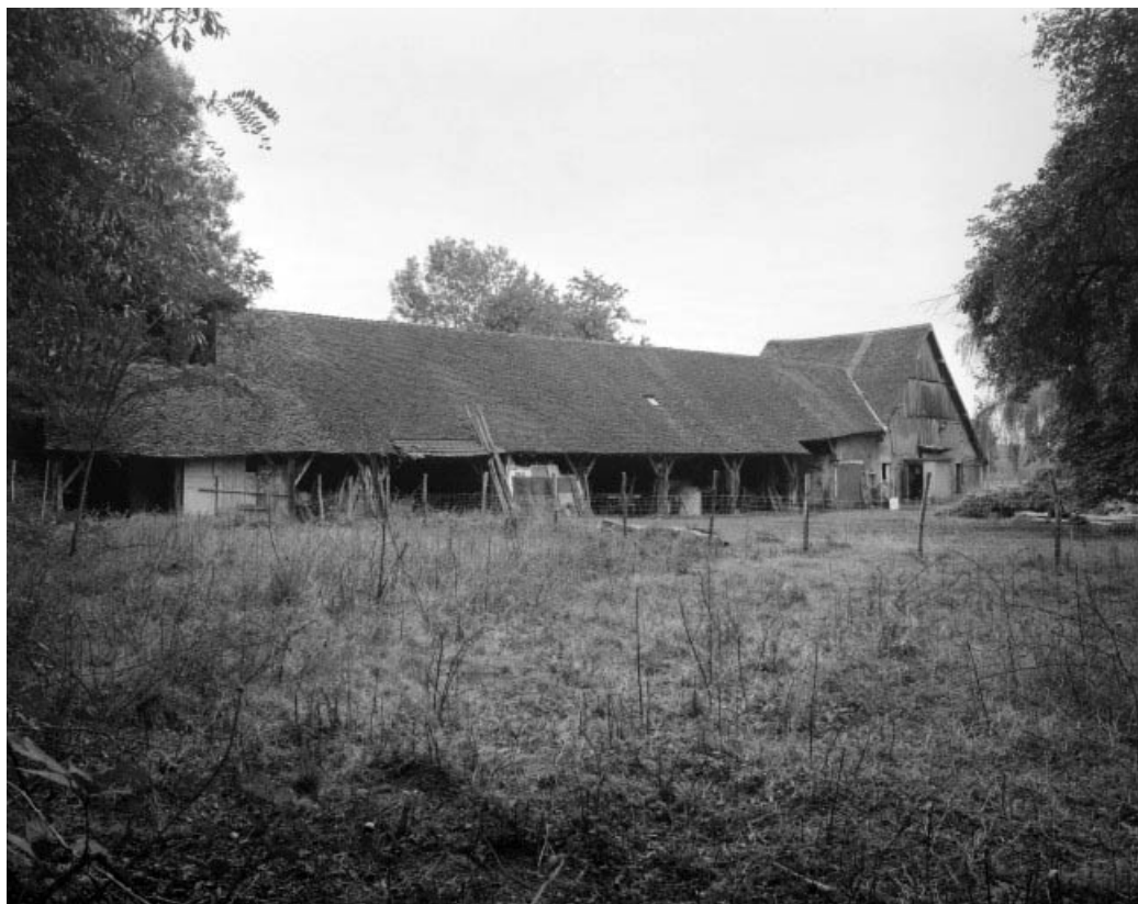
Pièce de séchage depuis le nord-ouest.