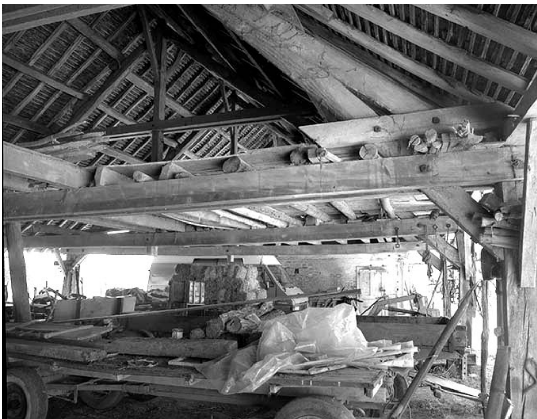
Vue intérieure de la pièce de séchage.