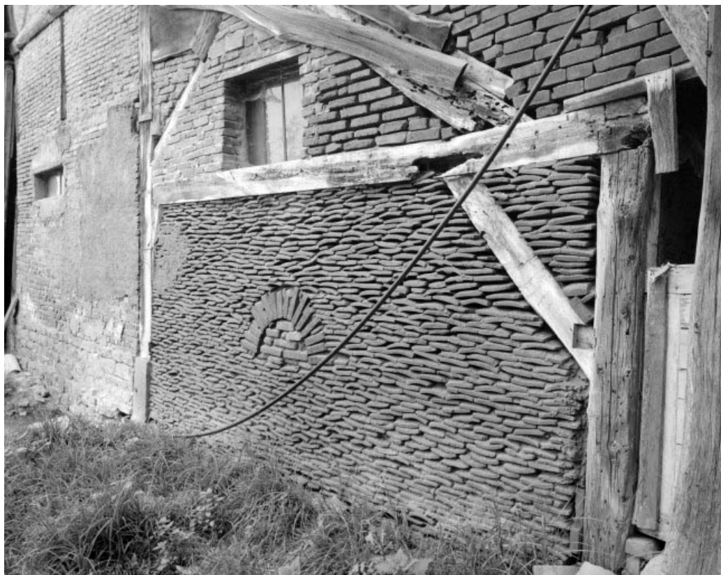
Façade ouest de l'écurie. Détail du pan-de-bois hourdé de tuiles et briques.