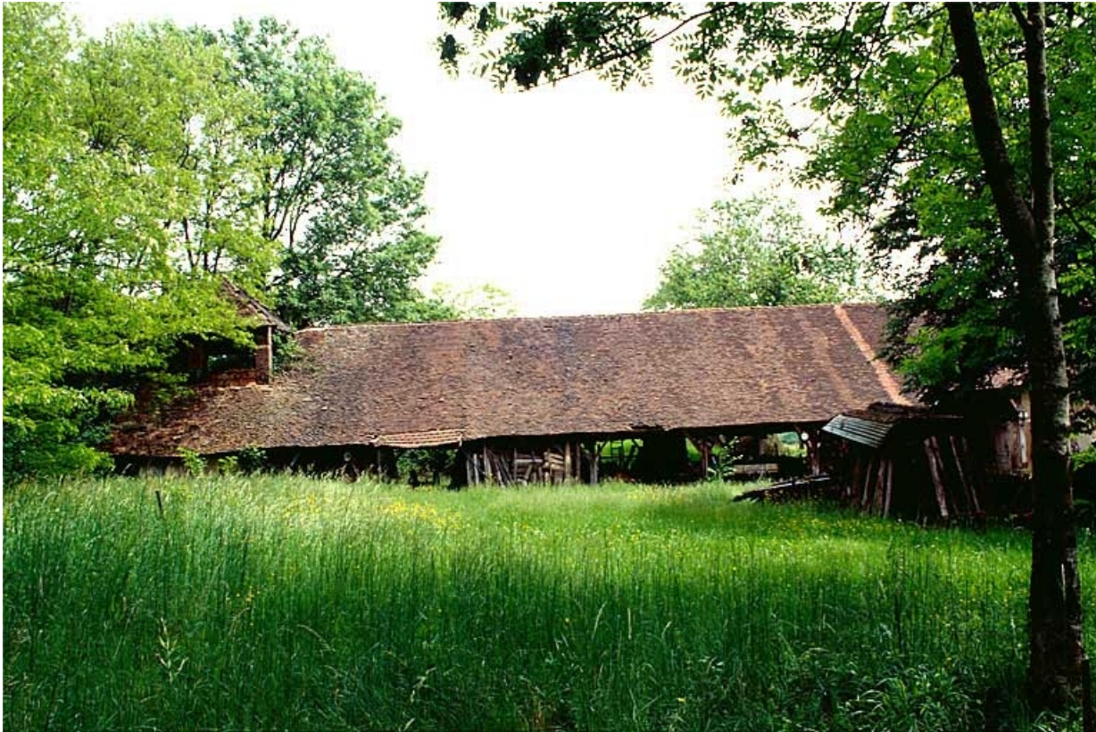
Bâtiment du four industriel et de la pièce de séchage.