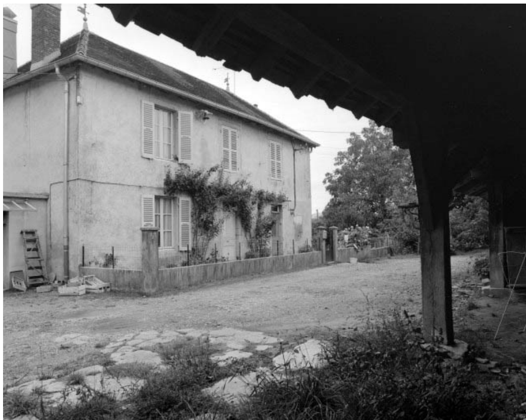
Logement patronal de trois quarts gauche.