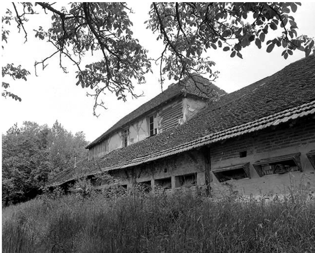
Pièce de séchage et logement d'ouvriers depuis le nord-ouest.