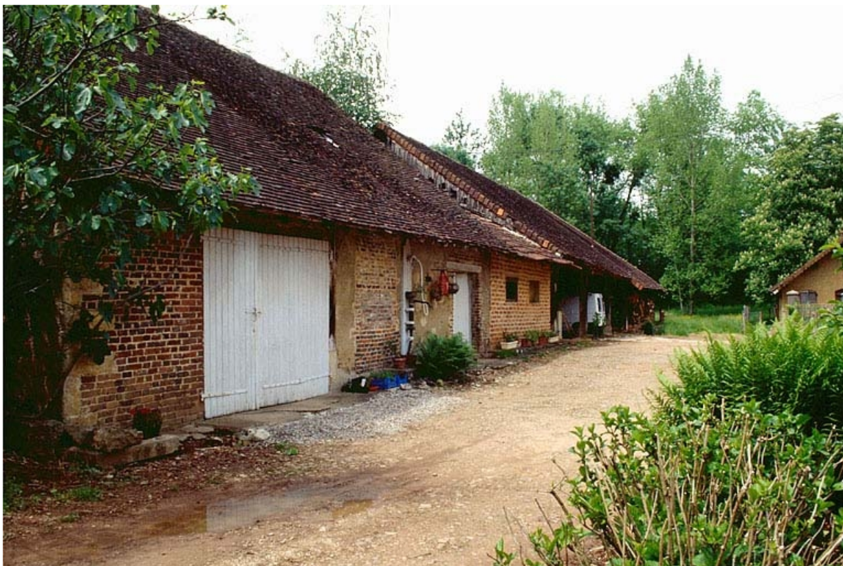
Remise et atelier de fabrication depuis le sud-est.