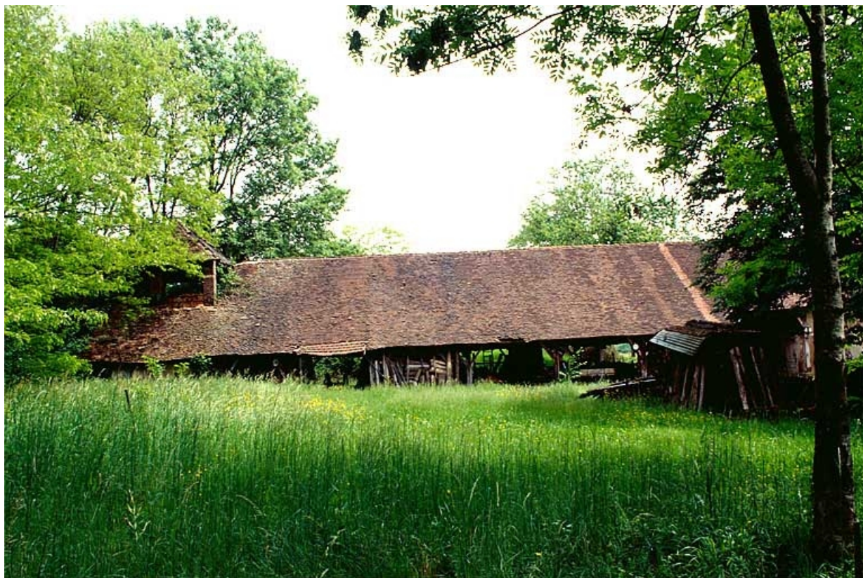
Bâtiment du four industriel et de la pièce de séchage.