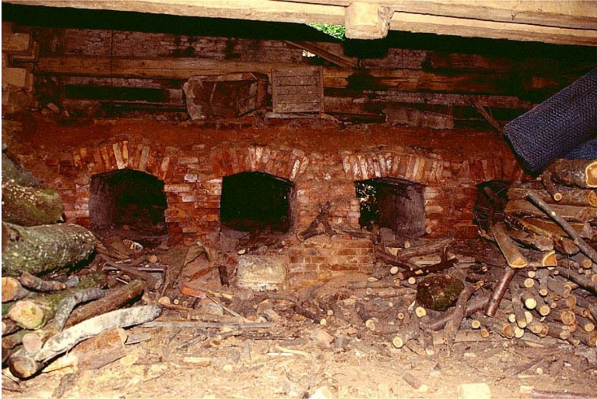
Gueules de charge du four.