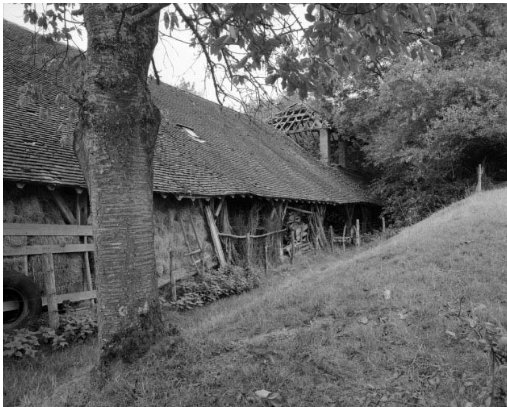
Pièce de séchage et four industriel depuis le sud-est.