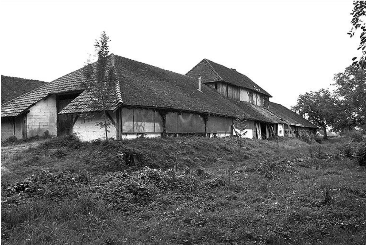
Pièce de séchage surmontée de son logement d'ouvriers.