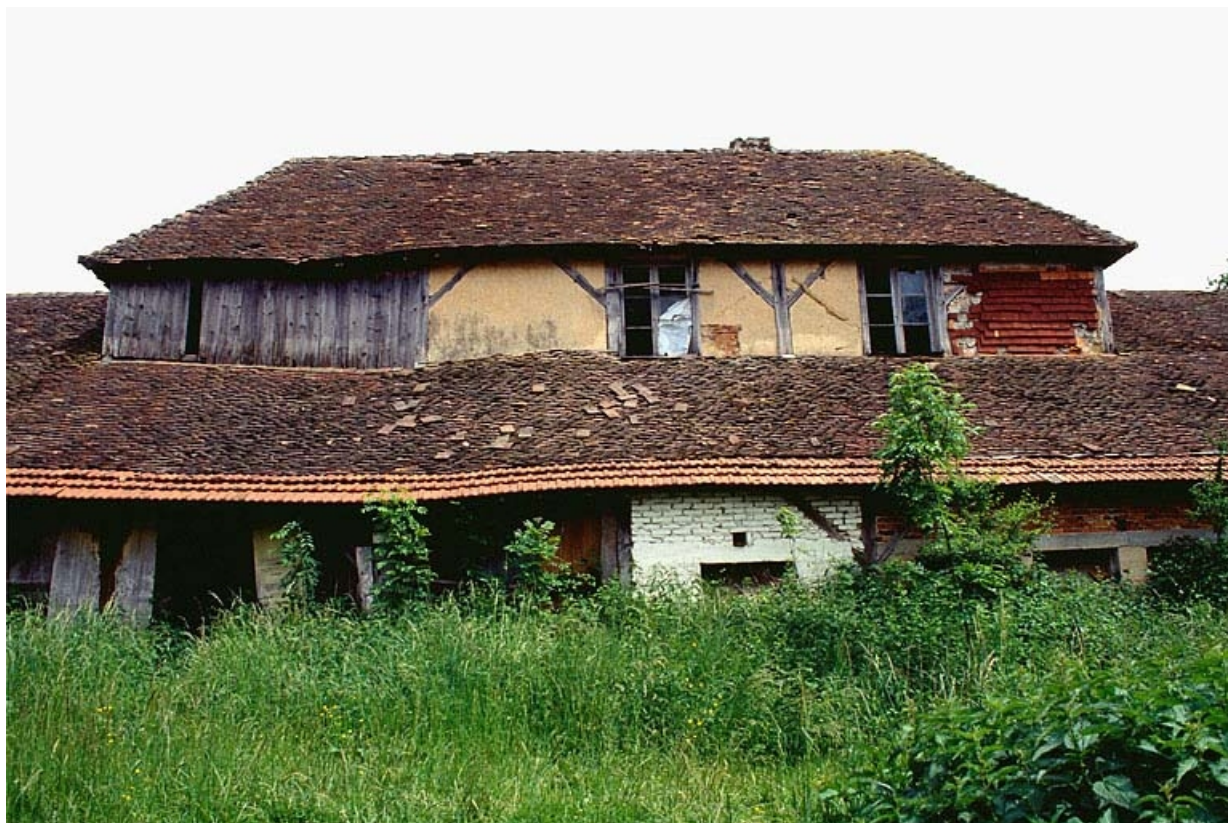
Façade ouest du logement d'ouvriers.