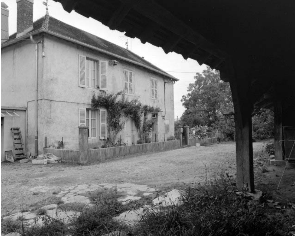
Logement patronal de trois quarts gauche.