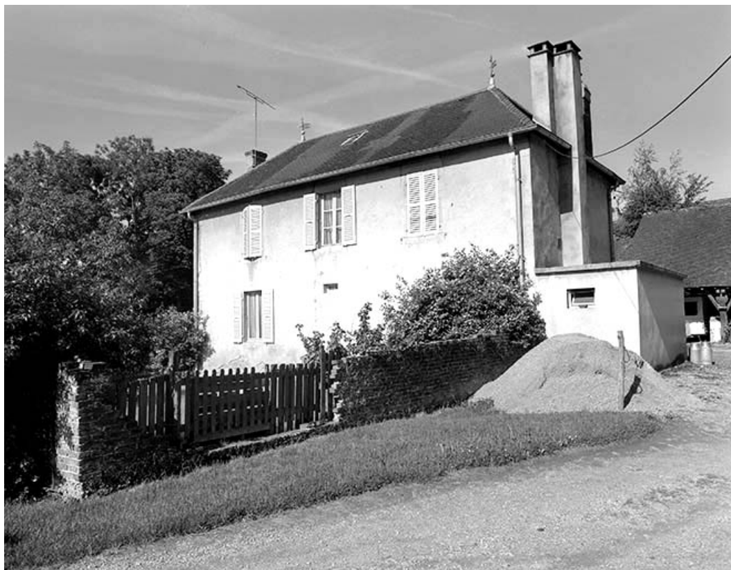
Façade postérieure du logement patronal.