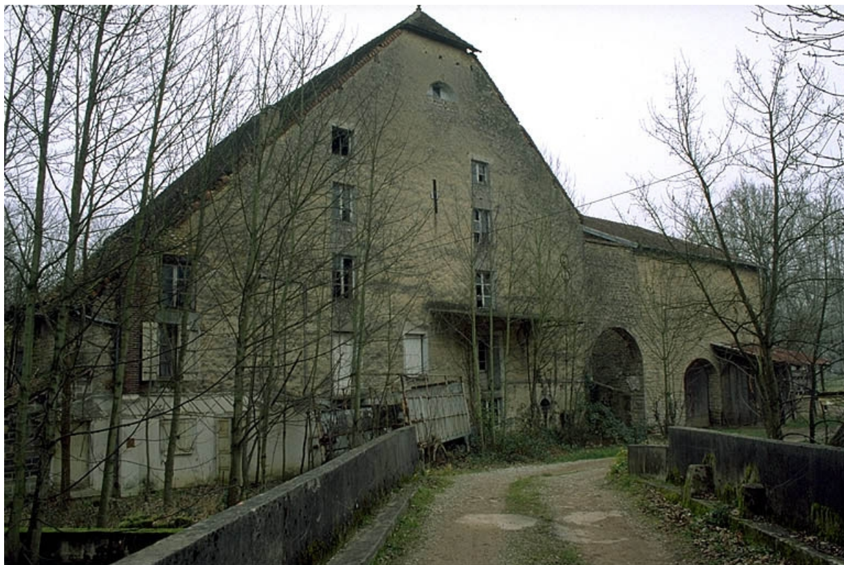
Façade antérieure de trois quarts gauche. 39, Courlans rue du Château