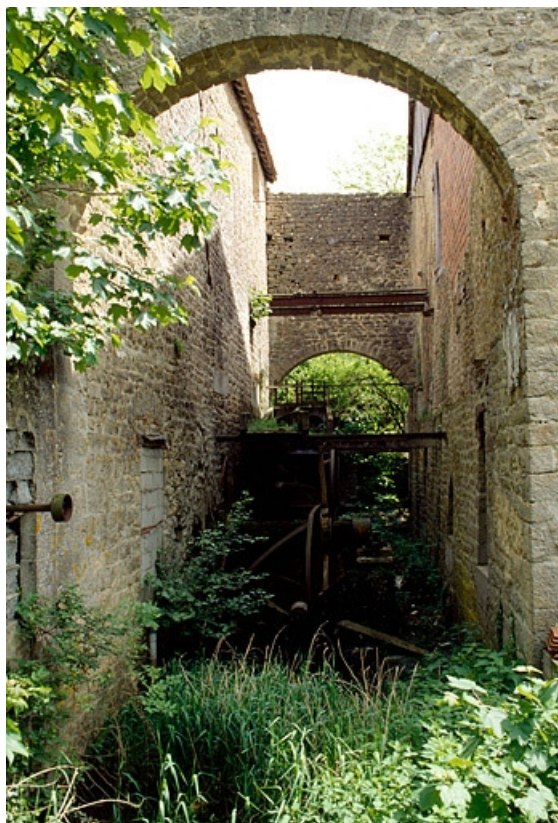
Bâtiment d'eau.Roues hydrauliques en ruine.