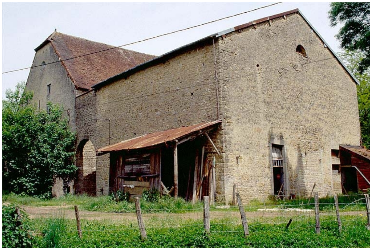
Façade antérieure de trois quarts droite. 39, Courlans rue du Château