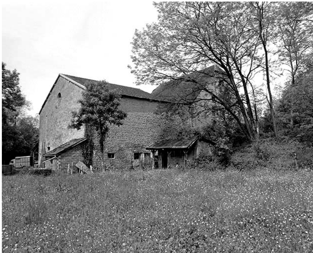
Façade postérieure de trois quarts gauche.