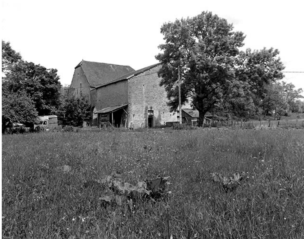
Vue d'ensemble depuis le sud-ouest.