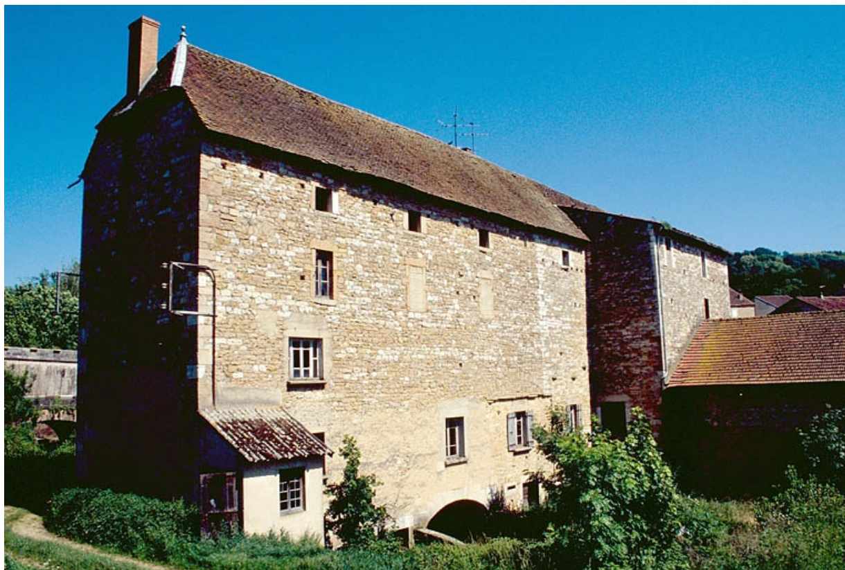
Façade postérieure de trois quarts gauche.