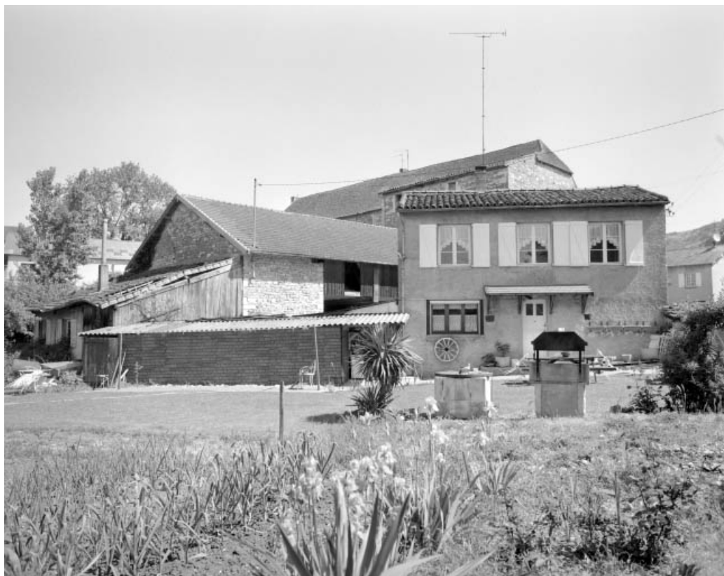
Parties agricoles et logement depuis le sud-ouest.