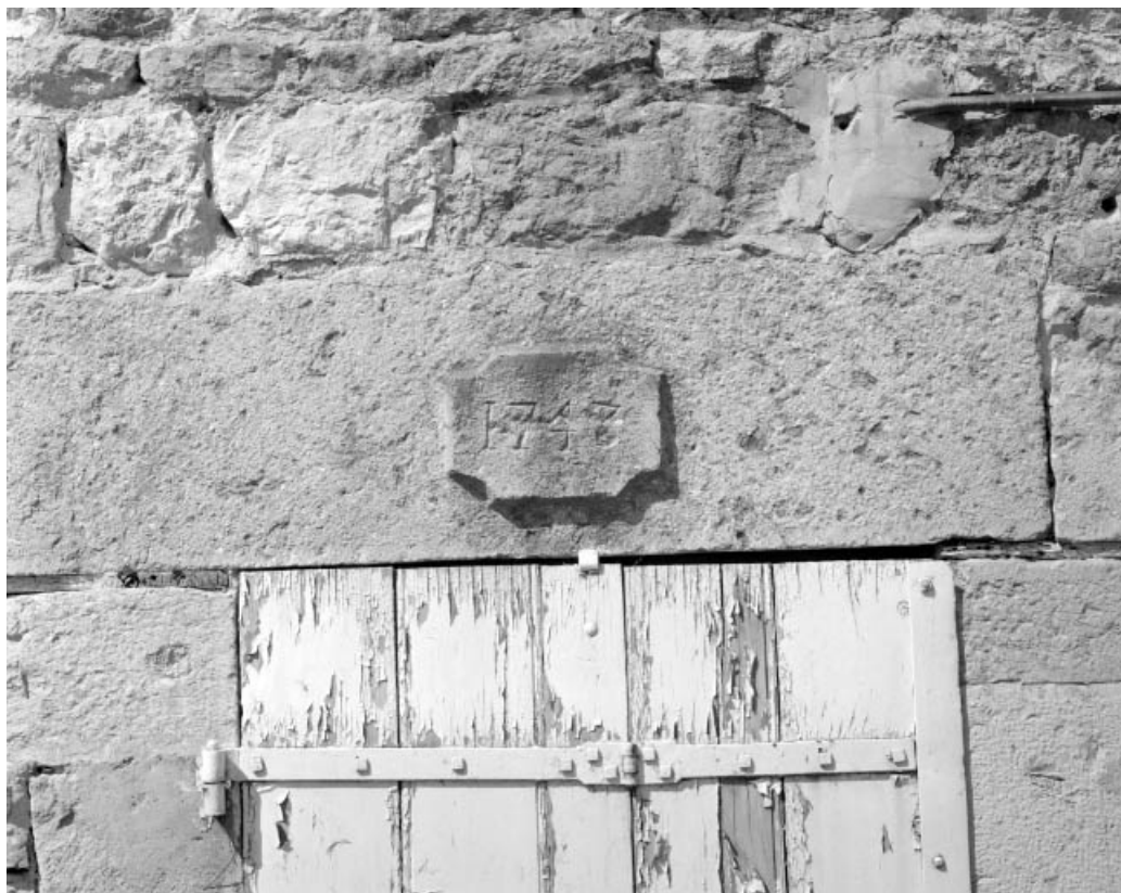
Date portée sur un linteau de la façade antérieure.