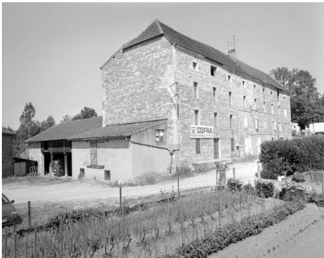
Parties agricoles et atelier de fabrication depuis le sud-est.