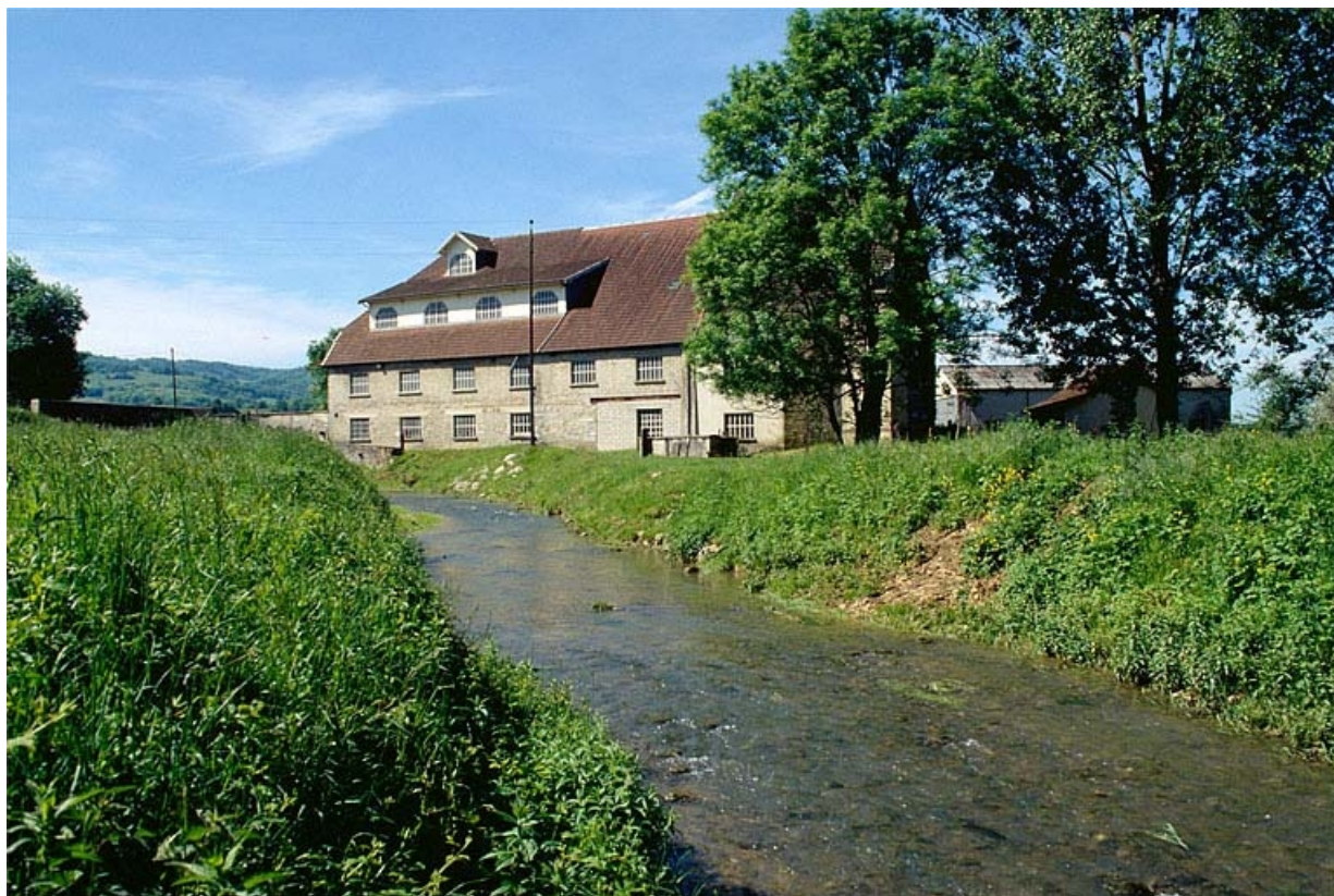
Vue d'ensemble depuis le nord.