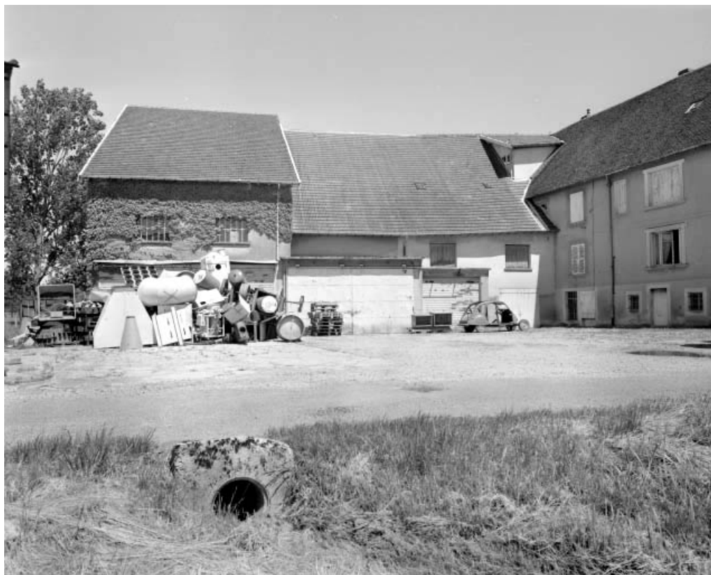
Façade postérieure de l'entrepôt industriel et de l'atelier de fabrication.