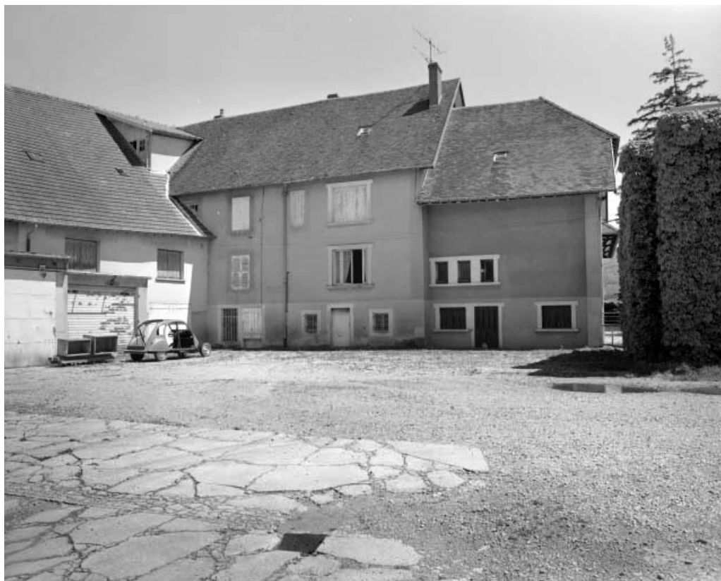
Façade postérieure du logement.