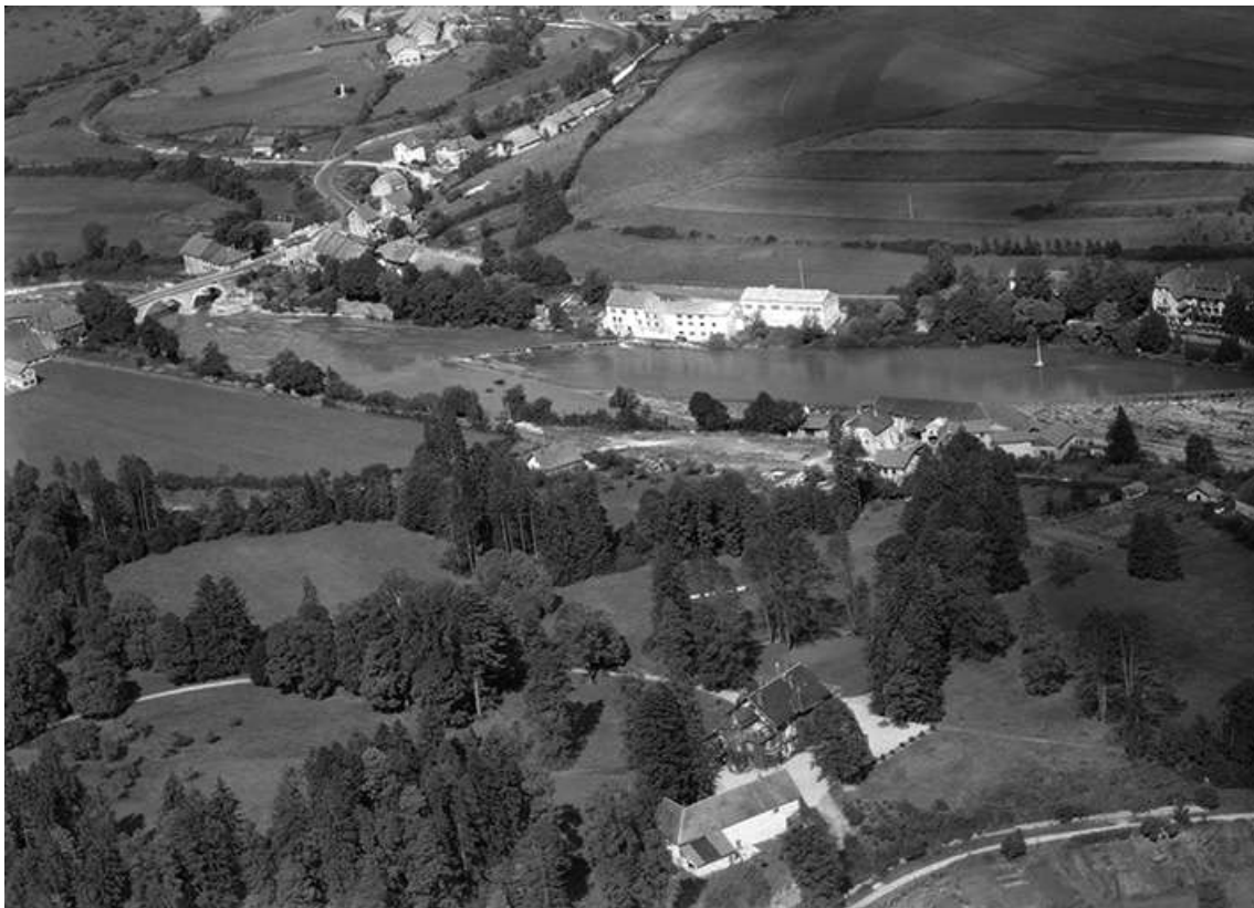
Vue de situation en 1956.

39, Pont-de-Poitte Grande Rue 1, 3, 4, 6