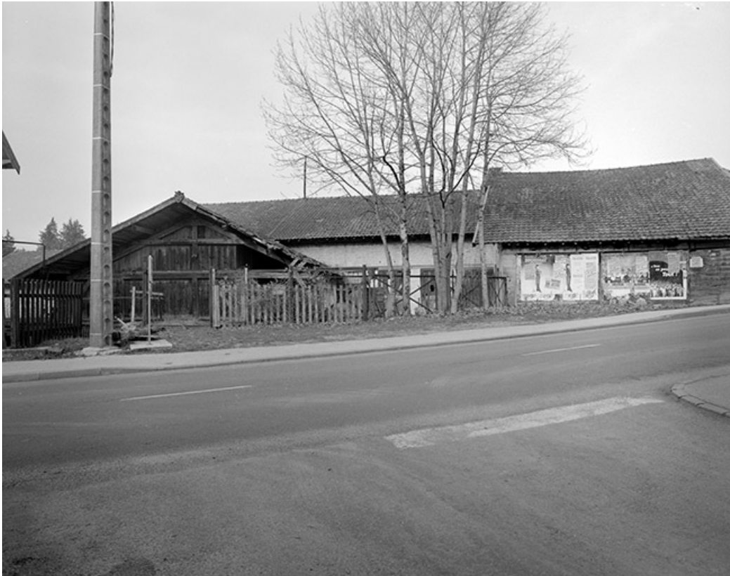
Atelier de fabrication depuis le sud. 39, Pont-de-Poitte Grande Rue 1, 3, 4, 6