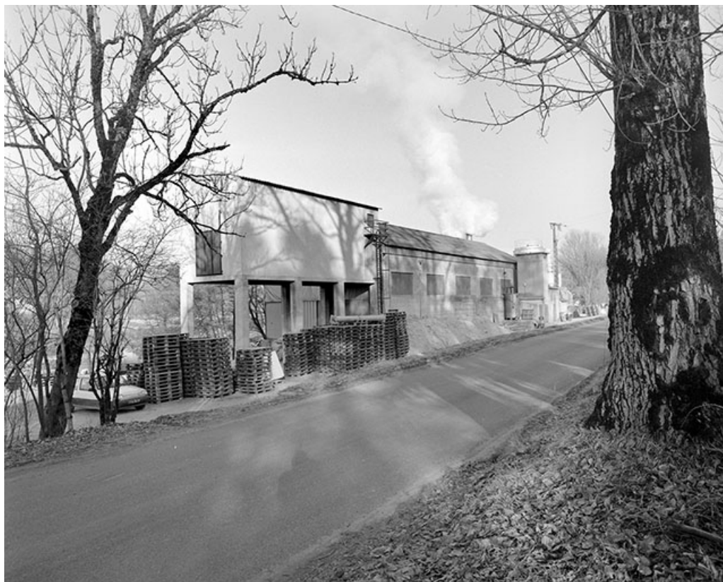
Entrepôt industriel et atelier de fabrication de l'usine de farine de bois. 39, Patornay route de Barésia