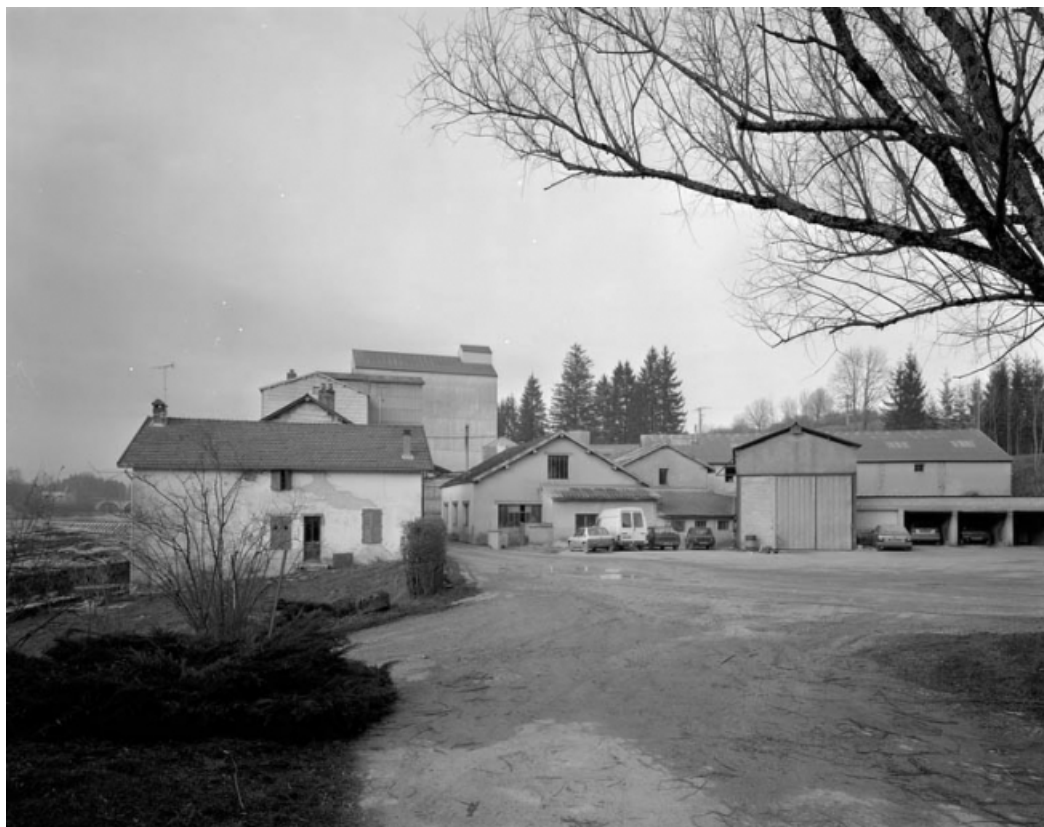
De gauche à droite : logement d'ouvriers, atelier de réparation et remises à automobiles. 39, Patornay route de Barésia