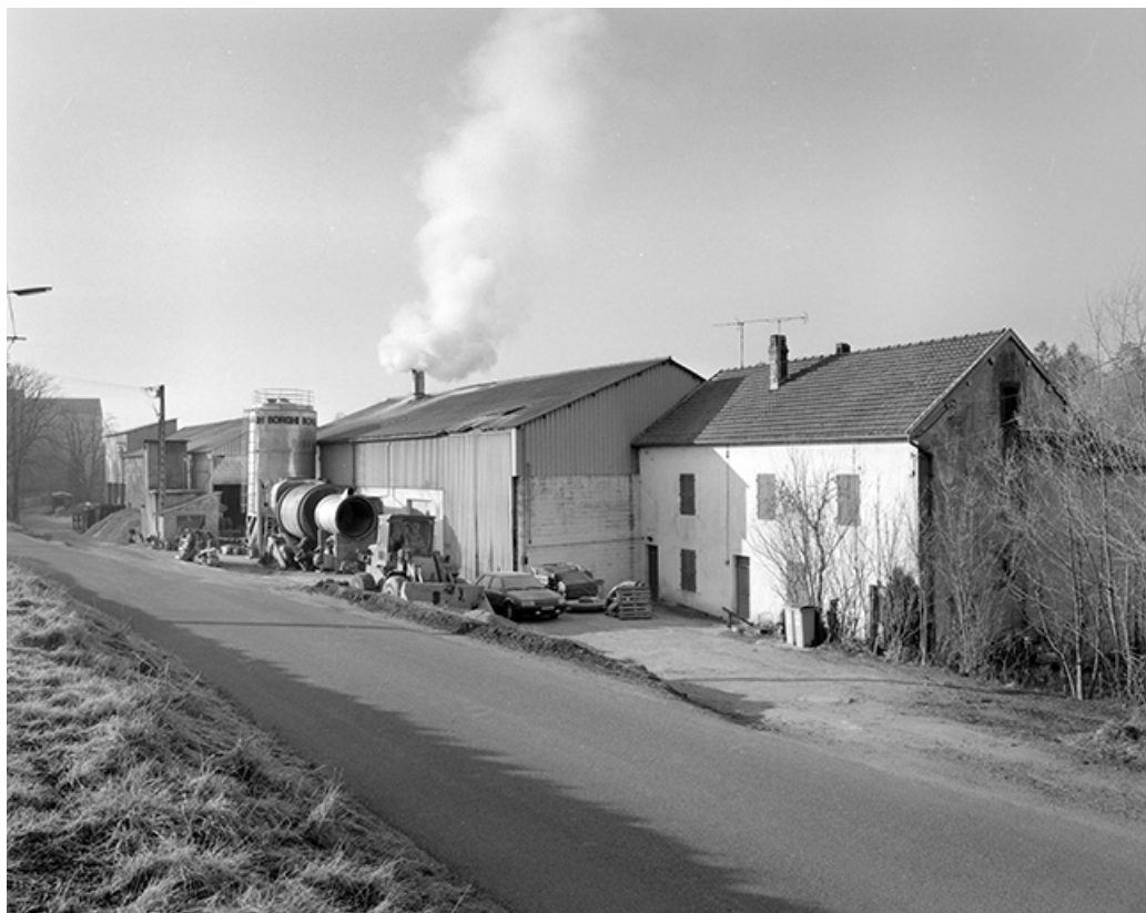
Usine de farine de bois depuis le nord-est. De gauche à droite : entrepôt industriel, atelier de fabrication et logement. 39, Patornay route de Barésia