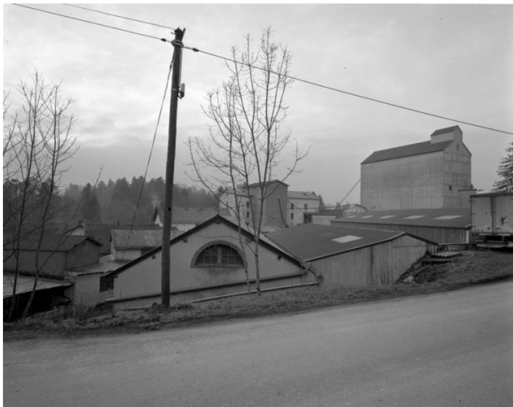
La minoterie vue de l'est.