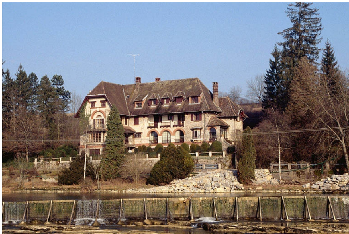
Façade antérieure du logement patronal.