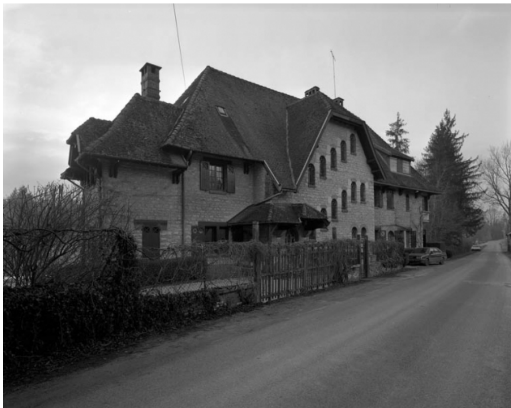
Façade antérieure du logement patronal de trois quarts gauche. 39, Patornay route de Barésia