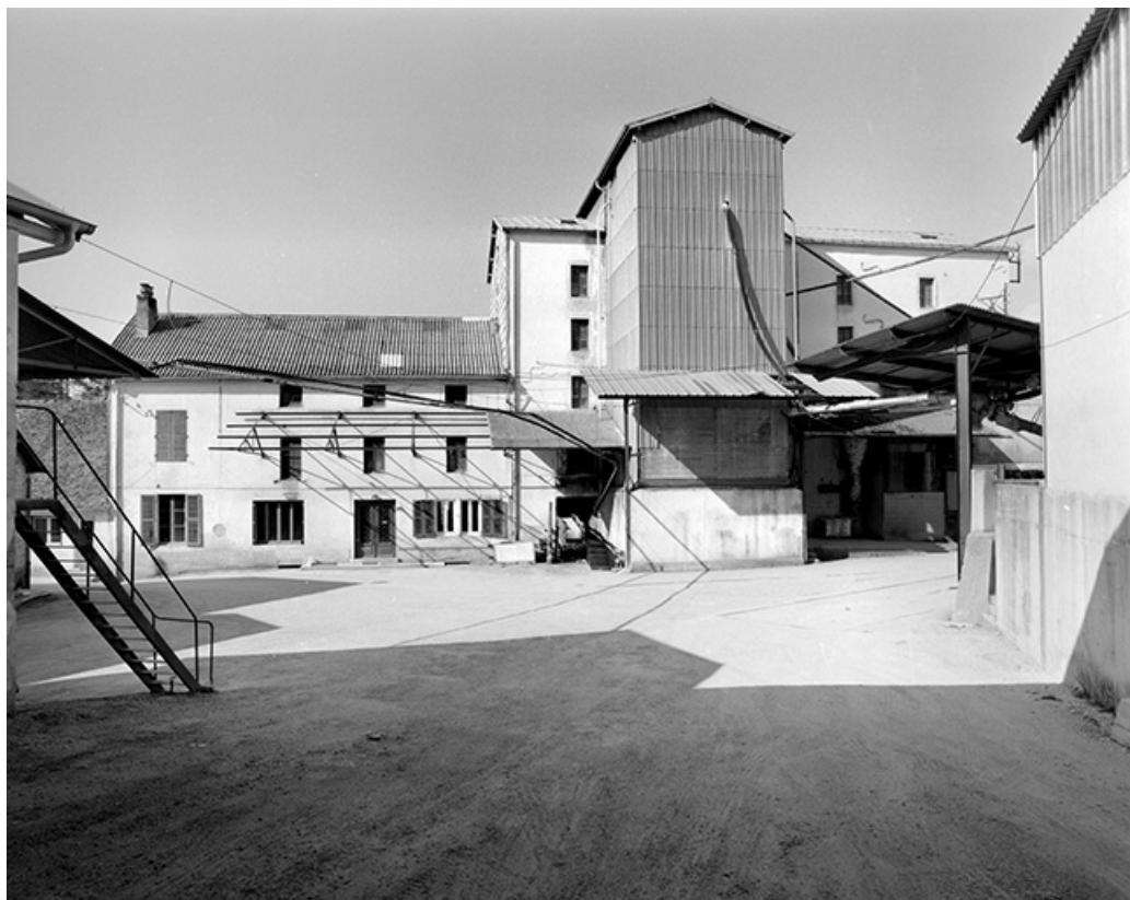
Bureau, atelier de fabrication et silo.