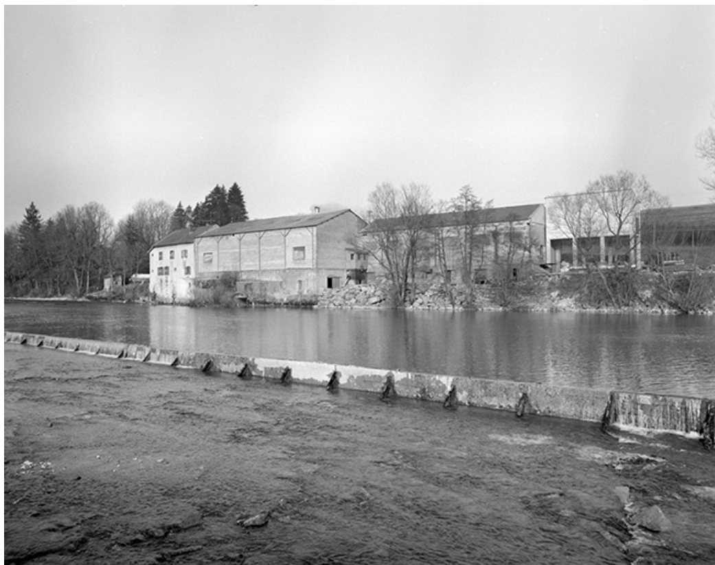
Usine de farine de bois depuis le sud-ouest.