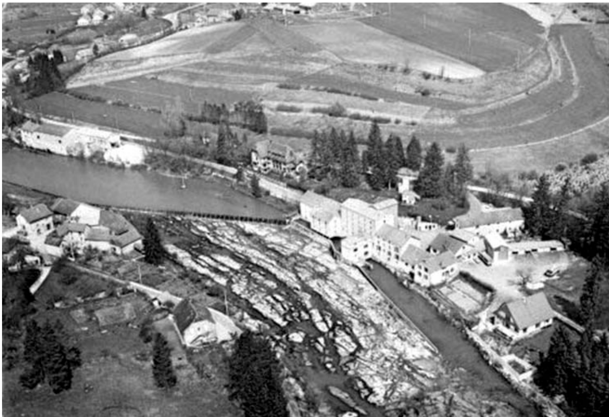
[Vue aérienne de la minoterie Sauvin].