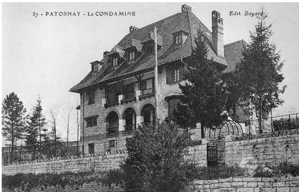
Patornay - La Condamine [vue aérienne].