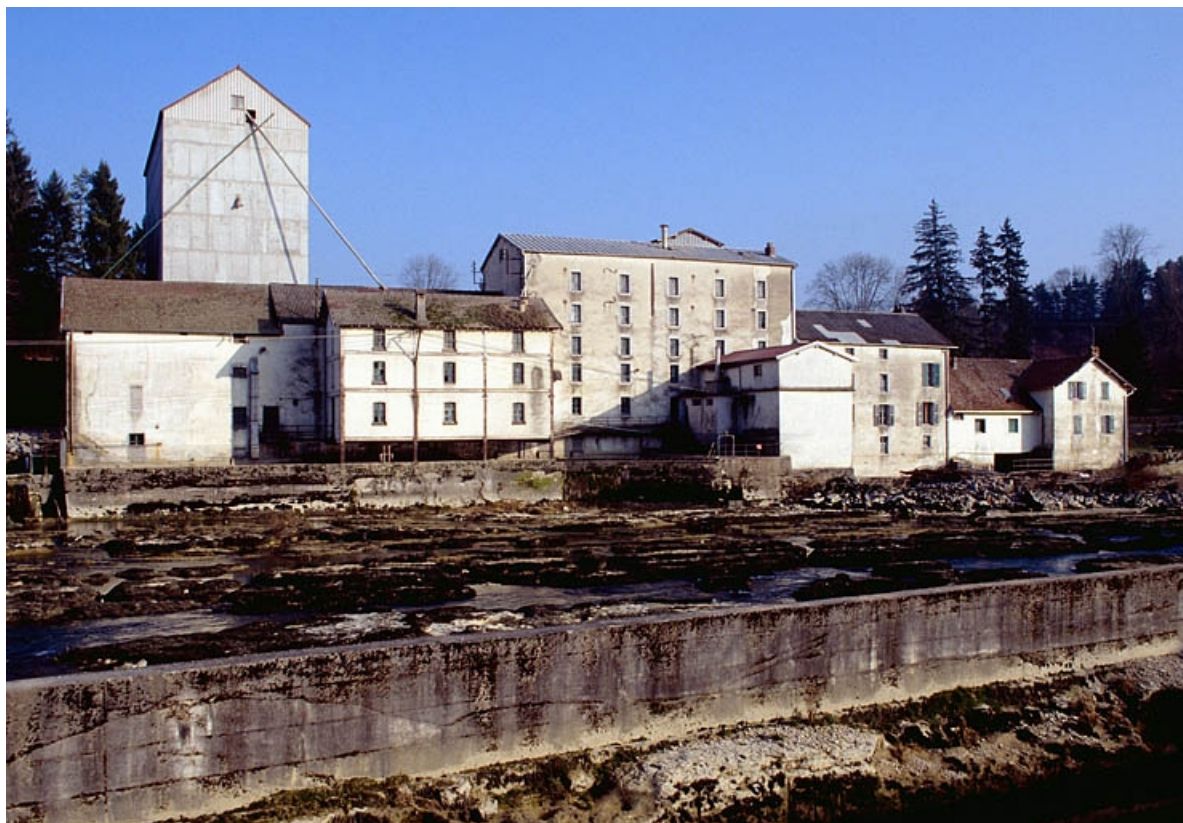
Façades postérieures de la minoterie sur la rivière de l'Ain.