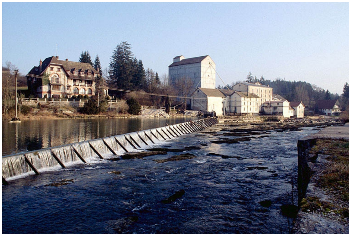
Au premier plan : barrage sur l'Ain.