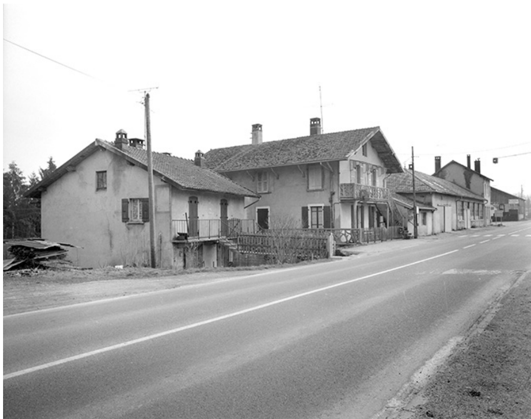
Vue d'ensemble depuis le nord. Logements et atelier de fabrication.

39, Clairvaux-les-Lacs, 16, 18, 20, 22, 23 route de Lons-le-Saunier