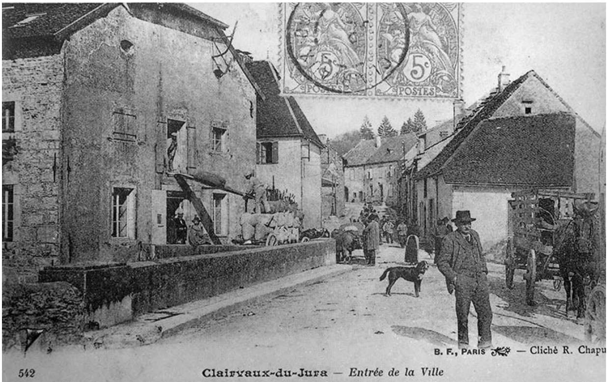
Clairvaux-du-Jura - Entrée de la ville.