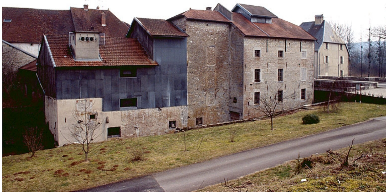
Vue d'ensemble depuis le nord-ouest.