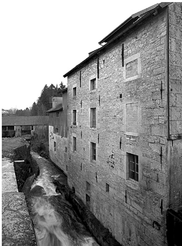
Façade sur le ruisseau de la Raillette.