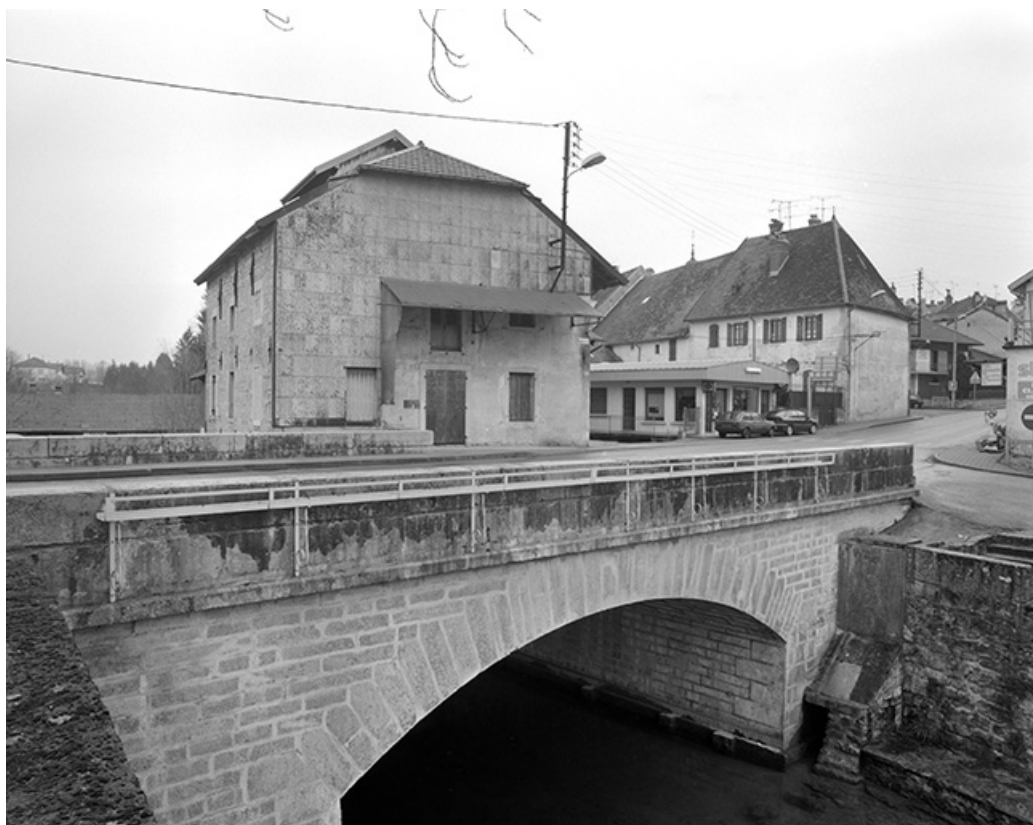
Vue d'ensemble depuis le sud.