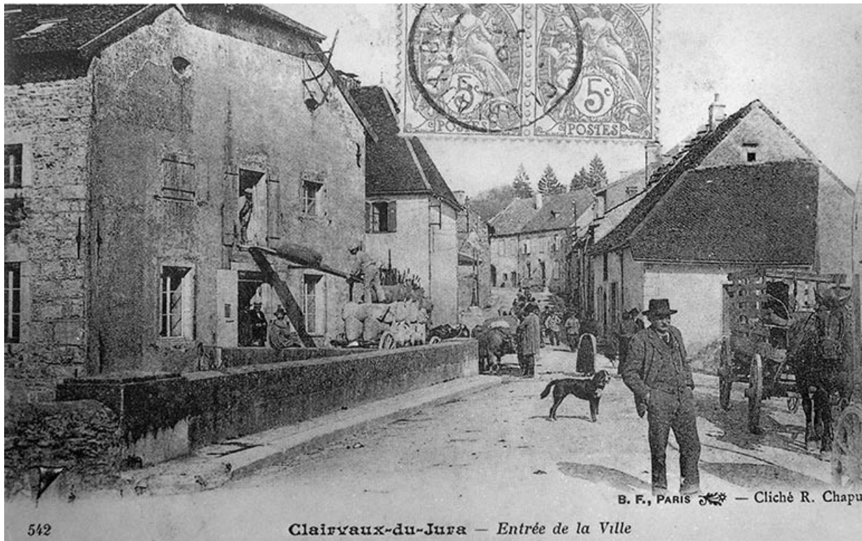
Clairvaux-du-Jura - Entrée de la ville.