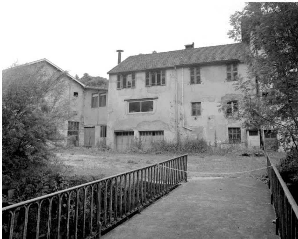
Façade postérieure du bureau et du logement.

39, Clairvaux-les-Lacs, lieudit : sous le Château