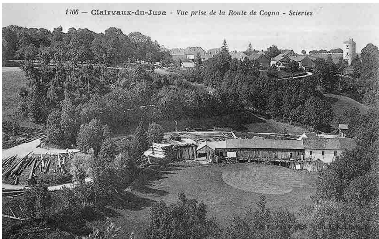
Clairvaux-du-Jura - Vue prise de la route de Cognac - Scieries.

39, Clairvaux-les-Lacs, lieudit : sous le Château