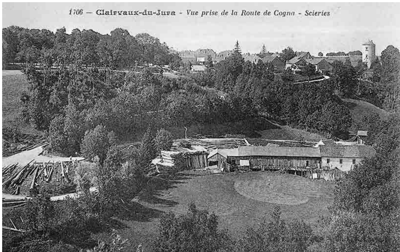
Clairvaux-du-Jura - Vue prise de la route de Cognac - Scieries.

39, Clairvaux-les-Lacs, lieudit : sous le Château